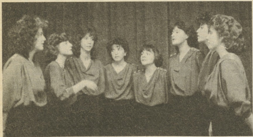
Sovodenjski nonet med sobotnim koncertom v Borštu

V srenjski hiši v Borštu je bila v soboto zvečer kulturna prireditev, na kateri je domača dramska skupina ponovila veseloigro »Življenje, veselje in trpljenje«. Na večeru sta nastopila