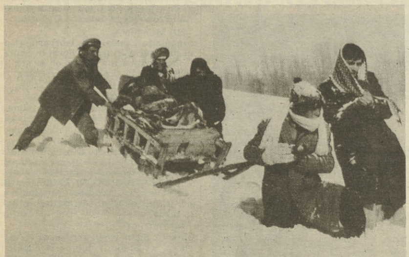
V Turčiji je v zimskem času kdaj tako hudo, da je treba bolnika kar na sankah peljati do zdravnika