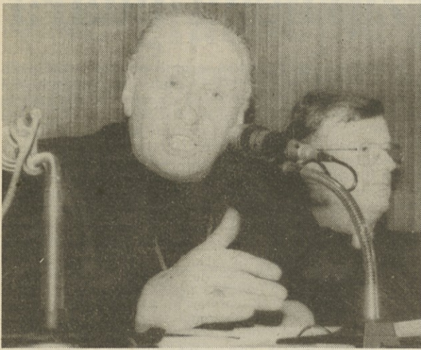
Francoski kardinal Roger Etchegaray

VATIKAN — Cerkev kot »moralna sila« prevzema vedno večjo vlogo posrednika v mednarodnih zostritvah. Od industrijskih držav, njihovih gospodarskih in finančnih krogov terja zdaj, v njihovem lastnem interesu, več »modrosti«, »pravičnosti« in »radodarnosti« v odnosu do zadolženih v Tretjem svetu. Odgovornim v državah v razvoju pa priporoča, da pojasnijo svoje odgovornosti pri zadolževanju (izkoriščanje struktur, davčne utaje, podkupovanje, beg zasebnega kapitala itd.). Od vseh pa pričakuje »sodgovornost«, in to še preden »bosta pomanjkanje in egoizem zasebnikov ter skupnosti prerasla v neizbežen spopad«. Vprašanje je »težavno, zapleteno in neodložljivo«, o njem pa Sveta stolica objavlja dolg dokument, ki ga je javnost dolgo pričakovala, ki so ga terjale vlade in škojfe Tretjega sveta in ki ga je sestavila in včeraj objavila