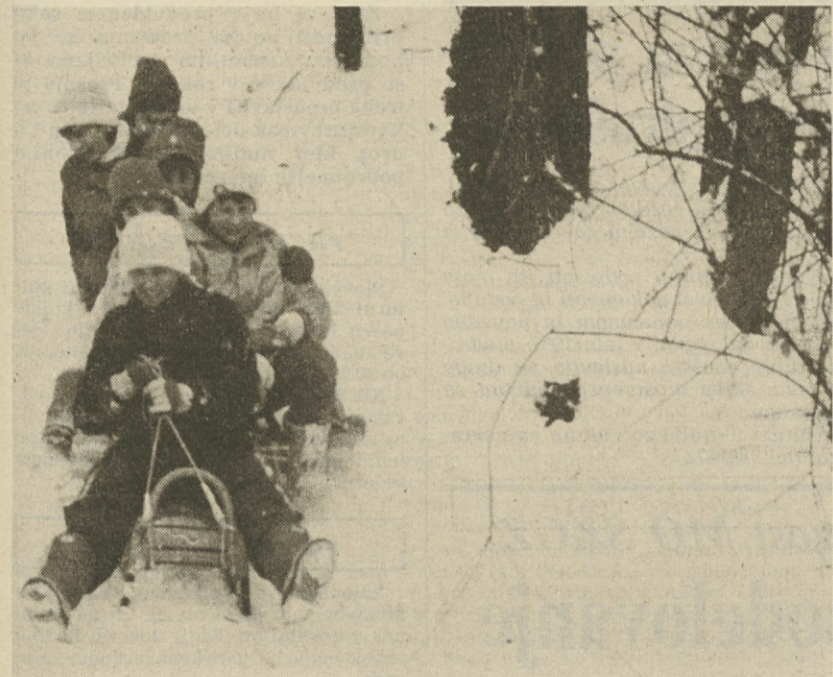
Veselo, razposajeno, zabavno in družabno. Tako si zamišljamo 1. zimske športne igre sklada Mitja Čuk februarja v Ovčji vasi

V obeh oddajah lahko neposredno sodelujejo tudi poslušalci tako, da telefonirajo na številko 212658.