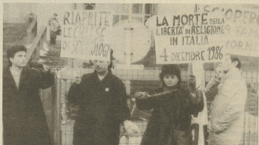
Pripadniki sekte »Scientology«, ki je vpletena v sodni proces, so včeraj v Milanu demonstrirali proti »preganjanju«