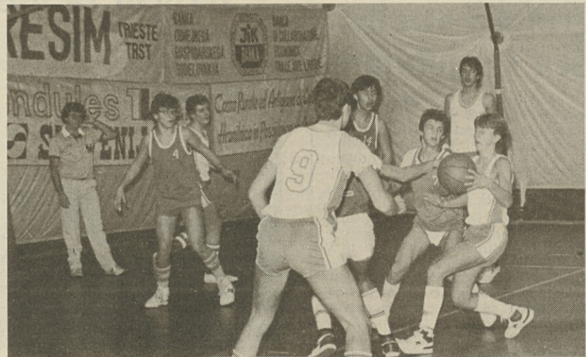
Borovi kadeti (na sliki s Stello Azzurro) so med protagonisti lige

Bila je to prva tekma Brežanov na turnirju Zini in Rosenwasser. Le v prvi četrtini je bila tekma izenačena, nato pa so gostje igrali boljše in zmagali. Brežani so igrali pod svojimi sposobnostmi, saj brez podaj in obrambe ni mogoče zmagati. Pohvalo zaslužijo Corca in Gobba za igro v obrambi, Ota pa v napadu. (R. Ž.)