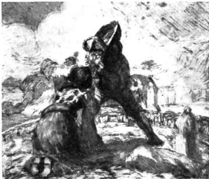
Ivan Grohar: Krompir