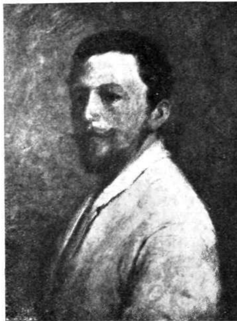
Ivan Grohar: Lastna podoba

4. julija 1905, da »gosp. Ivan Grohar v Ljubljani je vplačal za 1. opravilni delež K Dvajset«, 5 potrdil o dvigu posojila na menico iz let 1903, 1904, 1905 in 1907 ter 3 recipisi o nakazilu denarja Splošnemu kreditnemu društvu iz l. 1908 in 1909; ter potni list, izdan 31. decembra 1906 od mestnega magistrata ljubljanskega za potovanje v vse evropske države z veljavnostjo treh let, iz katerega je razvidno, da je bil Grohar meseca januarja in februarja 1907 v Srbiji.