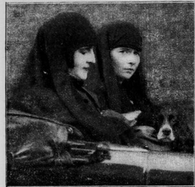
Kraljica Marija s svojo sestro grško kraljico Olgo na svoji desni. Naš posnetek je prva slika obeh kraljic v zaslavljanju.

bila, da si je prišel ogledat to »razupito« dirkalno progo. V prenavdušenem občudovanju alpskih krasot je s sprednjim delom vozila pozobal občestni kamen in obitčar v jarku. Tudi tu sta kralja izstopila in si v razgovoru z lastnikom ogledala elegantno vozilo, ki mu pa karambol ni zapustil nikake poškodbe.