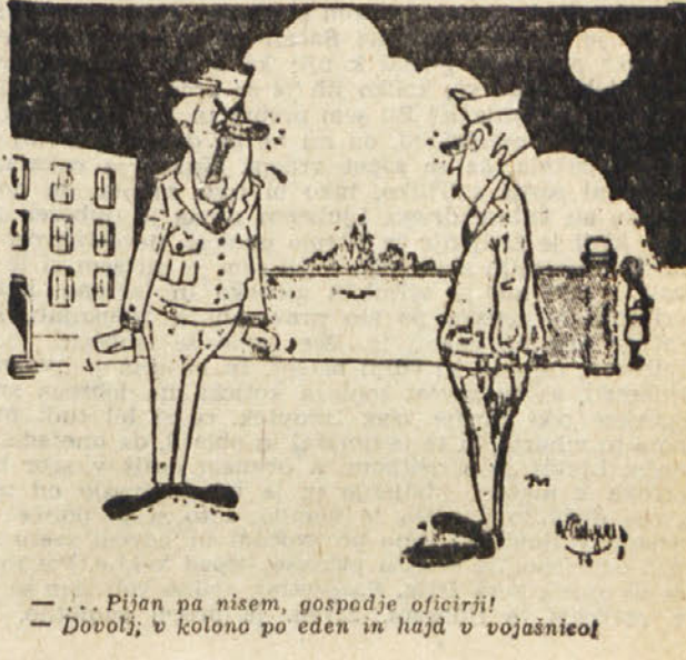
... Pijan pa nisem, gospodje oficirji! — Dobro!; v kolono po eden in hajd v vojašnico!