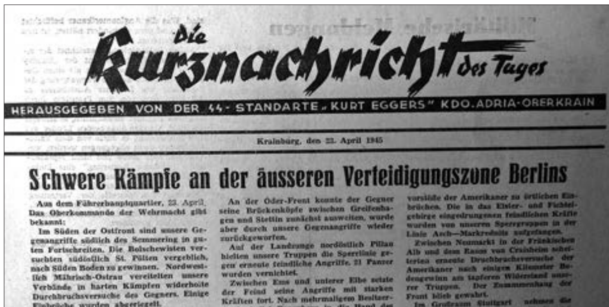
Glava naslovnice časopisa Die Kurznachricht des Tages z dne 23. aprila 1945.

cijo, zato so bili vsi trije nemški pogajalci po daljšem zaslišanju »aretirani, zaslišani in likvidirani«. 43