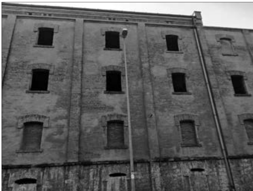
Poslopje tržaške Rižarne junija 2019 (foto: Jure Janežič).

v moči treh čet, ki so bile nastanjene v Gorici (1.), Trstu (2.) ter na Reki in v Pulju (3.). Konec aprila sta bili ustanovljeni še 4. in 5. četa, ob tem pa tudi štabna četa (iz vzhodnoevropske čete) in transportni vod. 20