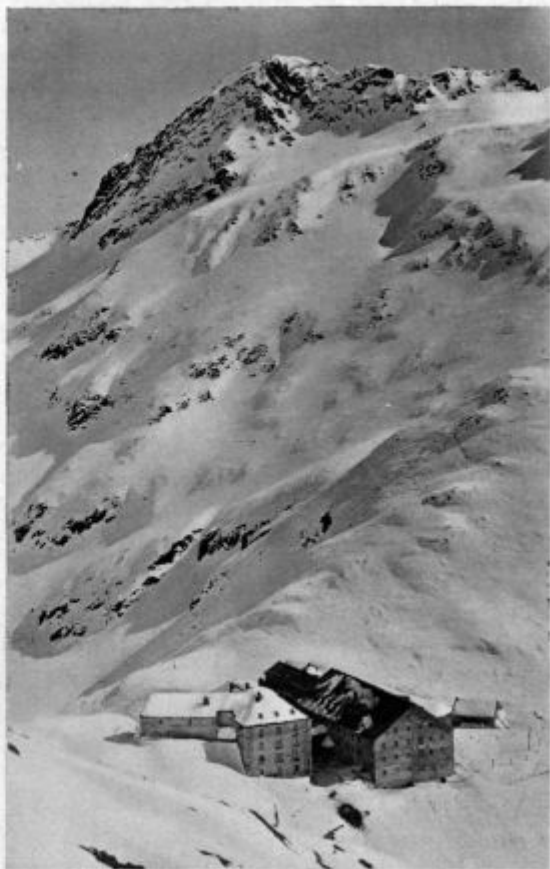
Veliki Sv. Bernard pozimi

Občestvo življenja je tako prevzelo najini