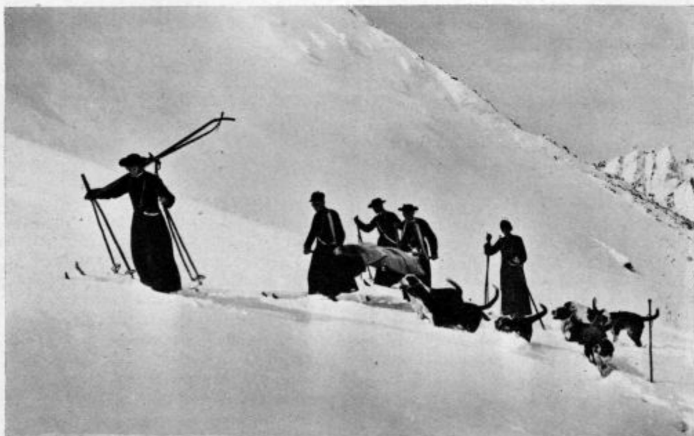
Redovniki rešujejo z bernardinskimi psi ponesrečence iz sneženih zametov

Med tem so se pa katoličani opomogli in popravili, kar so poprej zamudili: ustanovili so novo ljudsko zvezo »Accion Popular«, ki jo vodi mlad, neustrašen in navdušen katoličan (Gil Robles); širiti so jeli katoliško časopisje. Mesece so se pripravljali