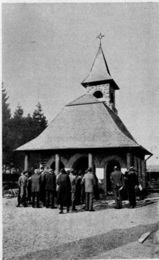
Kapelica v Banneux (Belgija)