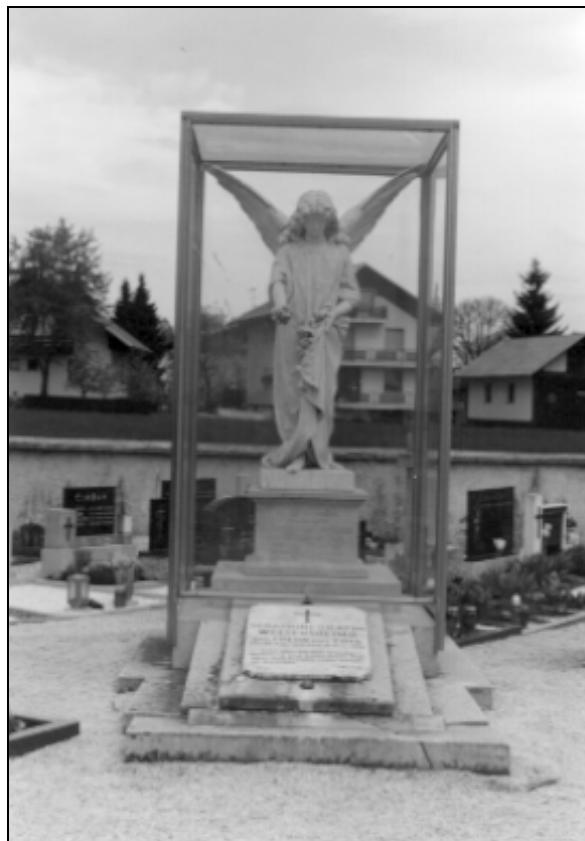
Grobnica Zoisov na pokopališču v Predosljah.