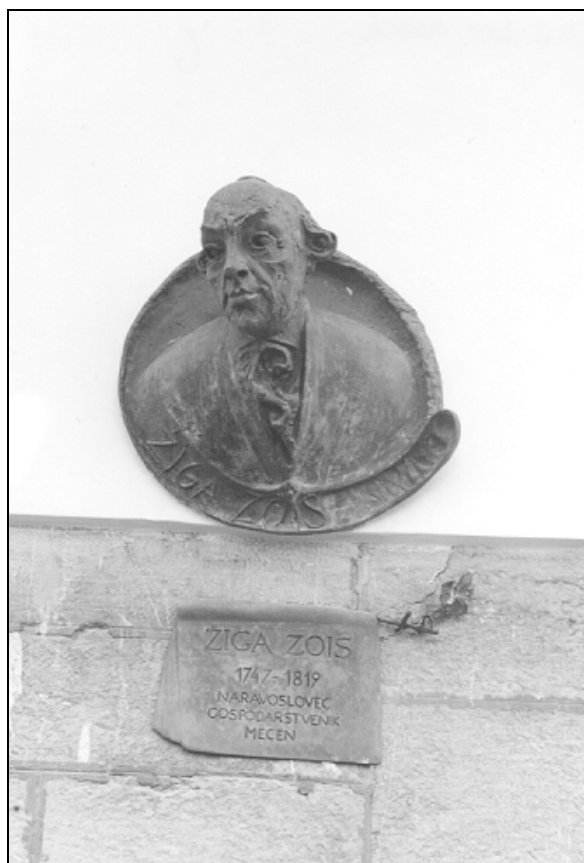
Doprnski kip Žige Zoisa na njegovi hiši na Bregu v Ljubljani.