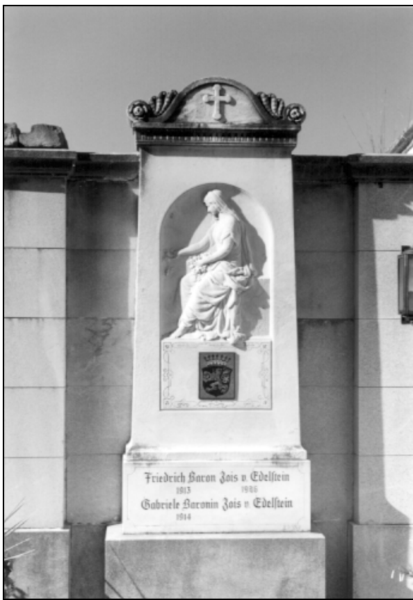
Nagrobnik kranjske veje rodbine Zois na pokopališču St. Peter v Gradcu.