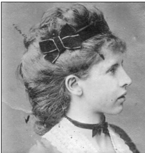
Baronica Zois pl. Edelstein (StLA, Leopold Bude Sammlung, K5 H11, št. 18789).

in Žigo (1821), teoretično pa bi lahko bil tudi njun stric, torej sin starejšega Franca. Čeprav se to ne zdi prav verjetno.