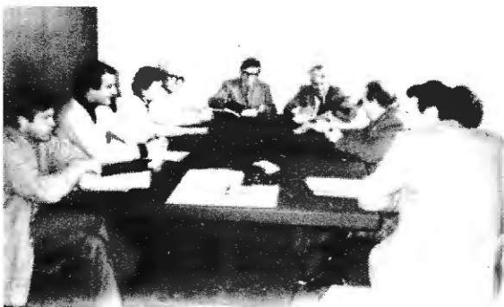
Uredniški odbor Savinjskih novic leta 1976