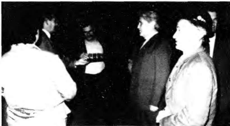
Med podoknico je bilo zelo živahno.

listin starega Mozirja. Pohod ob trških mejah so organizirala društva (planinsko društvo, TVD Partizan, društvo upokojencev in lovska družina). Tudi kmetije, mimo katerih so pohodniki hodili, so bile obveščene in obljubile so pomoč ter tudi dober sprejem. Vsa besedila in scenarije sem napisal sam.