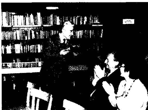
Med predstavitvijo knjige o furmanih.

Takoj po prihodu v Mozirje so me uredniki nekaterih časopisov prosili za dopisovanje. Tako sem dopisoval v Novi tednik, Lipo, Naš čas in Radio Celje. Seveda so bili moji članki vezani na razne dogodke, ki niso zahtevali podrobnosti in neke širine. Med gradnjo sva z ženo, ki se je še vozila v Celje, ker je delala v železniški ambulanti, stanovala v najetem stanovanju. Tam sem imel pisalni stroj Erika in fotoaparati; tako sem lahko v skromnem obsegu zadostil željam