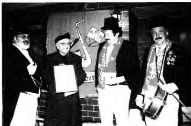
Trške pravice mi je leta 1999 podelil Pust Mozirski.