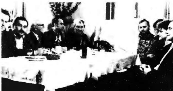
V Šmihelu so mi pripravili poslovilno srečanje ob prenehanju mojega urednikovanja

Z našim občinskim glasilom pa ni bilo vedno lahko. Tedaj je še prihajalo v naše domove brezplačno. Gmotno so omogočile njegovo izhajanje delovne in družbenopolitične organizacije, malo pa tudi občina. Včasih je bilo tako, da sem pri kateri od številik moral na »fehtarijo« za manjkajoči znesek. Predvsem tedanji Izvršni svet občine Mozirje je na koncu pomagal iz zadrege. Če je bilo vreme tako, da si nisem upal sam za volan in na pot v Novo mesto, so radi pomagali s prevozom.