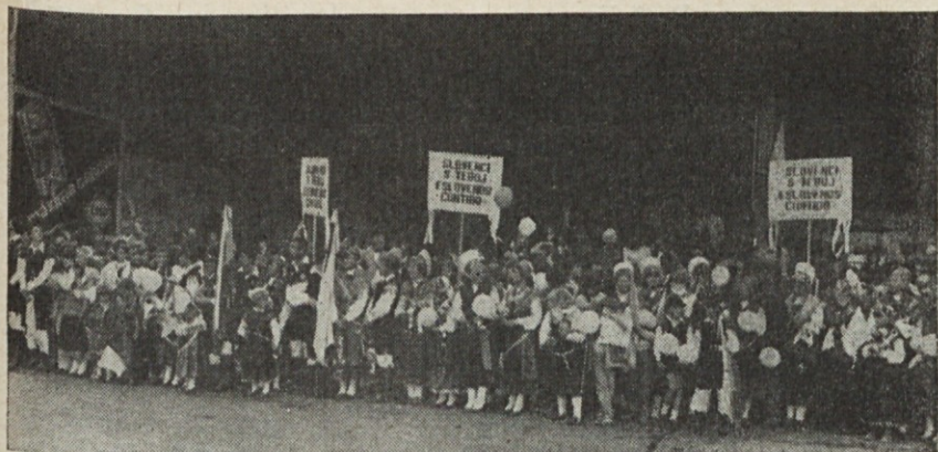
Skupina slovenskih narodnih noš čaka skupaj z veliko množico Slovencev na papežev mimohod v Marijino božjepotno svetišče v Luján ob Rivadaviji v Haedu.

nizki oder in ob mrzlem dežju, ki je začel tedaj padati, prebral pozdravni govor. Povedal je, da hoče v tem zgodovinsko bolečem trenutku s svojo navzočnostjo vidno izraziti svojo ljubezen; prositi za Kristusov mir nad žrtve obeh taborov v bojnem sporu med Argentino in Veliko Britanijo, biti blizu družinam, ki objokujejo izgubo dragega člana; prositi vlade in mednarodno skupnost za pravilne ukrepe, da bi se izognili hujšim žrtvam, zacelili rane, ki jih je prizadela vojna, in olajšali vzpostavitve pravičnega in trajnega miru in postopno pomiritev duhov. Prišel je, da poklekne k nogam Nje, za katero ima vsak človek eno ime: sin, pred Mater Kristusa in Mater Cerkve v njenem svetišču v Lujanu, in jo prosi, naj obriše tolikere solze, naj okrepi vse, ki omagujejo pod težo preizkušenj, naj zbudí nove sile za dobro v narod-