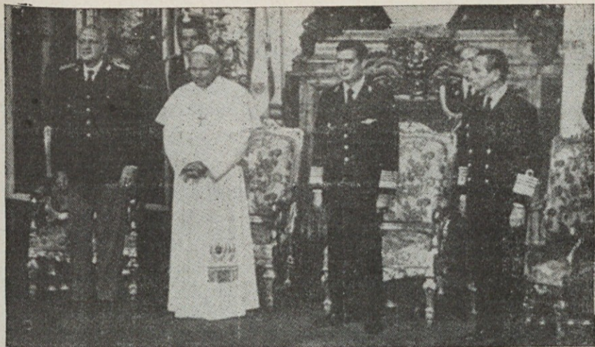
Janez Pavel II. v vladni palači s člani vladne vojaške hunte.

mladih Slovencev v narodnih nošah s slovensko zastavo in s transparentom z napisom: Slovenci s teboj! Sv. oče je skupino opazil, ji pomahal in jo blagoslovil ter se oziral k njej še potem, ko je avtomobil peljal naprej.