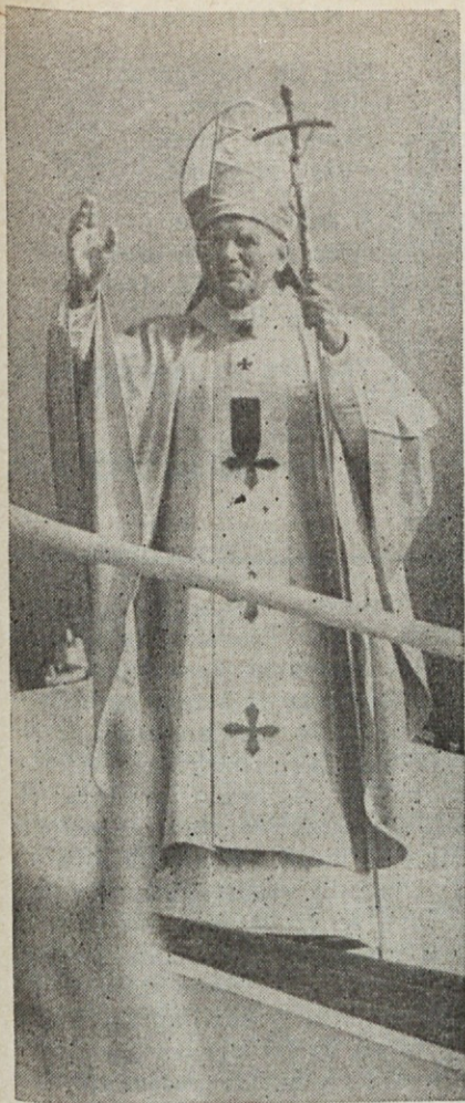
Ob koncu mašne daritve sv. oče blagoslavlja morje vernikov in se poslavlja od Argentine.

nas združuje, spravlja in povzdiguje človekovo dostojanstvo. Resnica o Jezusovem Rešnjem telesu in Rešnji krvi naj bo luč za