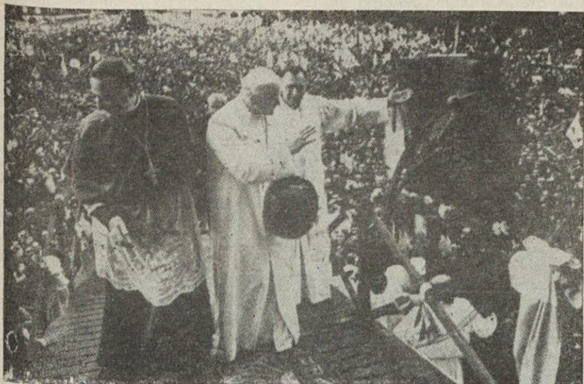
Prihod sv. očeta k oltarju pred lujansko baziliko. K papeževi maši se je zbralo v Lujanu nad pol milijona vernikov. Ob papežu mercedeški škof in lujanski župnik.

za — in v njem nas vse — za nje- ne otroke. Človek je bil tako po- vzdignjen v posinovljenega božje- ga otroka in dediča nebes po Je- zuscvem križu. Križ ima zato tu- di v življenju vernega človeka smisel in silno vrednost. Glejmo zato na Kristusov in svoj križ z očmi vere. V lujansko svetišče sem prihitel, da bi molil z vami in za vas in da bi vas vse posve- til Kraljici miru. Njej izročam najprej vse tiste, ki so zgubili živ- ljenje v sedanjih bojnih spopa- dih; potem tiste, ki so zgubili zdravje in so sedaj po bolnišni- cah; posvečam ji vse družine in ves narod. Naj bodo vsi deležni povzdignjenja v Kristusu. Naj