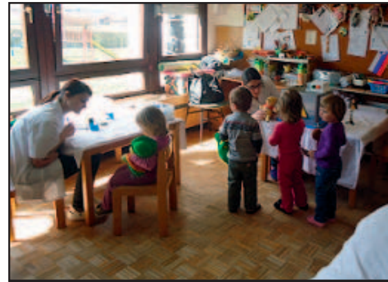
Stran 9: Projekt Medimedo