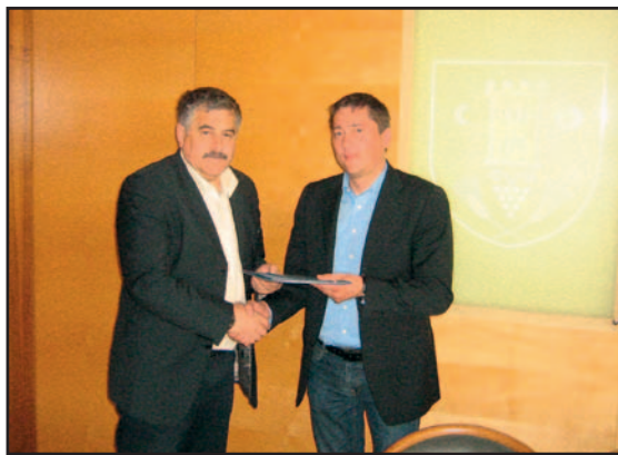
Stran 3: Podpis pogodbe z Asfalti Ptuj