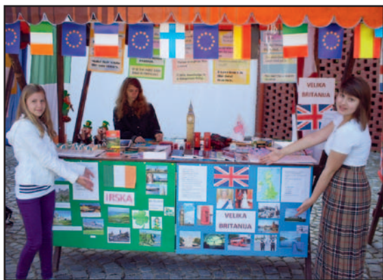
Stran 2: Dan Evrope