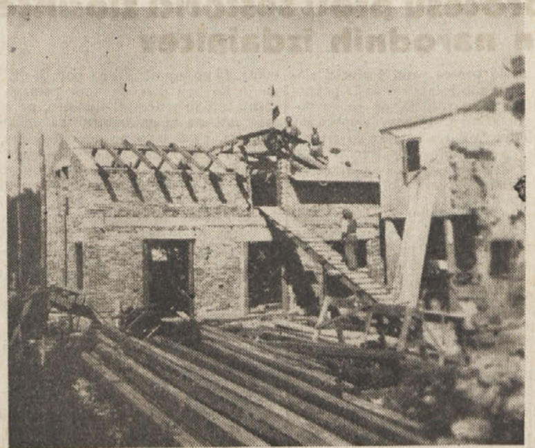
pri tem človečanskem delu nas ne sme nihče ovirati.