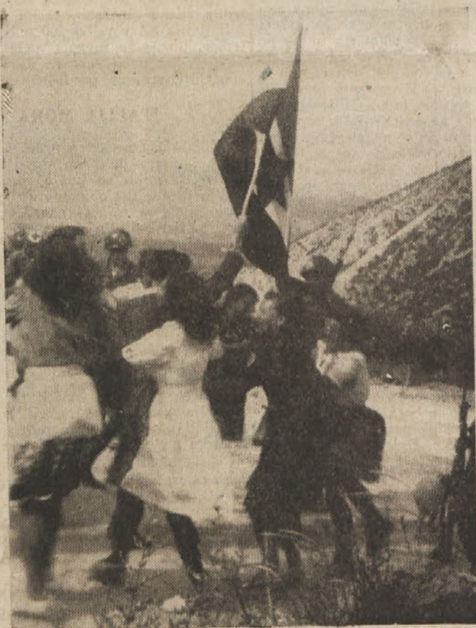
V Gorico, ki smo jo že l. 1945 sami osvobodili, po zmagi nad fašizmom l. 1946 ne smemo z našo zastavo — pot so nam zaprli policijski bajoneti ZVU

žic za borbo, za pravice: postavili so stakovni odbor pred sodišče.