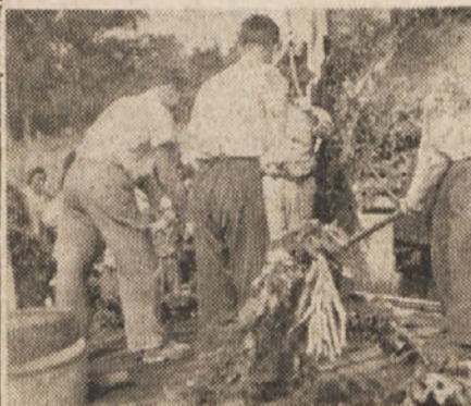
Mlatiči v sprevodu na »Paradi delavci« v Ajdovščini.

Delo se je vršilo v takozvani »Vila Jurca«, katero poslopje je pogorelo zaradi bombardiranja. Takoj ko smo prišli na mesto, so nas tovariši praviloma razvrstili in odkazali vsakemu svoje delo.