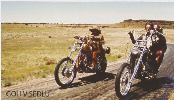
GOLI V SEDLU