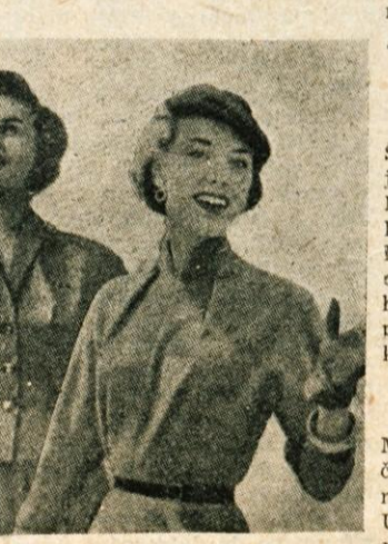
Slika nam prikazuje tri modele za zgodnjo pomlad: preprosto krojeno črtasto obleko za šolo in službo, ljubko dvodelno obleko s plisiranim krilom in elegantno popoldansko obleko iz volnenega blaga

LOČANI! Podružnica našega lista v Skofji Loki v pisarni podjetja »Transturist« uraduje v tokih od 11. do 13. ure in v petkih od 15.30 do 17.30 ure. Tam lahko oddaste male oglase, objave, reklame, čestitke, zahvale, prav tako pa sprejema podružnica tudi nove naročnike!