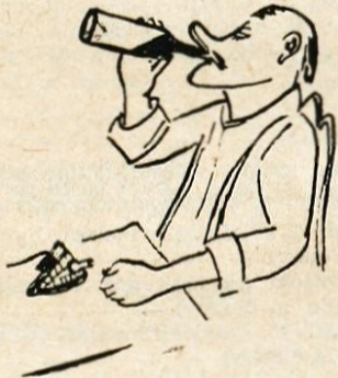
Zadnja zobotehnična novost! Praktična za oba: za zamašek in za pivca.