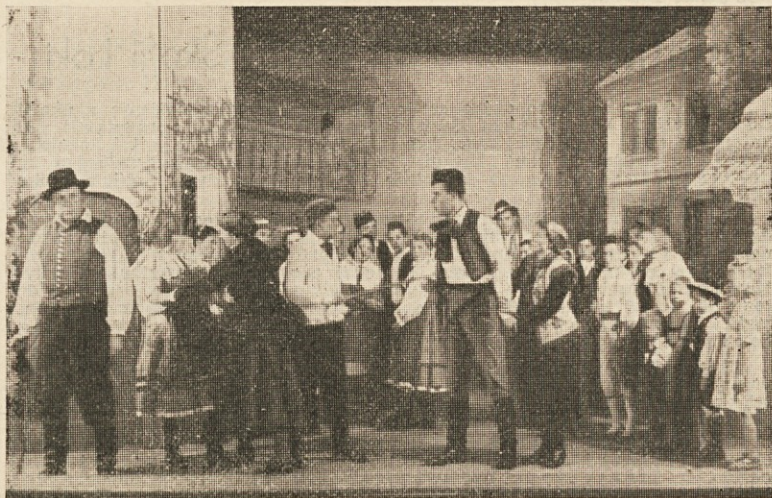
Vaška scena iz prvega dejanja »Mariše«.