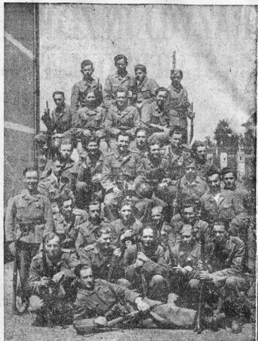
Domobrantska posadka na Dobrovi, naslednica Vaške straže, ustanovljene januarja 1943, ki je 25. jan. praznovala torej dveletnico boja in skrbi za ohranitev dobrovski domačij in miru na Dobrovi in v okolici. Kroniko dela in uspehov te posadke bomo prinesli v prihodnji številki

Posebna vrsta mladinskih knjig so otroške slikanice. Da grado dobro v kup, so nam priča polna izložbena okna knjigar. Včasih so nam bile slikanice mašne bukvice, pratike in zgodbe svetlega pisma, zato smo tudi kot otroci imeli več versko-etične fantazije, kakor pa je imajo otroci sodobnosti, ki so že inficirani z materialističnim duhom! Da so tega žalostnega dejstva krivci tudi nekatere slikanice, bom povedal drugič. Št.