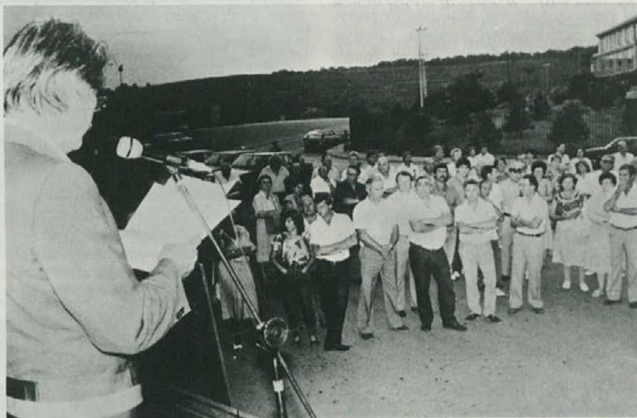
Manifestacija za mir pred GM v torek 1. julija.

Občina Dolina Občina Milje Občina Devin Nabrežina Občina Zgonik Občina Repentabor Sindikat: CGIL - CISL Vsedržavno združenje partizanov Italije - ANPI Združenje katoliških delavcev - ACLI Slovenska kulturno gospodarska zveza Zveza žena Italije Tovarniški svet Grandi Motori Trieste - Trst Tovarniški svet Isotta Fraschini Krajevne sekcije: Komunistične partije Italije - Dolina; Socialistične stranke Italije - Dolina; Krščanske demokracije-Dolina; Kulturna društva: Valentin Vodnik - Dolina; France Prešeren - Boljunec; Slovenec Boršt; Slavec - Ricmanje; Fran Venturini - Domjo; Primorsko - Mačkolje; Rapotec-Prebeneg; Mačkolje - Mačkolje; Krasno Polje - Gročana Godbi BREG, RICMANJE Športni društvi: BREG, DOMIO Društvo prostovoljnih gasilcev BREG Jamarski klub Boljunec Taborniki družine Strmi Breg Scouts Mačkolje Mladinski krožek - Boljunec Mladinski krožek - Dolina Družinska posvetovalnica - Boljunec Zveza žena Italije - Dolina Vsedržavno združenje partizanov Italije - krajevne sekcije: Dolina, Prebeneg, Mačkolje, Boršt, Domjo, Boljunec; Zadruga Dolga Krona