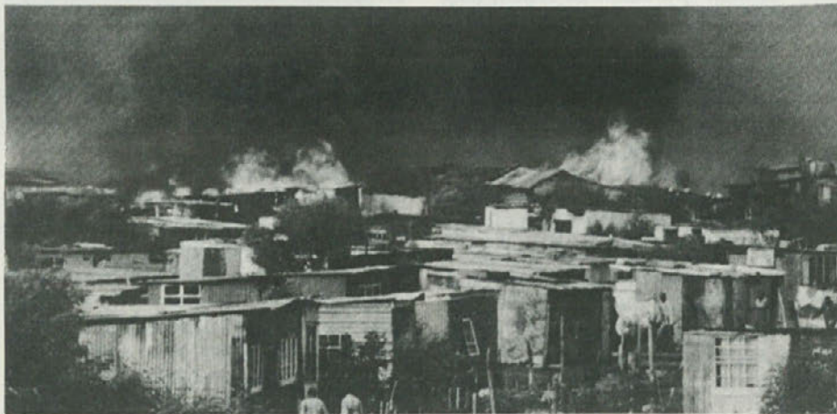
Črnsko «mesto» zelo lahko gori.

Posledice kolonializma so strahotne, na vseh celinah, v Južni Afriki pa postajajo sedaj eksplozivne, saj se lahko (po besedah sicer zmernega škofa Tutuja) spremenijo v največje krvoprelitje po drugi svetovni vojni.