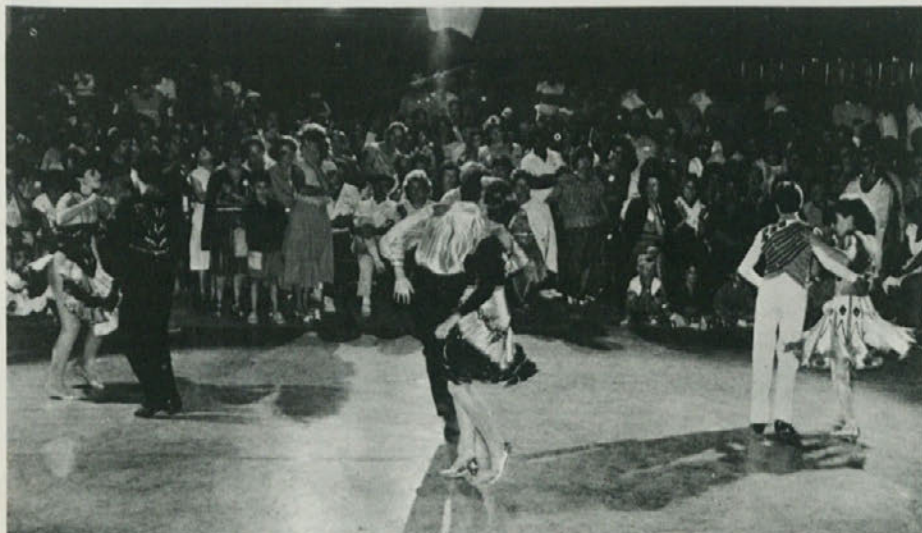
Nastop plesne skupine na festivalu v Boljuncu.

In kaj sedaj? KPI je predsedniku senata Fanfaniju, med njegovim poizvedovanjem, predložila osnutek vladnega programa, ob katerem bi se rada pomerila z drugimi strankami. Nedopustno je namreč, da se okoli vladne krize raz-