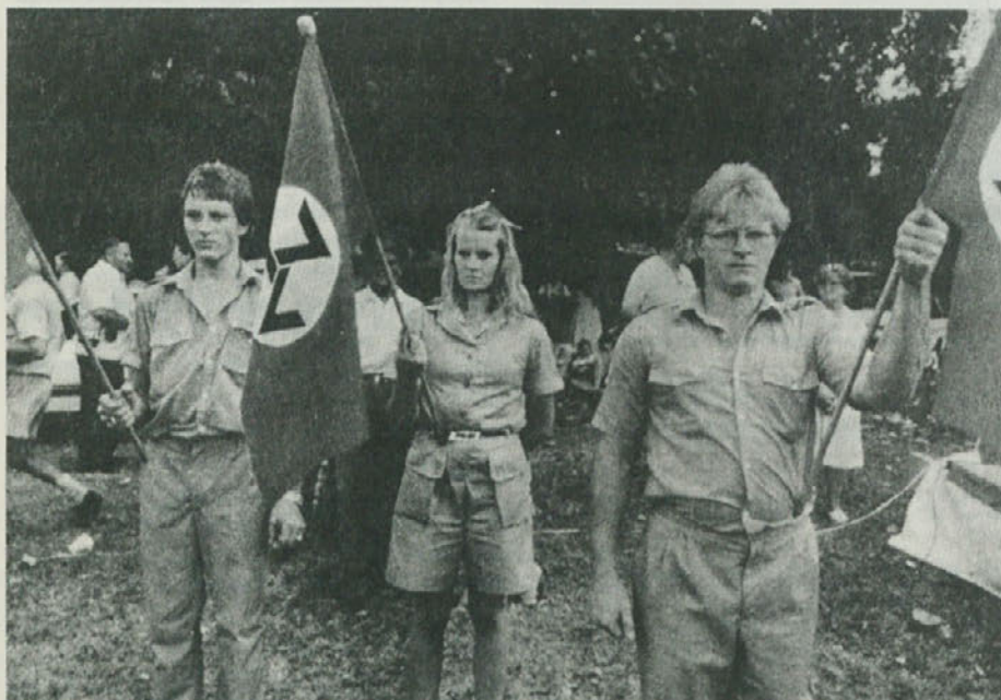
Scena iz Južne Afrike, ki bi se neopazno lahko vključila v prikaz evropske zgodovine izpred 40 let.