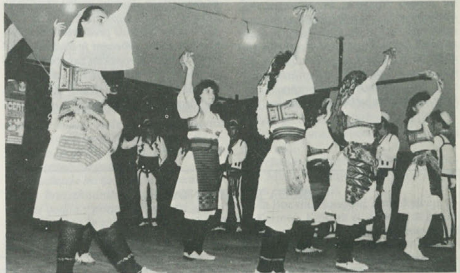
Na festivalu Unità in Dela v Podlonjerju je v soboto 27. junija nastopila folklorna skupina iz Prištine.