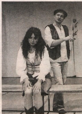
Trenutek človečnosti in prijaznosti v predstavi

vi, o poskusu sožitja, ali pa da bi enostavno prekinil in predčasno zaključil predstavo. Za to je imel več kot dovolj priložnosti.