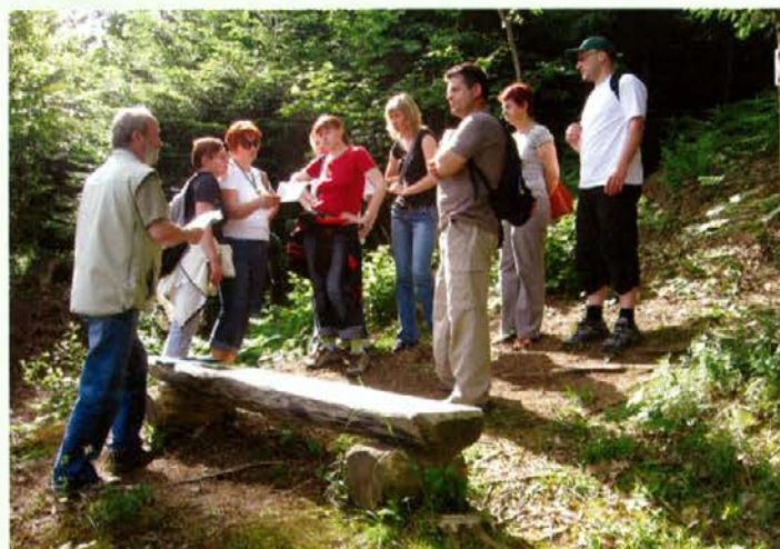
11. ekipa - ekipa učiteljic in učitelja