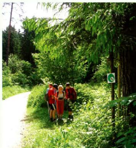
Na točki 6