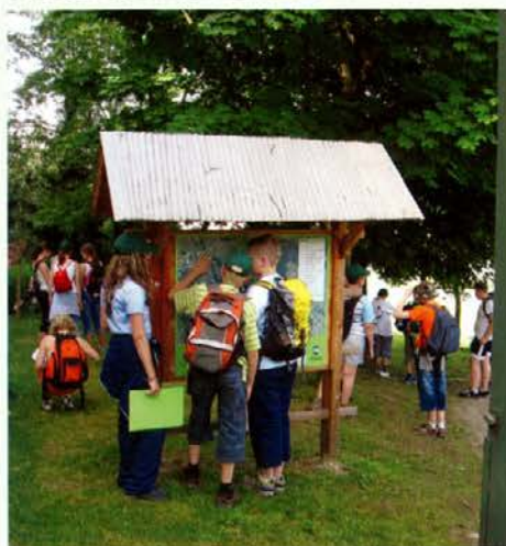
Na začetku GUP Tičnica