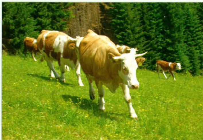
Svoboda na paši