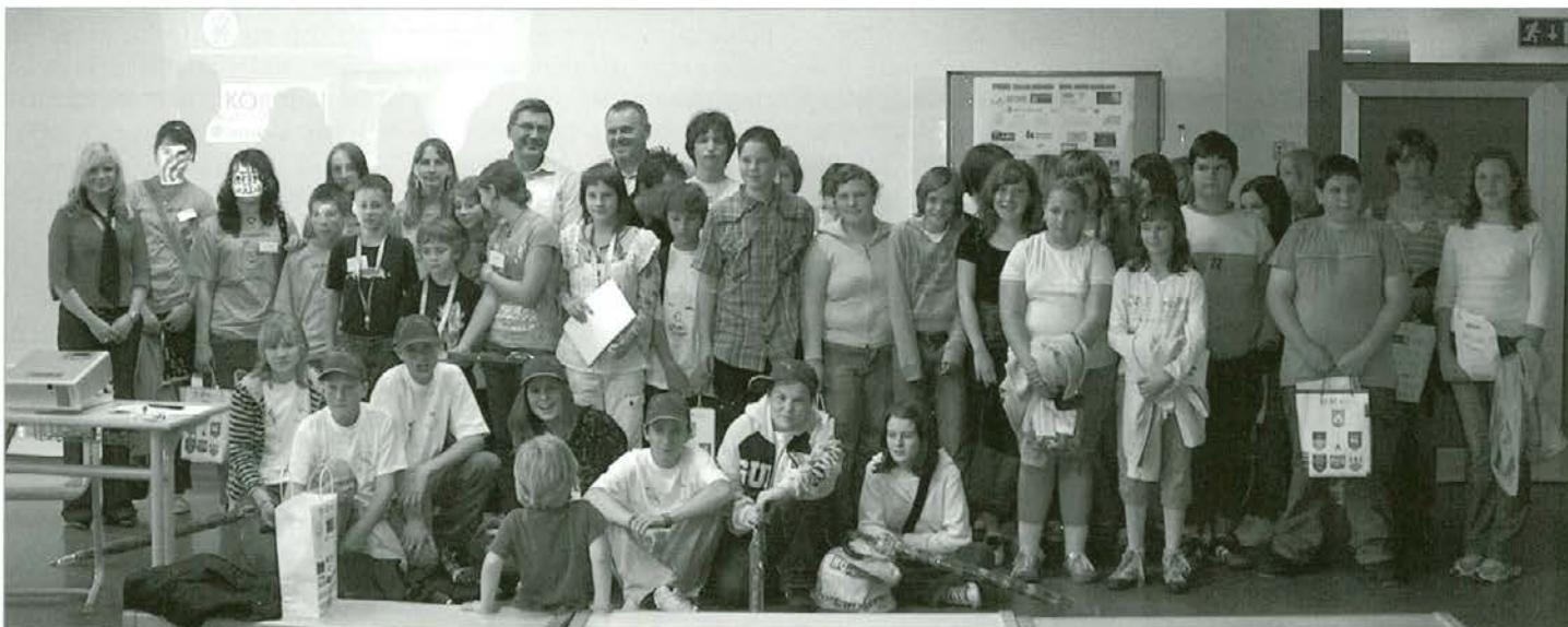
Vsi mladi podjetniki