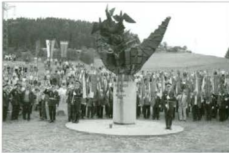
Pred spomenikom na Poljani