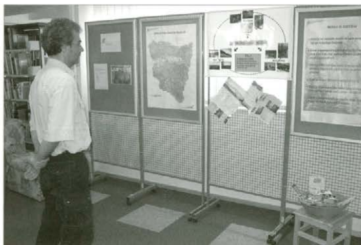
Na razstavi v Radljah ob Dravi

Gradiva so bila predstavljena v knjižnici in so na voljo obiskovalcem, da jih vzamejo.