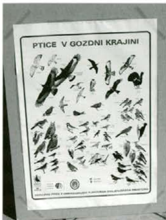
Ptice v gozdni krajini