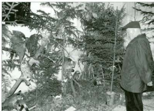
Tudi starejši so si z zanimanjem ogledovali razstavljeni.

živali v naravnem okolju, ki pa je marsikje preobremenjeno z odpadki in nesnago. V drugem delu razstave smo prikazali rast rogovja pri jelu in srnjaku po letih, se pravi od mladiča pa tja do pozne starosti, lovsko opremo, ki so jo lovci uporabljali nekoč in danes, lovsko literaturo, ter zveri v Sloveniji (medveda, risa in volka). Zveri so bile velika paša za oči tako mladih kot starejših obiskovalcev.