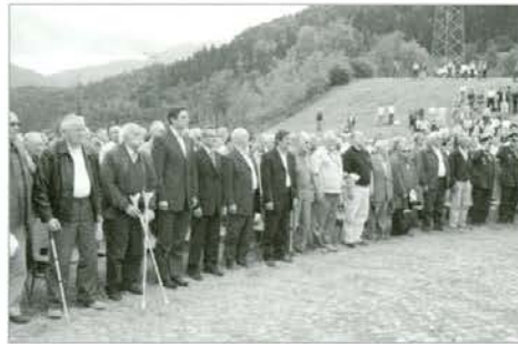
Visoki gostje v prvi vrsti