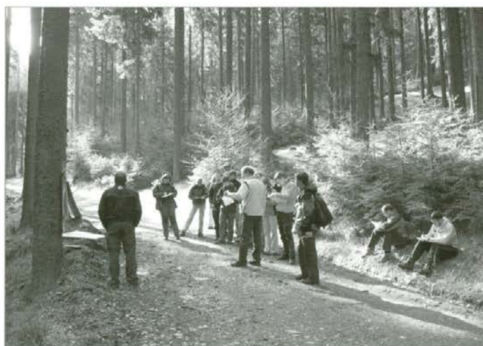
Gozdarski študenti so imeli terenske vaje na Mislinjskem in Radeljskem Pohorju