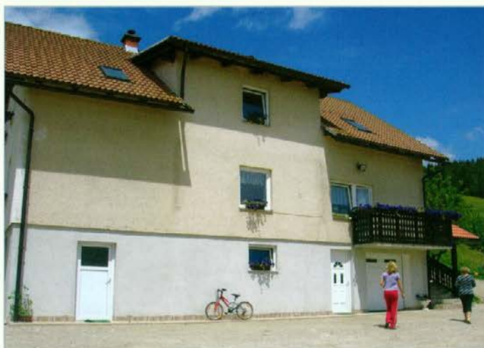
Urejena hiša s prostornim dvoriščem