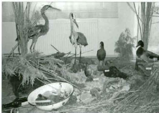
»Naravno okolje« ob vodi