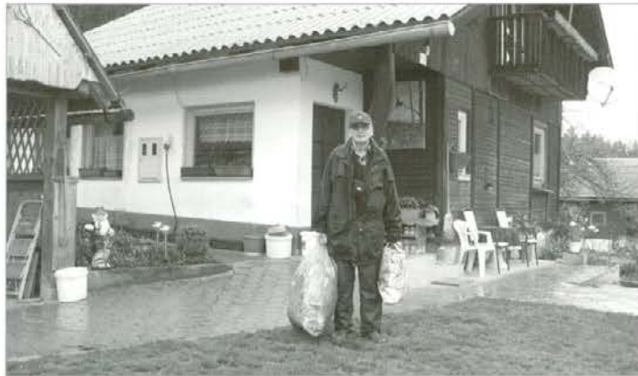
Čistilni sprehod je uspel – rezultat dve vreči smeti

ožiga ( Chalara fraxinea ) tudi drugje na koroškem območju. Na Primorskem in Tolminskem povzročata deformacije plodov, listov in vej kostanjeva šiškariča ( Dryocosmus kuriphilus ). Mala osica je doma na Kitajskem, na Primorsko pa je prišla z uvoženimi kostanjevimi sadikami iz Italije. Prvo žarišče po osi šiškariči poškodovanih kostanjev je bilo najdeno leta 2007. V Prekmurju, pa tudi drugje v Sloveniji, so opazili na deblih in vejah bukev črno izcejanje sokov, ki ga povzročata bolezen fitoftorna sušica vej ( Phytophthora ramorum ). Ta gliva je bolezen okrasnih grmov (rododendroni, brogovita), ki pa napada tudi bukke in prave kostanje. V Slovenijo so to glivo prenesli s sadikami in tehničnim lesom. Pester je seznam bolezni, ki prihajajo k nam ali pa so že v naših gozdovih. To ni črni seznam, kateri bi napovedoval črno prihodnost našim gozdom. S stal-