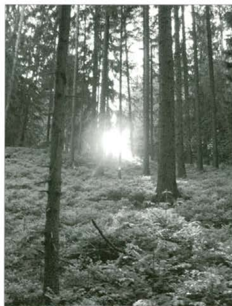
Sonce v gozdu