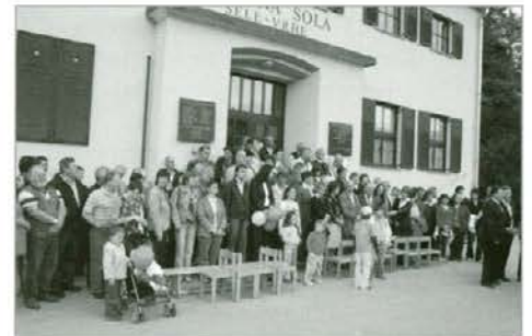
Udeleženci proslave so se slikali pred vhodom v šolo.