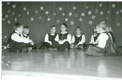
V kulturnem programu so sodelovali tudi najmlajši.