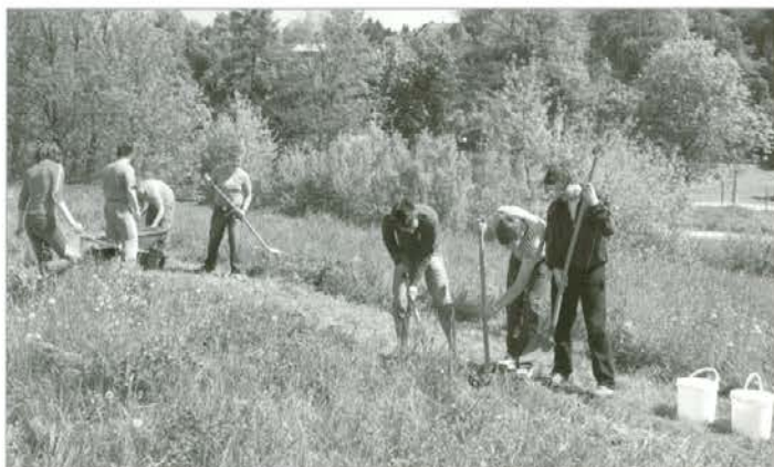
Osnovnošolci Druge osnovne šole Slovenj Gradec pri kopanju jam za sadike