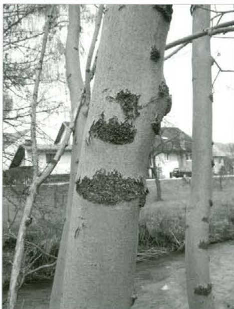
Rakava brada na velikem jesenu