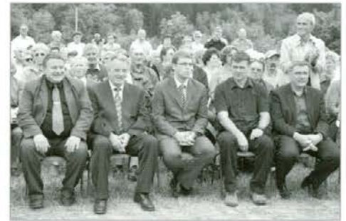
Koroški župani na proslavi