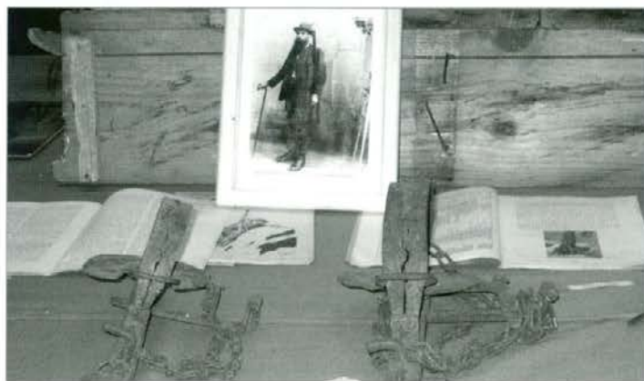
Včasih so lovili s pastmi (stopalkami).