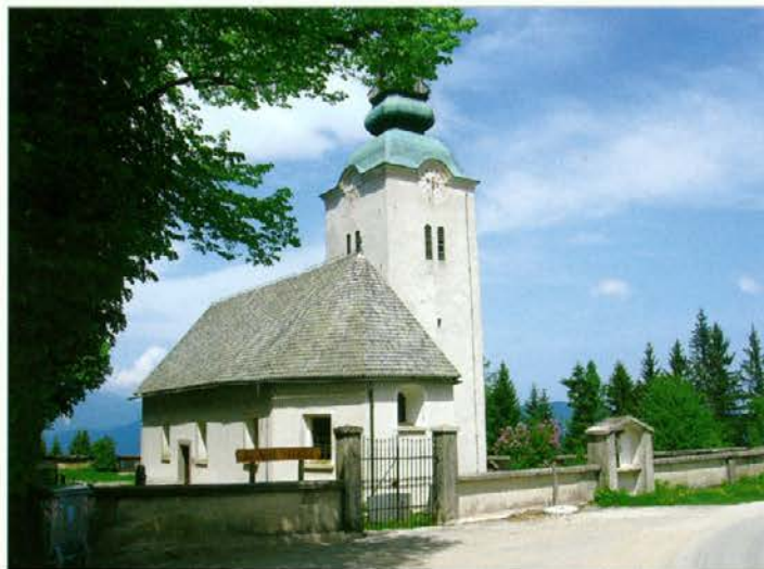
Cerkev sv. Magdalene v Javorju