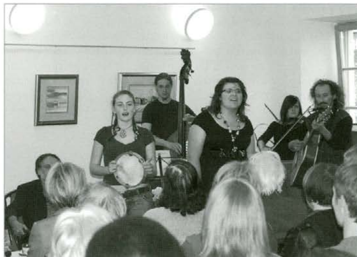
Gimnazijski bend Franc & Roses