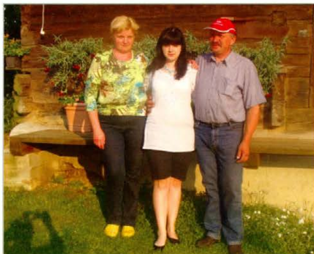
Oče, mama in Stanka pred kaščo na Zaleznikovi domačiji