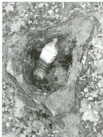
Plastenka v štoru

22. april je dan, ko se doma in po svetu zamislimo, v kakšnem okolju živimo. Z najrazličnejšimi akcijami in ekološko obarvanimi dejanji se poklonimo naši Zemlji. Pobrskamo po kronoloških zapisih o negativnih vplivih na naš »zeleni« planet. Pa je res zelen? Zelena barva pomeni življenje, še posebno če je popestrjena z modro barvo. Zeleni so gozdovi, travniki, modre oz. plave barve naj bi bila morja, jezera, reke, potoki. Zrli naj bi tudi v modro nebo. Kvaliteta življenja je odvisna tudi od čistega zraka. Modrino neba kvarijo razni industrijski plinski vložki in avtomobilski izpušni plini. Na Zemlji izginja zelena barva, mnoge svetovne, za vsako ceno pridobitniško usmerjene firme uničujejo zelene površine tropskih gozdov, onesnažujejo svetovna morja in vplivajo na delež toplogrednih plinov.