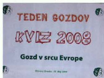
Plakat – Gozd v srcu Evrope

gozd in načrtno sonaravno gospodarjenje tudi evropski javnosti. 29. maja so gozdarji Zavoda za gozdove Slovenije ob pomoči stanovskih kolegov pripravili zanimiv program s predstavitvijo filma, posterja in zloženke o slovenskih gozdovih evropskim poslancem in drugim evropskim politikom. Osrednja centralna prireditev je potekala v prostorih Gozdarskega inštituta v Ljubljani. Slogan letošnjega Tedna goz-