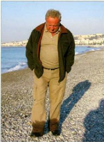
Moker Tone Levč

pred dežjem skozi stekla avtobusa občudovali še naravni in rastlinski rezervat Camarque ob izlivu reke Rhone, flaminje in camarške bike in konje. V vasi St. Maries de la Mer smo v cerkvi videli črno Saro, ki velja za zavetnico ciganov. Ker vas premore dve cerkvi, je nekaj udeležencev ekskurzije našlo pot do avtobusa po ovinkih.