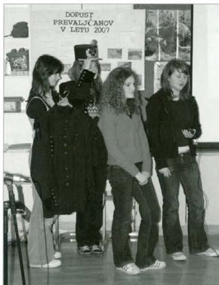
Knapovska oblačila so predstavile učenke OŠ Franja Goloba iz Prevalj