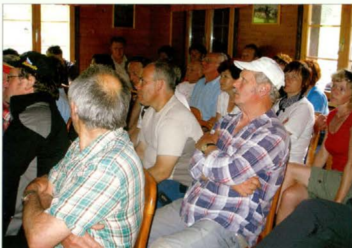
Tečajniki so pozorno prisluhnili predavatelju.