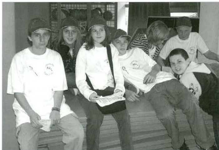
Najpodjetniška skupina Radeljski slavčki

- Šmarške kolednice iz OŠ Šmartno z idejo Koledovanje so prejele glinene obeske in prstane, ki jih podarja Grafično embalažno podjetje Štalekar, d. o. o., Šmartno pri Slovenj Gradcu, krtače za lase, ki jih podarja Frizerstvo Polona iz