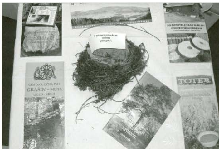
Zloženke in vodniki radeljskih gozdarjev