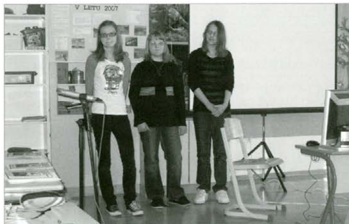
Dravogradske učenke so zanimali bobri ob Dravi

Kar nekaj raziskovalnih nalog je strokovna komisija uvrstila na državno srečanje mladih raziskovalcev, ki je potekalo 30. maja 2008 v Murski Soboti. Koroški javnosti so bile nagrajene raziskovalne naloge predstavljene na podelitvi priznanj mladih raziskovalcev