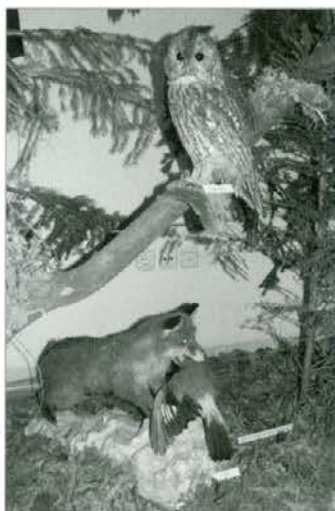
Loviti je naravno.