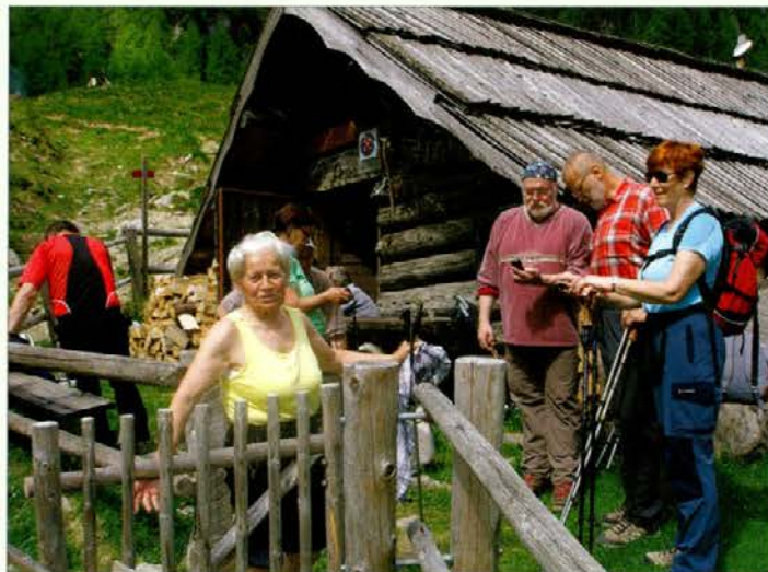
Pred kočo »župana Grohata« je bilo že pred pričetkom tečaja živahno.

končno stopil v veljavo. Tako bo področje urejanja in koriščenja planinskih poti tudi zakonsko urejeno in bo tako pri uporabnikih tega prostora manj nejasnosti.