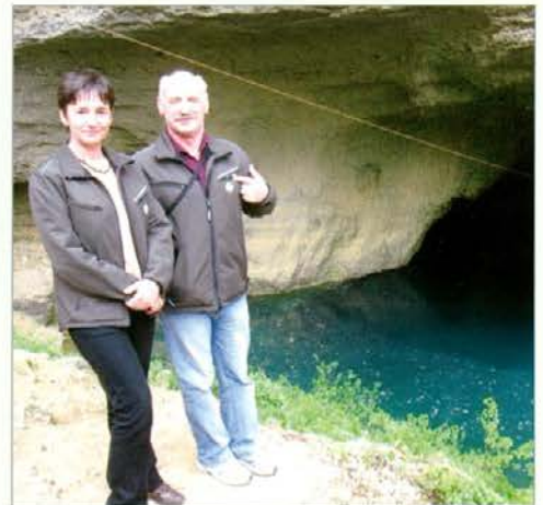
Pripadnika ZGS ponosna na pripadnost in našo novo opremo