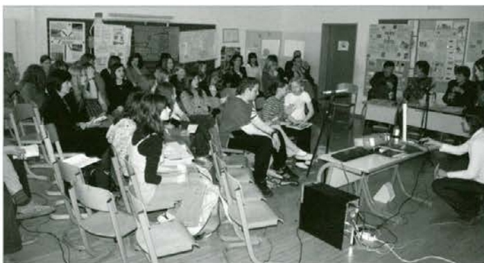
Med srečanjem mladih raziskovalcev Koroške