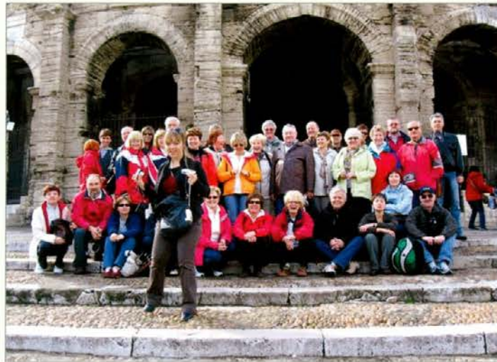
Pred amfiteatrom v Arlesu (čigav vic je tako vžgal?)

pred dežjem skozi stekla avtobusa občudovali še naravni in rastlinski rezervat Camarque ob izlivu reke Rhone, flaminje in camarške bike in konje. V vasi St. Maries de la Mer smo v cerkvi videli črno Saro, ki velja za zavetnico ciganov. Ker vas premore dve cerkvi, je nekaj udeležencev ekskurzije našlo pot do avtobusa po ovinkih.