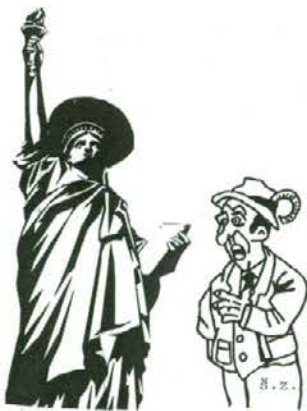
Poglej še malo na nas, uboge Slovenske lovce!

Žena ozmerja moža, ko se zvečer okajen vrne domov: - Kaj misliš, da bom vsak večer čepela doma in čakala, da se vrneš iz gostilne? - Kdo te pa sili, da čepiš? Uleži se na kavč.