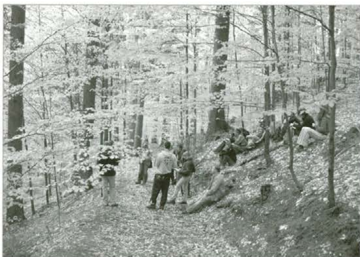
Študenti gozdarstva v Brički (Mislinjsko Pohorje)

Z ostalimi aktivnostmi v času Tedna gozdov se seznanite ob prebiranju prispevkov na naslednjih straneh.