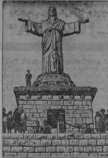
Na svetu največja Kristusova soha je bila odkrita v Milanu kot spomin sprave med papežem in italijansko državo.