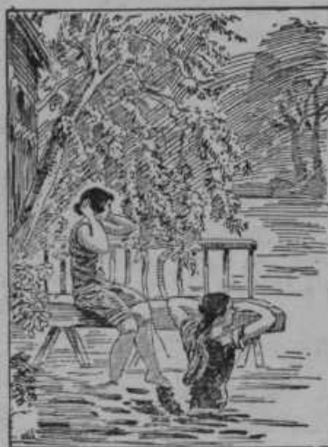
Skrivalnica: Kje je tretja kopalka? Rešitev med inserati v Slovenskem Gospodarju.

Žetev po americkem načinu. Na mestnem vzornem posestvu blizu Berlina so z letošnjim letom upeljali najnovejše poljedelske stroje, ki so bili deloma čisto na novo izumljeni in sestavljeni. Slika gori nam kaže stroj, ki žanje in mlati obenem, dolnja slika nam pa kaže stiskalnico za slamo. Gornji stroj pušča slamo za seboj na tleh, dolnji jo pobira in takoj stisne in zveže.