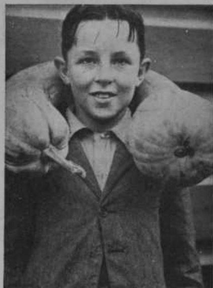
Deček z veliko kumaro okoli vratu.

Žetev po americkem načinu. Na mestnem vzornem posestvu blizu Berlina so z letošnjim letom upeljali najnovejše poljedelske stroje, ki so bili deloma čisto na novo izumljeni in sestavljeni. Slika gori nam kaže stroj, ki žanje in mlati obenem, dolnja slika nam pa kaže stiskalnico za slamo. Gornji stroj pušča slamo za seboj na tleh, dolnji jo pobira in takoj stisne in zveže.