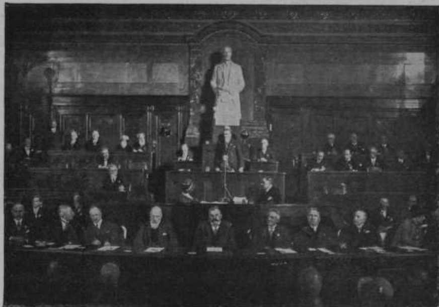
Predsedstvo agrarnega kongresa v Pragi, ki se je vršil od 5. do 8. junija t.l. in ki se ga je med 1000 udeleženci iz 31 držav udeležilo iz Jugoslavije 37 zastopnikov.