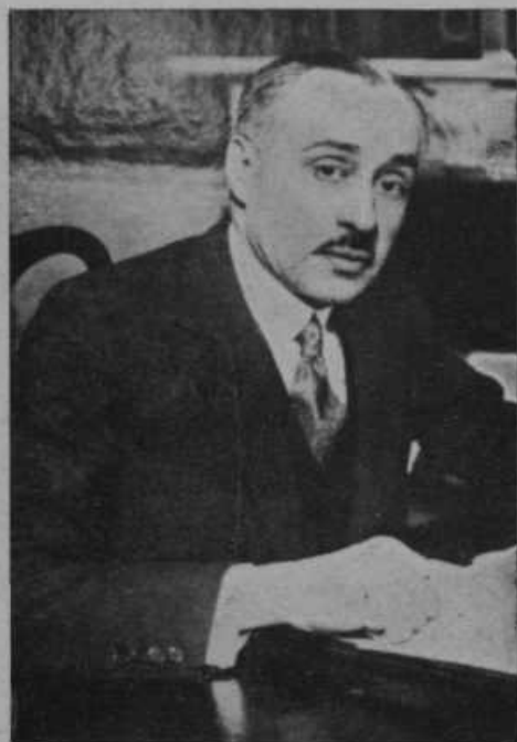
Novi jugosl. finančni minister dr. Džorže Džurič, dosedanji naš poslanik v Londonu.