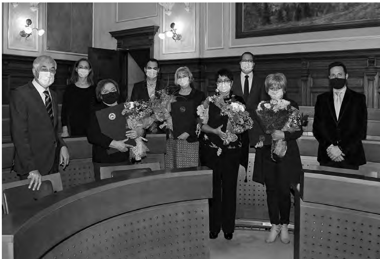
Skupna fotografija vseh udeležencev podelitve