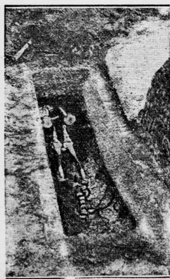
V predmestju Metzja so odkopali človeško okostje in dragoceno posodje iz tretjega stoletja