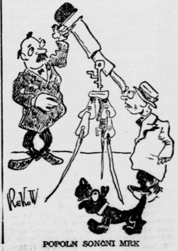
POPOLN SONČNI MRK