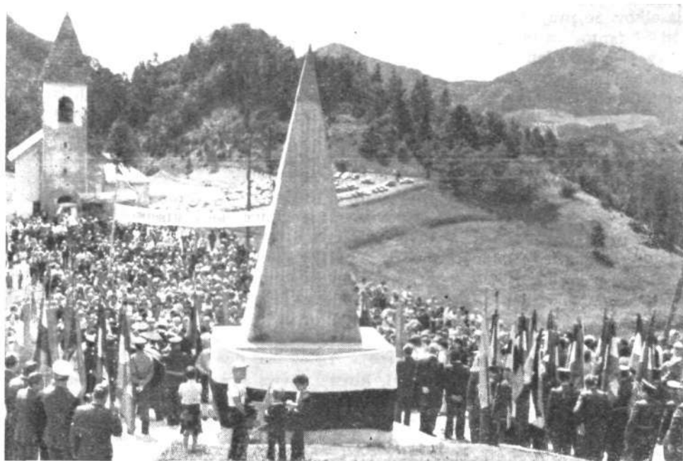
Pred odkritjem spomenika na Prtovcu 4. julija 1980