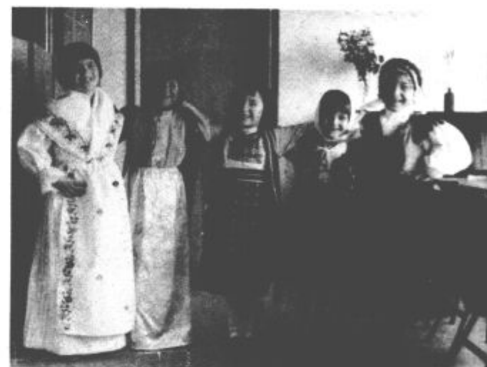
Narodne noše, ki jih je Vzgojnovarstveni zavod Velenje dobil v Cetinju