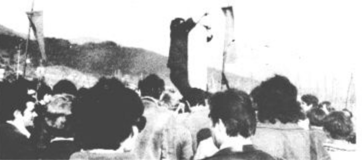
Plezanje na mlaj zahteva dokajšnjo spretnost, zato tudi gledalcev ni manjkalo.