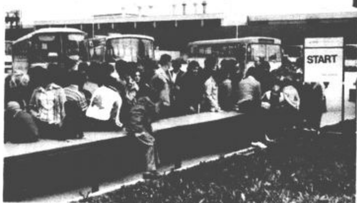
Na startu trim pohoda je bila kar precejšnja gneča.

Preteklo soboto so delavci Gorenja pripravili slavnostni shod v rojstnem kraju Tovarne gospodinske opreme. Zanimiva športno rekreacijska in zabavna prireditve