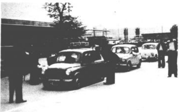
Udeleženci avto rallija so morali opraviti tudi tehnični pregled.