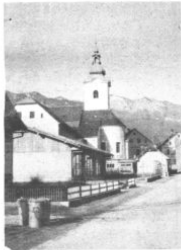
Značilna podoba kraja pod mozirskimi planinami

„Pravilno zastavljena pot napredka se v naši krajevni skupnosti kaže v tvornem delu družbenopolitičnih organizacij in društev ter v njihovi tesni povezavi s krajinami. Njihovo delo se prepleta in vseh družbenih ravneh, zato tudi uspeh ne more izostati. Poleg ustaljenih oblik smo se nosilci dela v krajevni skupnosti odločili za takšno obliko dejavnosti, ki je v največji možni meri zagotovila navezavo tesnih, pristnih in