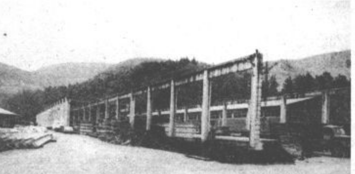
Proizvodni prostori TOZD Vemont

Da pa bi se stanje na tem področju izboljšalo, je samoupravna interesna skupnost na čelo DO Toplovod Velenje uvrstila investicijski program za leto 1979 tudi razširitev centralne energetske postaje za 42 Gcal, kar bi