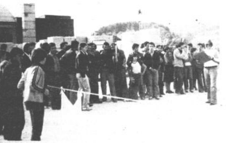
Streljanje z lokom je hitro našlo dosti privržencev.