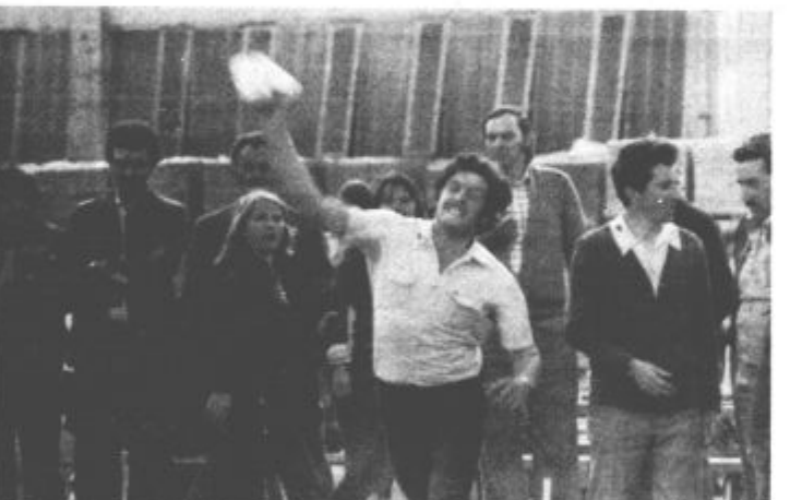
Posnetek zgovorno priča o tem, kakšni napori so potrebni, da težak kamen vržeš čimdlje.