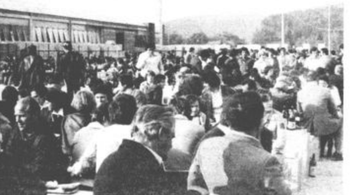
Po naporni hoji ali voznji se je bilo treba tudi primerno okrepčati.

V vasi Gorenje, ki kaže svojo slikovito podobo ob sečišču poti iz Šmartnega ob Paki in Mozirja proti Šoštanju, je bilo preteklo soboto živahno in svečano, kot že dolgo ne. Za prazničen videz je poskrbela večtisočglava množica delavcev Tovarne gospodinske opreme Gorenje iz Velenja, ki so tu pripravili prvo iz široke palete prireditev, s katerimi bodo počastili letošnji srebrni jubilej Gorenja. Primernejšega in bolj simboličnega kraja od vasi Gorenje si gotovo niso mogli izbrati. Slavnostni shod so pripravili namreč prav na mestu, kjer je pred polnimi petindvajsetimi leti enajst delavcev majhnega kovinskega podjetja začelo polagati temelje današnjemu Gorenju in kjer danes stojijo proizvodni prostori temeljne organizacije Keramika. K dobremu razpoloženju je pripomoglo tudi lepo vreme, ki je kljub slabim obetom na dan prireditve vendarle obljubilo zvestobo Gorenju.