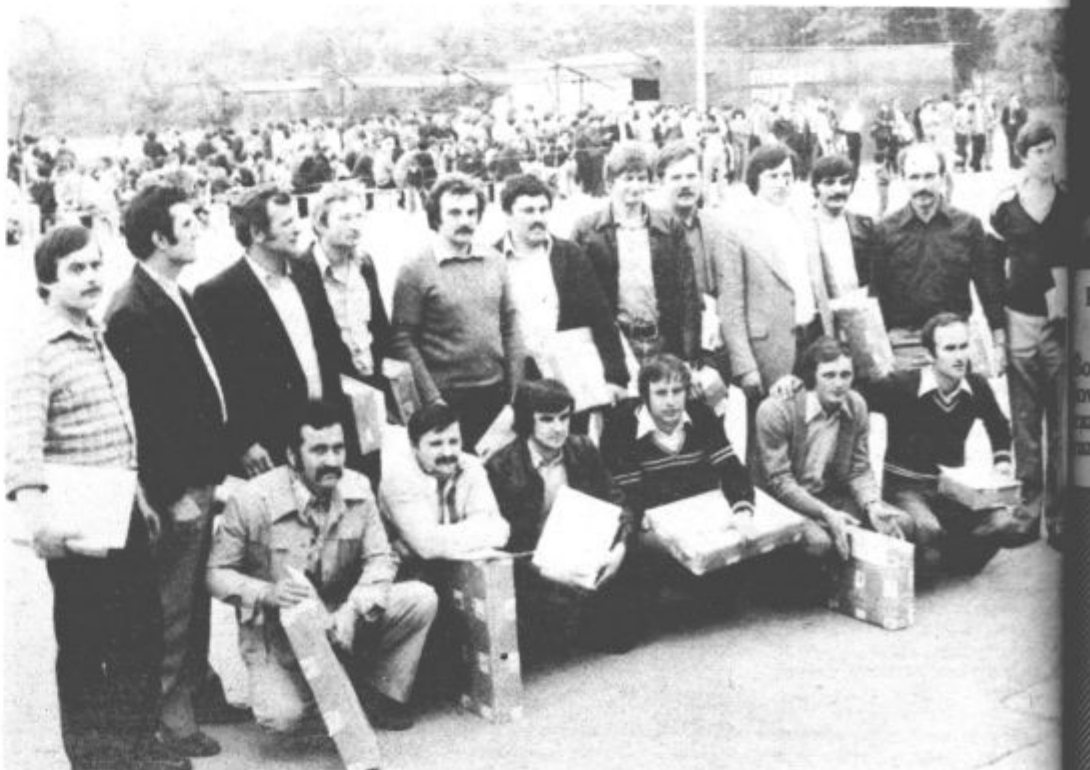
Najboljši trije v posamezni disciplini bodo odšli na republiško tekmovanje.

Tekmovalci, ki so dosegli prva tri mesta na občinskem tekmovanju, se bodo tako kvalificirali na republiško prvenstvo. Upamo, da bodo tudi tam dokazali svoje delovne kvalitete in uspešno zastopali našo občino. B. KRAJČIČ