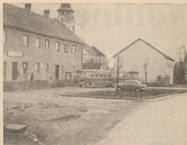
Te dni v Vodicah

Nič še ni zamujenega. Saj je priprava statutih delovnih organizacij daljnosežna naloga in vsaka naglica morebiti bolj škoduje, kot koristi. Da pa se je treba nalogo temeljito in vsestransko ter intenzivno lotiti, pa tudi ni nobenega dvoma.