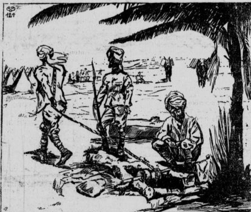
Turško taborišče v Mezopotamiji.