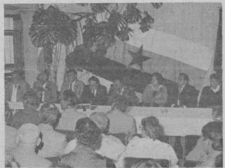
S slavnostne seje KS Ponikve in Videm-Dobrepolje.