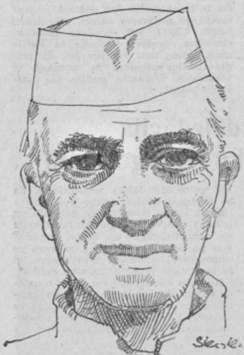
Indijski premier Nehru

Najvidnejši velmož Daljnega vzhoda Cu En Laj je na potovanju. Iz Kambođe je odšel v New Delhi, od tu gre v Karači in Kabul. Pogovori se sučejo o kolonializmu, o Suez, o Srednjem Vzhodu. Cu En Laj je obljubil, da bo Pakistanu boje razložil zavezo s Kašmirjem — nove kašmirske ustave Pakistan noče priznati — kakor pa je to dostajalo storiti Indija, Afganistan pa bo skušal pomiriti s Pakistanom. Tam mirovna misija je spričel dopodkov okoli Suez tako bolj značilna, ker je Cu En Laj ponovno ponudil roko ZDA.