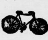
Dvokolno motorji svetilnik