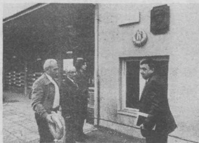
V okviru praznovanja smo počastili spomin na nosilca imena naše KS, posebna delegacija pa je odnesla venec k obeležju Jožeta Moškriča na pročelju osnovne šole, ki tudi nosi ime po njem