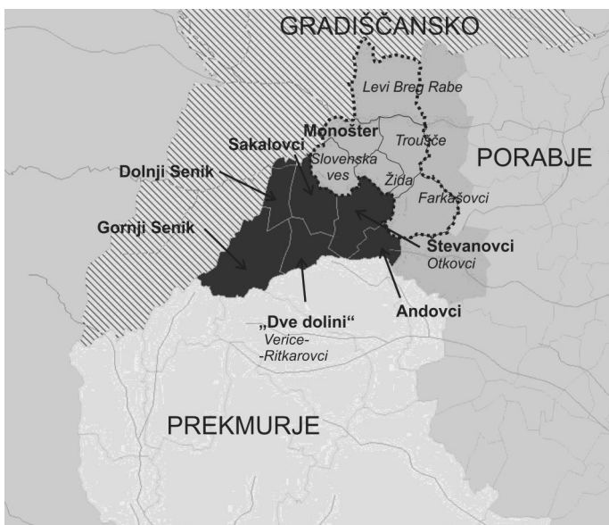
Slika 1. Naselja Porabskih Prekmurcev in administrativni »gerrymandering«.

Seveda ne moremo reči, da je Madžarska statistično združevanje naselij storila z enoznačnim namenom reducirati prostor manjšine, vendar so se v perspektivi taki ukrepi pokazali kot dodaten pritisk na lokalno prebivalstvo, ki s tem izgublja motivacijo za odprto izražanje in enoznačno etnično opredeljevanje.