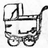
Otroški vozički najnovejših modelov

KLIŠEJE VSEH VRST IZDELUJE KLIŠARNA LJUBLJANA, DALMATINOVA 13 ST. IDEU