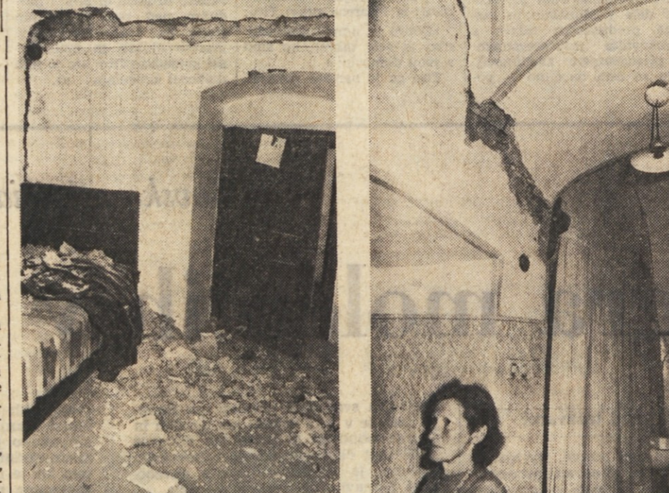
ZEVAJOČE STENE — Najhujša podoba po potresnih sunkih se je nudila očem v notranjih hišnih prostorih. Za mnoge stene ni rešitve.