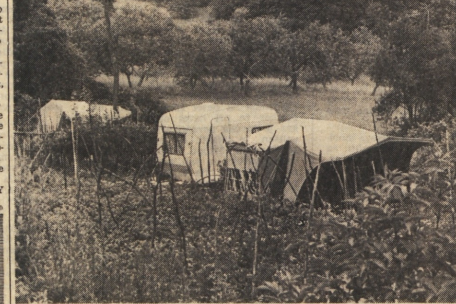
POMOČ PRIHAJA — Takoj po potresu je za nesrečne Kozjance stekla solidarnostna akcija. Med prvimi so se je udeležili delovni ljudje iz Induplati Jarše in IMV Novo mesto, ki so za najpotrebnejše poslali šotore in avtomobilske prikolice.