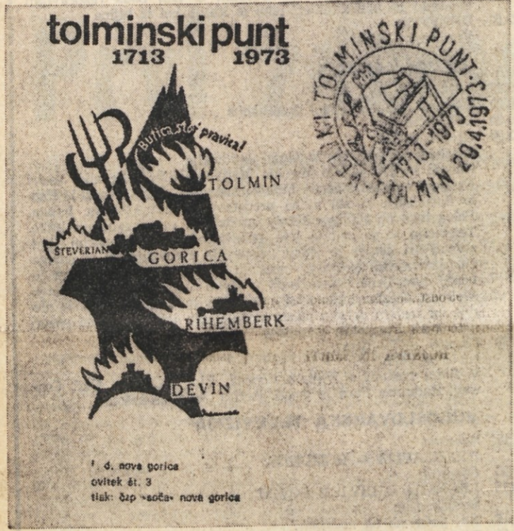
Del pisemskega ovitka s posebnim žigom