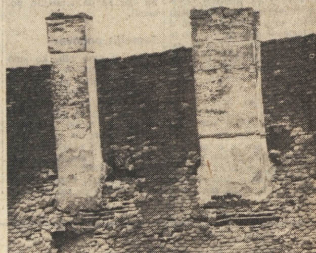
SLOVO OD GRADU — Olimpijski grad, kasnejši samostan, je dvajset let gostil zadnje stanovalce. Zaradi popolnega uničenja gornjih prostorov, so tudi ti morali zapustiti nevarno stavbo, ki bo verjetno propadla.

Nedavni četrtkov potres je v nekaterih predelih občin Smarje pri Jelšah in Senthurju pri Celju pustil za sabo težke sledove. Čeprav na zunaj ni videti toliko škode na hišah in gospodarskih poslopijih, pa je mnogo hujska tista, ki jo vidimo, ko vstopimo skozi vrata prenekaterih hiš. Seveda je potres prizadel predvsem stare in manj čvrsto grajene stavbe, čeprav ponekod (tako v Olimju) ni prizanesel tudi debelim grajskim zidovom. Na prizadetem območju nenehno dežurajo štabi za odpravo posledic potresa, še vedno prihajajo podatki in ocene o škodi. Tudi slovenska javnost se že solidarno odziva in načrtuje, kako bo pomagala brezdomcem. Vsaj do kasne jeseni bo namreč treba poskrbeti za mnoge, ki sedaj bivajo pod šotori in v stanovanjskih prikolicah ali celo pod kozolci. Kozjansko si samo ne more pomagati, je pa doslej tudi sodelovalo v podobnih solidarnostnih akcijah.