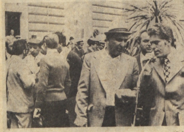
SREČANJE NA REKI — Prvi razgovori so se pričeli že na Trgu reške resolucije.