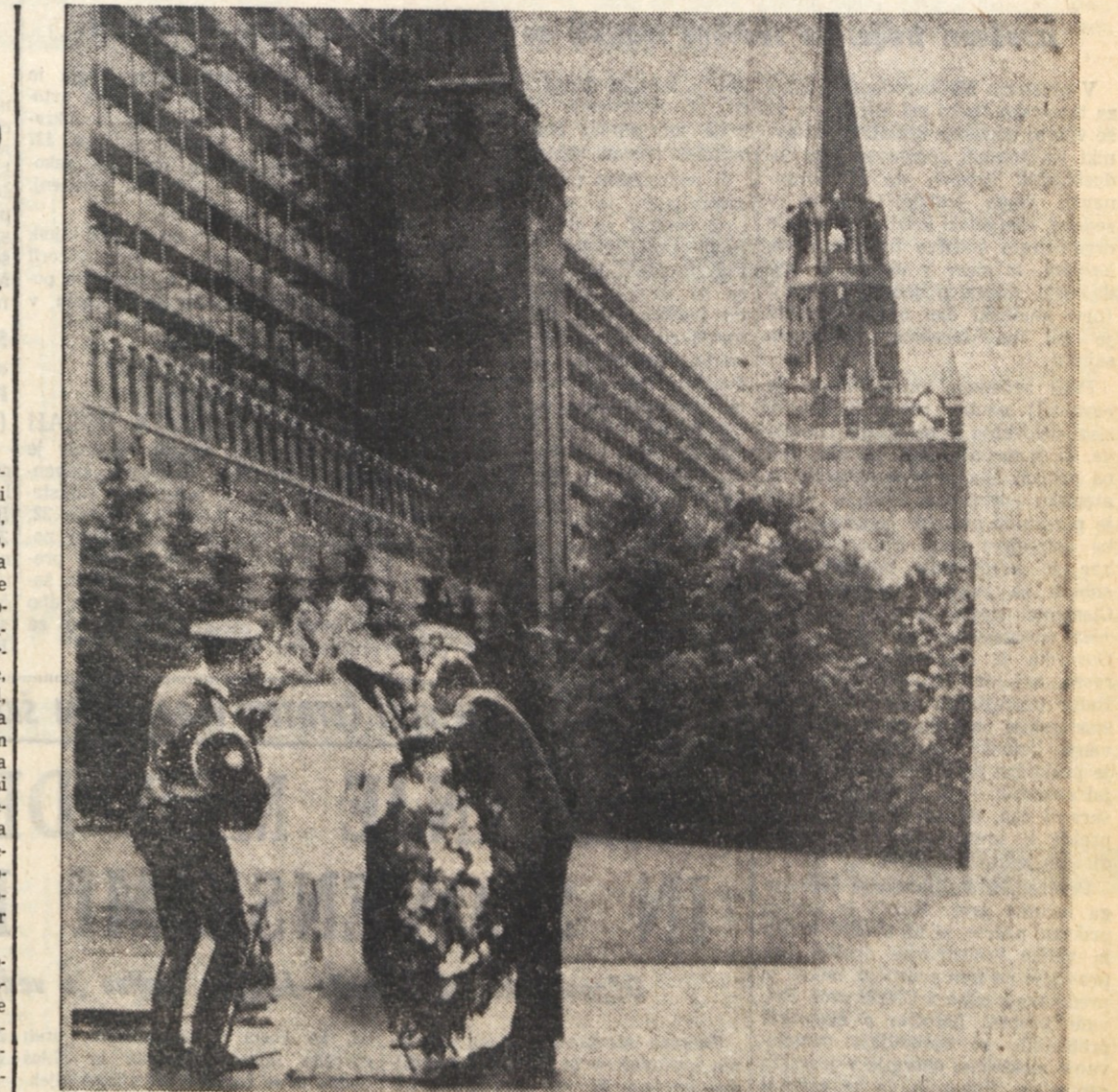
Nixon polaga venec pred grob neznanemu junaču v Aleksandrovske vrtu za kremeljskimi stenami. (Poročilo o Nixonovem obisku v SZ objavljamo na 8. strani)

V imenu komunistične skupine je govoril poslanec Galluzzi. Izjavil je, da so bile Rumorjeve izjave v bistvu površne, saj so sile mimo vseh osnovnih vzrokov politične krize, ki pretresajo državo. Galluzzi je poudaril, da se gospodarska vprašanja lahko začne obravnavati in reševati pod pogojem, da se odpravi politični spor med vladnimi strankami.