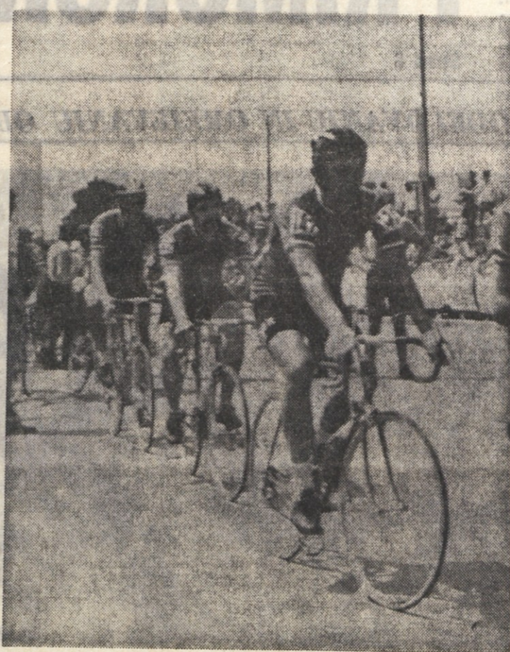
Del jugoslovanskih dirkačev na 30. mednarodni amaterski kolesarski dirki «Po Jugoslaviji»