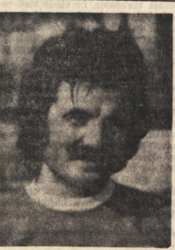
Štoka je v preteklem prvenstvu branil barve Olimpije iz Gabrova