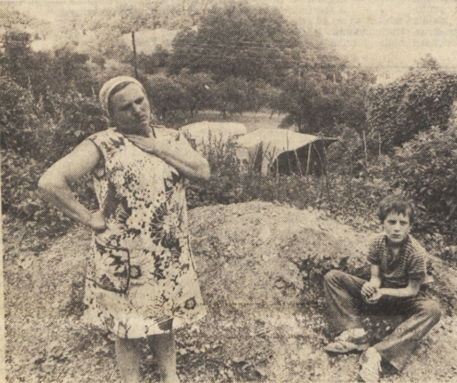
HITRA POMOČ — Debelakovim iz Podčetrka so hitro priskočili na pomoč, tako da se je 16 ljudi lahko zateklo v dva šotora in prikolico.

Zelim naglasiti, da je novinar novega kova hkrati politik, kakor je politik hkrati novinar. Postati morate politiki, da boste v celoti razumeli linijo Osvobodilne fronte. Politično delo med vami samimi mora doseči svoj višek. Če ne boste razumeli svojega dela, naš tisk ne bo izpolnil dane naloge. Mi z vsemi graditelji naše narodne oblasti stremimo za tem, da vključimo najširše množice. Aktivizacija najširših narodnih množic je naša osnovna naloga in obremen jamstvo, da bomo dosegli končno zmago. V tem je ključ za doseg narodovih uspehov ali z drugim besedami, to se pravi vključiti narodne množice tudi v naš tisk — razviti dopisništvo.