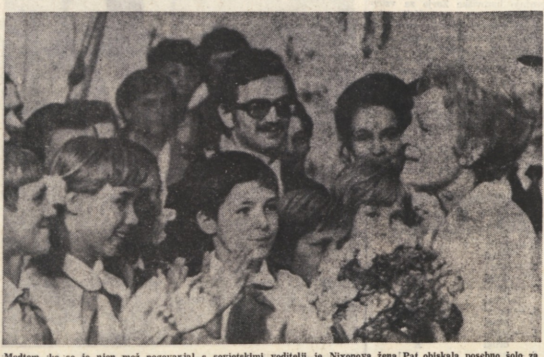
Medtem, ko se je njen mož pogovarjal s sovjetskimi voditelji je Nixonova žena Pat obiskala posebno šolo za cirkuške igrance, ki deluje v Moskvi. Pred posebno predstavo so jo slušatelji šole pozdravili v svoji sredi