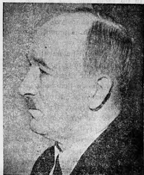
Dr. Edvard Beneš

Drugi nasledek, ki bi jo imel ta usodni dogodek, bi bilo pa popolno uničenje evropskega političnega ravnotežja in degradiranje Francije s stopnje velesile na stopnjo navadne evropske države z nekoliko številnejšim prebivalstvom (prim. Poljsko). Zato je danes popolnoma upravičena trditev, da je Češko-