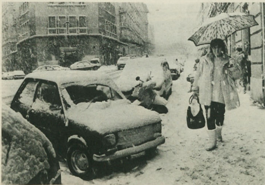
Gospo ministrici Falcuccijski ni uspelo prepovedati otrokom belega tedna. Če oni niso mogli na sneg, je ta poskrbel za dodatne počitnice.