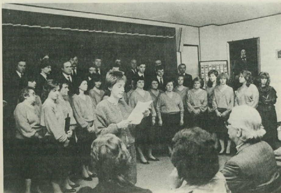
Sekcija VZPI-ANPI iz Boršta-Zabrežca je prejšnjo soboto priredila uspelo manifestacijo ob 42-letnici fašističnega napada na vas.