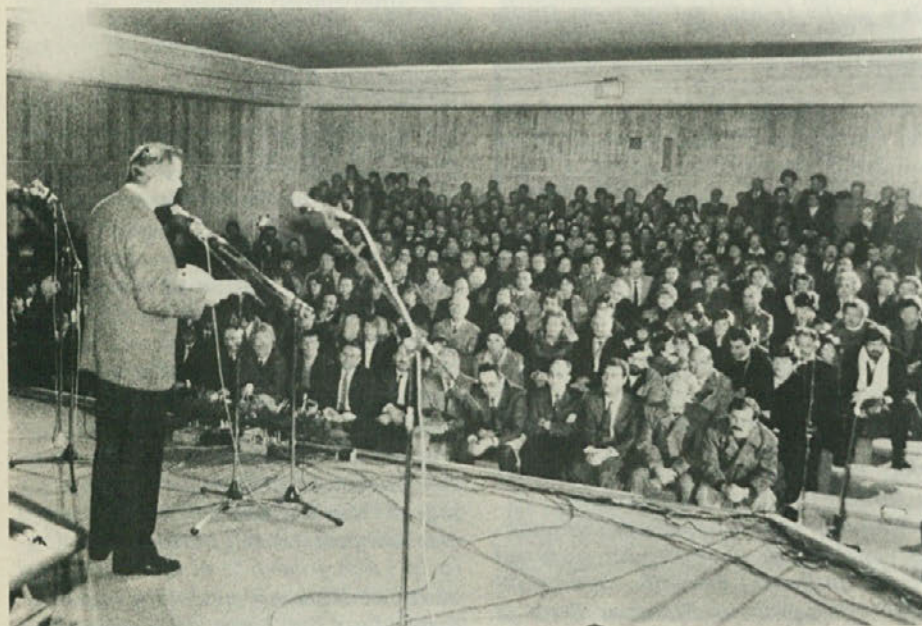
Ob novoletnih praznikih, ko se izseljenci vračajo na obisk domov, prireja Zveza beneških izseljencev že tradicionalni dan emigranta. Letošnji je prav lepo uspel, sej je bogatemu programu sledilo zelo številno občinstvo.