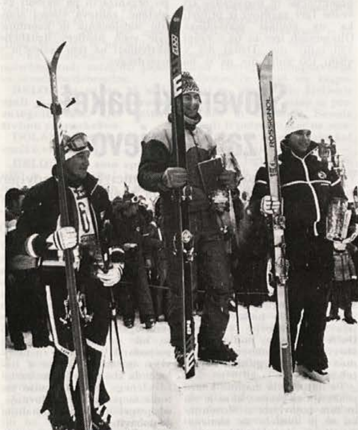
Dvoje elanove smučmi na zmagovalnem odru