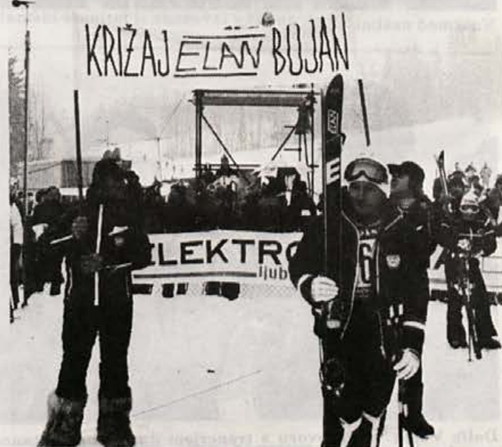
Bojan med svojimi navijači iz Trziča v Kranjski gori

SPORTSKE NOVOSTI 26. XII. 1978 VILKO LUNCER