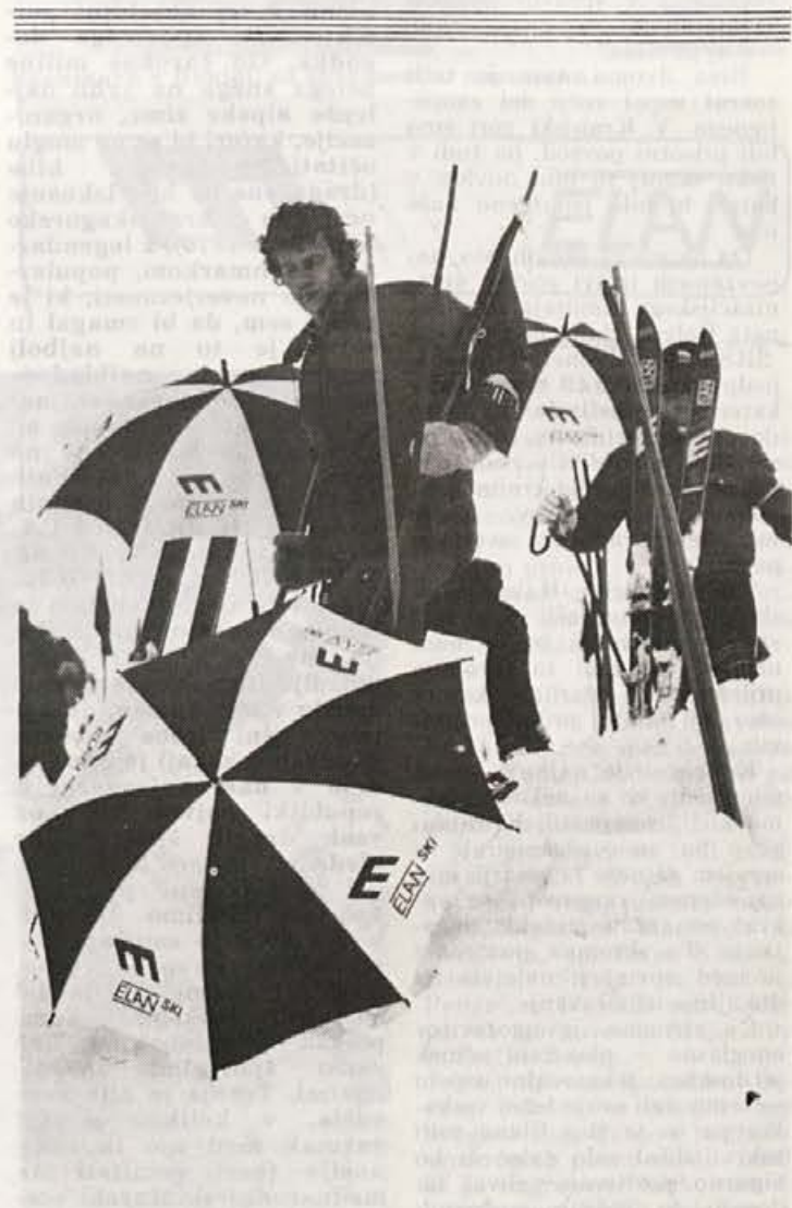
Elan je bil v Kranjski gori povsod prisoten

– naše papirne zastavice vzdolž proge so še vedno spominki, po katerem so po