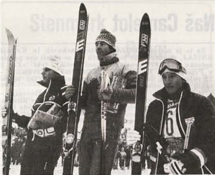
XVIII. Pokal Vitranc je za nami