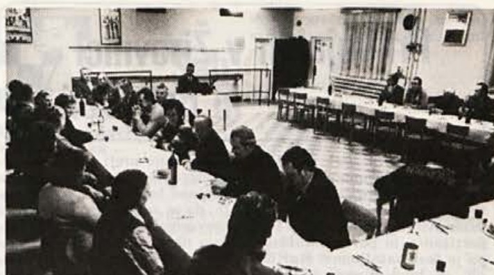
Srečanje Elanovih borcev NOV — ob novem letu