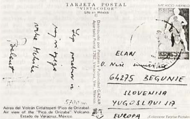
Aerea del Volcán Citlaltépetl (Pico de Orizaba). Air view of the "Pico de Orizaba" Volcano. Estado de Veracruz, México.

Skupina štirinajstih planincev in alpinistov iz Radovljice in okolice, je v novembru lanskega leta krenila na pot preko Atlantika – v Mehiko. Namen teh vrlih gornikov je bil, da zavzamejo dva, že mrtva vulkana, to je POPOKATEPETEL, visok 5442 metrov in ORIZABO, visok 5700 m, ki je obenem najvišji