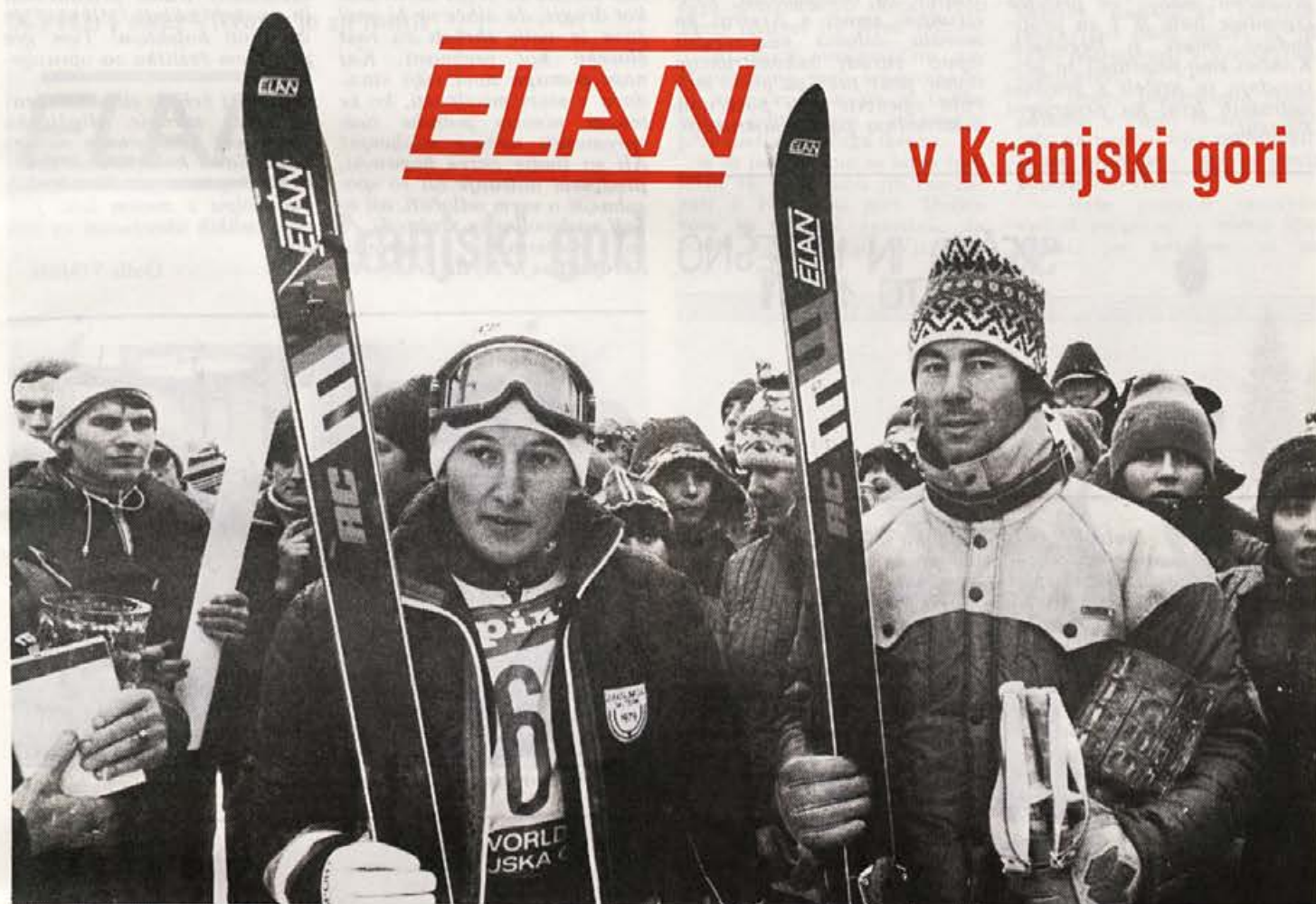
Prvi in tretji v slalomu v Kranjski gori