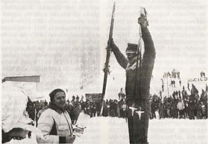
Stenmark je prišel v Kranjsko goro po zmago