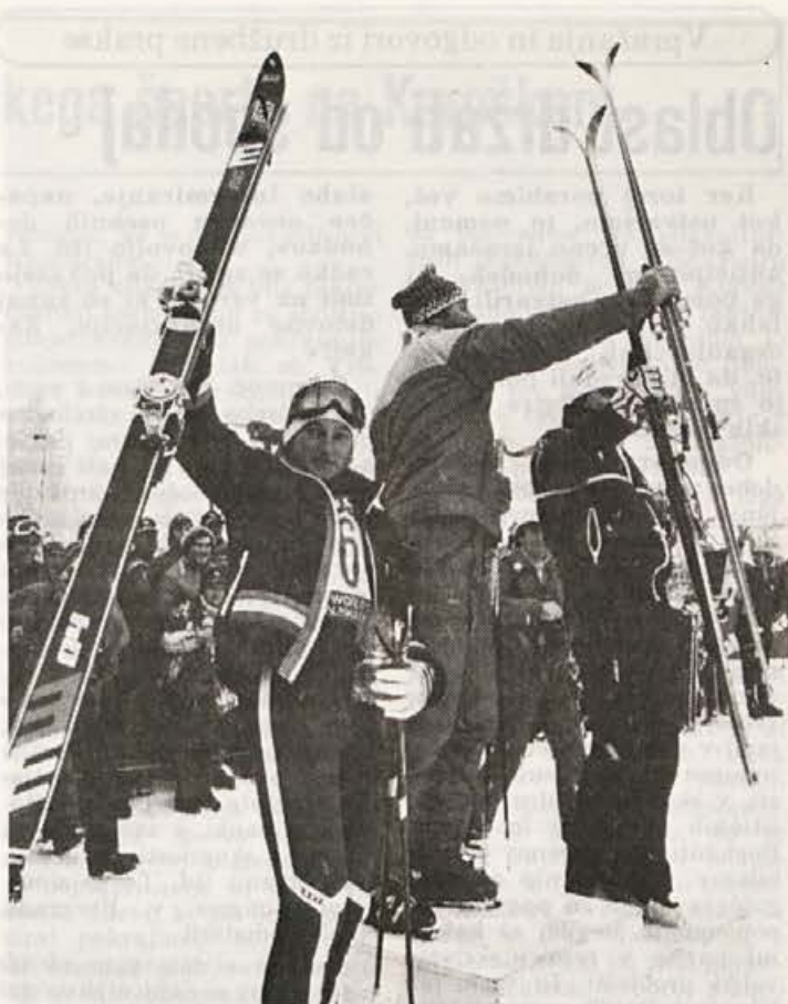
Največji uspeh našega najboljšega smučarja Bojana Križaja v veleslalomu v Kranjski gori