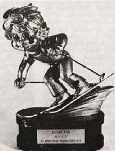
Mednarodno združenje športnih novinarjev v Bernu, je letos že drugič proglasilo za smučarja leta Ingemarja Stenmarka in mu podarilo zlato maketo prireditve svetovnega prvenstva v Garmischu