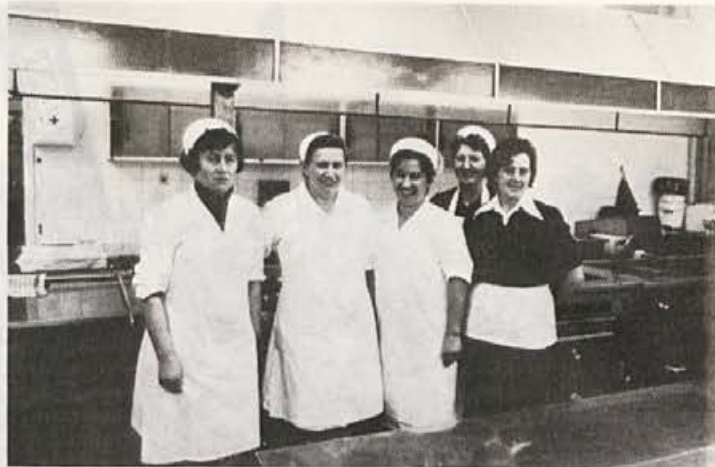
Naše vrle kuharice nam pripravljajo dobro hrano