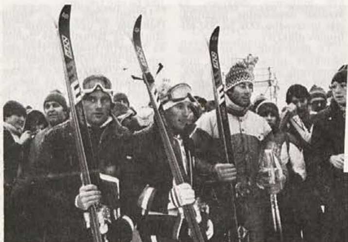
Trije tekmovalci v prvi deseterici za svetovni pokal z Elanovimi smučmi