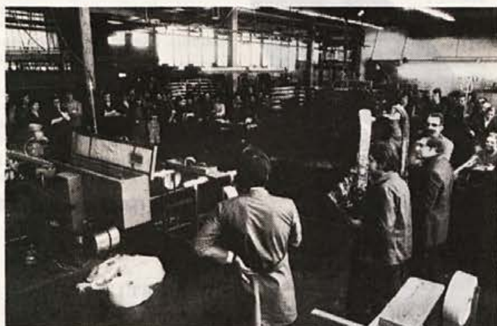
Novoletna slovesnost v obratu smuči — ob izpolnitvi plana

Zadnje dni preteklega leta je bila v obratu smuči — na »končni« kratka slovesnost ob izpolnitvi plana proizvodnje smuči. Delavcem je spregovoril vodja proizvodnje mag.