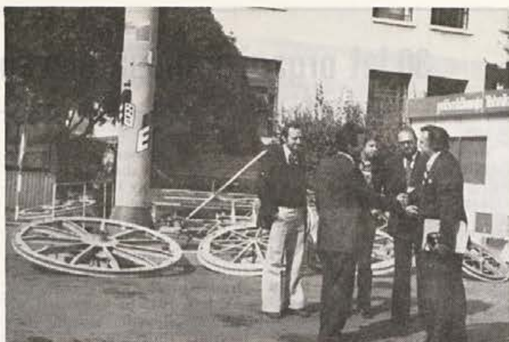
Razstavljena žičnica »POMA« tip 4100