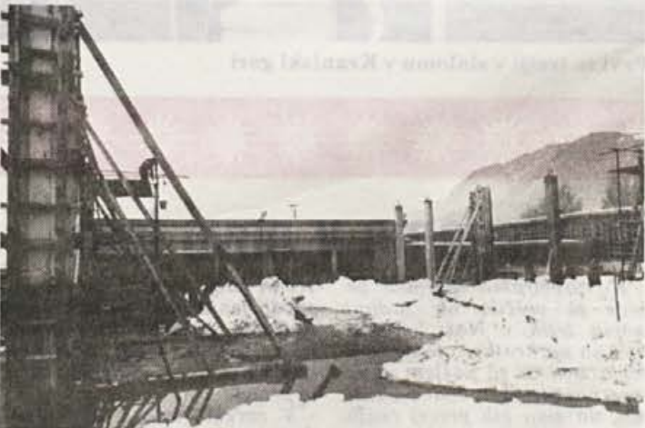
Gradnja hale B 1 tudi pozimi ne počiva