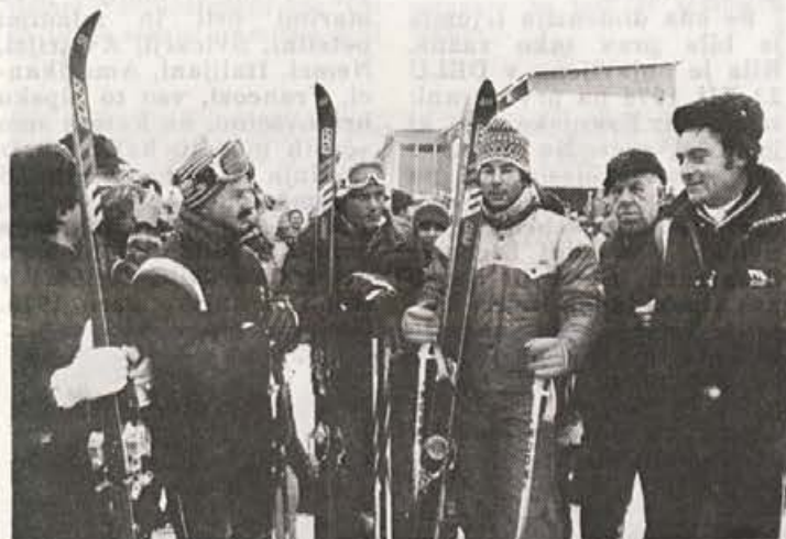
Naši med našimi