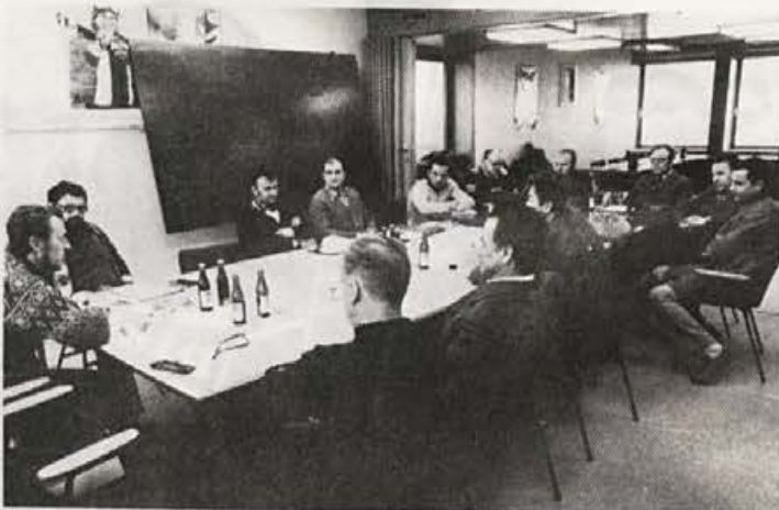
Planiški komitet je zboroval v Elanu

Skoraj neverjetni uspehi pa tudi ogromne naloge, ki jih imamo, nas ne bodo smeli oslepiti, da ne bi videli v res-