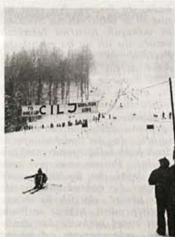
Prizorišče veleslalomu za svetovni pokal v Kr. gori