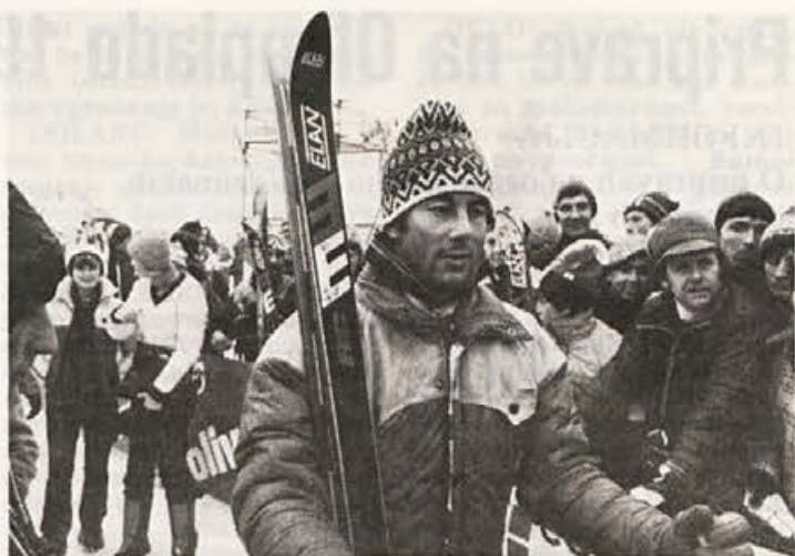
Zmagovalec z našimi smučmi na našem terenu