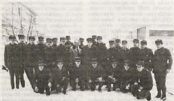
Obisk vojakov za dan JLA v Elanu