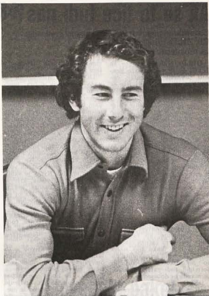
Stenmark v Brnci, za spremembo nasmejan

Obisk tako znamenite osebnosti Elanu, je z njegove strani tudi priznanje, da ceni Elan v celoti, tako kot visoko ceni Elanove smuči, s katerimi zmaguje že leta iz tekme v tekmo.