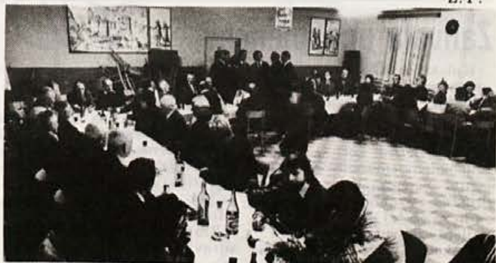
Vsakoletno srečanje z našimi upokojeenci — december 1978