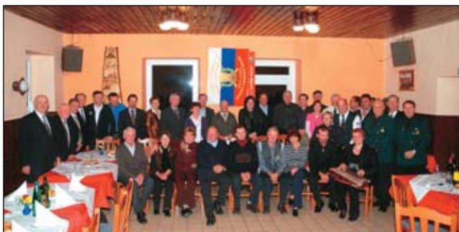
Skupinska slika udeležencev srečanja