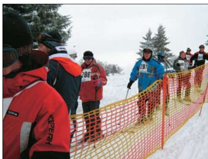
Še nekaj minut, potem pa ... start

V ekipno konkurenco 6. veteranskega prvenstva se je uvrstilo pet ekip, ki so dosegle vsaj po dva regularna rezultata v vseh treh moških kategorijah. Najboljša je bila ekipa območnega združenja Mežiška dolina, ki je za eno leto osvojila tudi prehodni pokal veteranskega prvenstva v veleslalomu. Druga je bila ekipa območnega združenja Ruše, tretja pa ekipa območnega združenja Spodnja Savinjska doli-