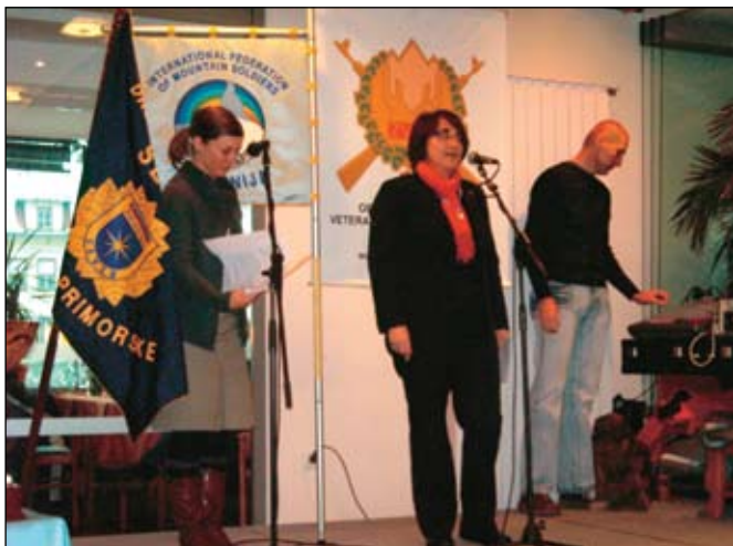
Kot slavnostna govornica je udeležence nagovorila ministrica za obrambo dr. Ljubica Jelušič.