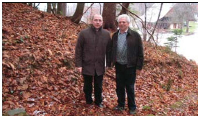
Ali bo Medvedjev obiskal Štore?

Tega bi si seveda vsekakor želel tudi jaz, vendar je nevhvaležno napovedovati obisk tako pomembnega gosta. Predsednik Ruske federacije je pač predsednik največje države na svetu in svetovne vojaške velesile. To je treba upoštevati in spoštovati.