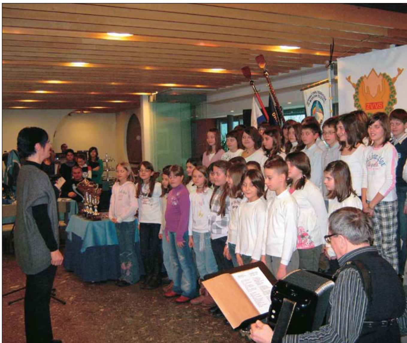
Za kulturni program so poskrbeli pevci in recitatorji OŠ Cerčno.