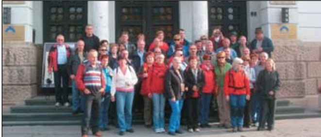
Idrijski veterani in njihovi kolegi iz Logatca in z Vrhnike na obisku v Bosni in Hercegovini

Med rekama Vrbas in Pliva leži slikovito mesto Jajce z veličastnim enaindvajset metrov visokim slapom, ki sodi med dvanajst najlepših na svetu. Spomin na nekdanjo Jugoslavijo nam je obudil danes žal precej izropan muzej drugega zasedanja Avnoja. Ustavili smo se tudi v Travniku, kjer smo si ogledali sedež turškega vezirja in hišo pisatelja, dobitnika Nobelove nagrade Iva Andrića.