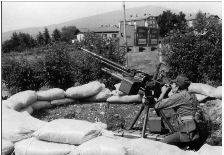
Protiletalski top pri 7. pokrajinskem štabu TO na Pobrežju v Mariboru

o dramatičnih dogodkih, nakar so se Pekrčani in drugi Mariborčani začeli zbirati pred domom, zbrali pa so se tudi pred vojašnicami in preprečevali, da bi se še več vojaških vozil napolnilo v Pekre. Zvečer so se oklepna vozila odmaknila od učnega centra v Pekrah, sprejet pa je bil dogovor o nadaljevanju pogajanj v zgradbi mariborske občinske skupščine.