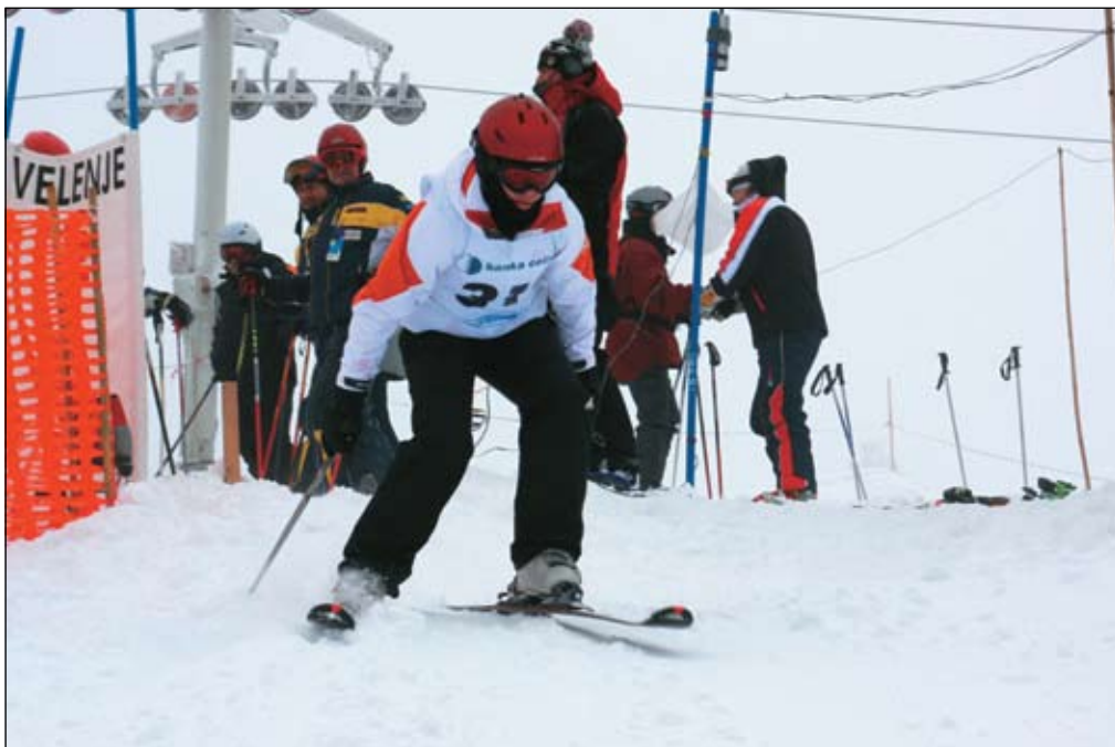
Na 1300 m dolgi progi Beli zajec so se tekmovalci preizkusili v smuku.