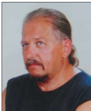
Piše: Franc Pulko