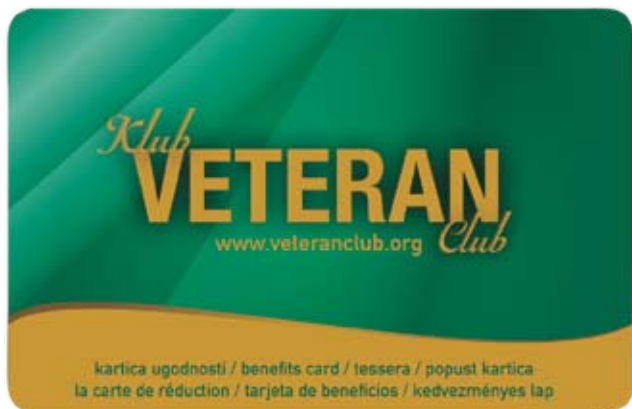
Kartica ugodnosti - 1. stran