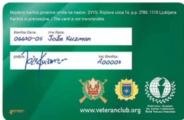
Kartica ugodnosti - 2. stran