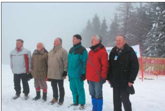
Otvoritveno slovesnost so s svojo udeležbo počastili tudi številni visoki gostje.

Veseli me, da se prav po vaši zaslugi vse od leta 1975 v partizanskem Cerknem nadaljuje tradicija Partizanskih smučin. Želim si, da bi se na njej še dolgo srečevali še živeči udeleženci prvih partizanskih tekem, borci in borke, veterani vojne za Slovenijo pa tudi pripadniki in pripadnice Slovenske vojske, ki na Partizanskih smučinah tekmuje za kolajne na prvenstvu Slovenske vojske v veleslalomu. Čestitam vam za pogum in vztrajnost ter vam želim, da bi v športnem duhu s ponosom ohranjali dragoceno izročilo partizanstva in domoljubja. Verjamem, da bodo Partizanske smučine – Cerčno '45 živele še naprej in predstavljale trdno vez med sedanjimi in prihodnjimi generacijami!«