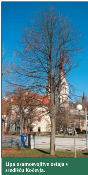
Lipa osamosvojitve ostaja v središču Kočevja.

Tako bo, primerno prezentirana, bodočim rodovom še naprej pričala o upih in željah pa tudi o pogumu in požrtvovalnosti osamosvojitvene generacije, ki je zmogla poseči po zvezdah, ko se ji je za to ponudila morda neponovljiva zgodovinska priložnost.