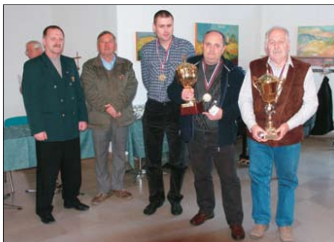
OZVVS Idrija-Cerkno je osvojilo prvo mesto in prehodni pokal.