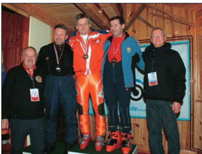
Zmagovalna ekipa Mežiške doline

vojne za Slovenijo, Zveze slovenskih častnikov in pripadniki Policijskega veteranskega združenja Sever, so imele tudi letos mednarodni značaj. Na njih so sodelovali tudi pripadniki IFMS - svetovne federacije vojakov gornikov iz ZDA, Italije in Slovenije.