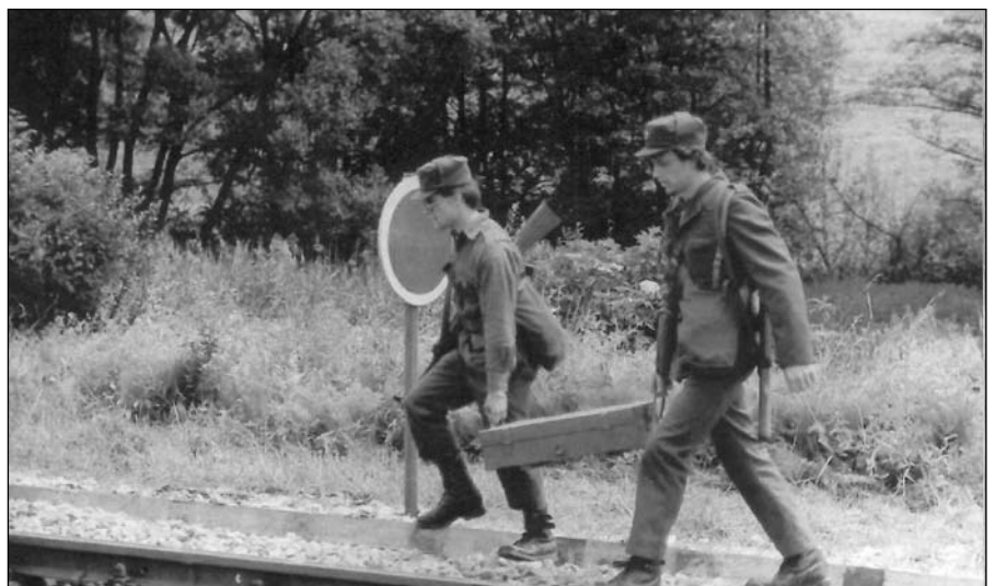
Pripadnika Teritorialne obrambe na železniški progi Maribor-Šentilj-Pesnica

Žal se premalo poudarja dejstvo, da smo imeli v vseh pomembnejših podjetjih, ustanovah, zavodih (republiškega, pokrajinskega in občinskega pomena) in v vseh krajevnih skupnostih ustanovljeno in organizirano Narodno zaščito (NZ). Narodna zaščita ni bila formacijsko postavljena (saj smo govorili, da je množično gibanje usposobljenih ljudi za izvajanje varnostno-zaščitnih nalog), imeli pa smo sezname usposobljenih ljudi, ki so v primeru aktiviranja imeli na levem rokavu znak NZ. Del udeležencev NZ je bil tudi usposobljen za ravnanje s strelnim orožjem, zato so izvajalci obrambnih in varnostnih načrtov tudi kupovali strelno orožje in strelivo - praviloma