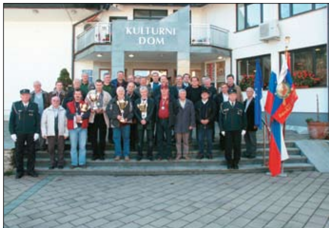
Udeleženci 2. šahovskega turnirja ZVVS za prehodni pokal v Šmarju pri Jelšah