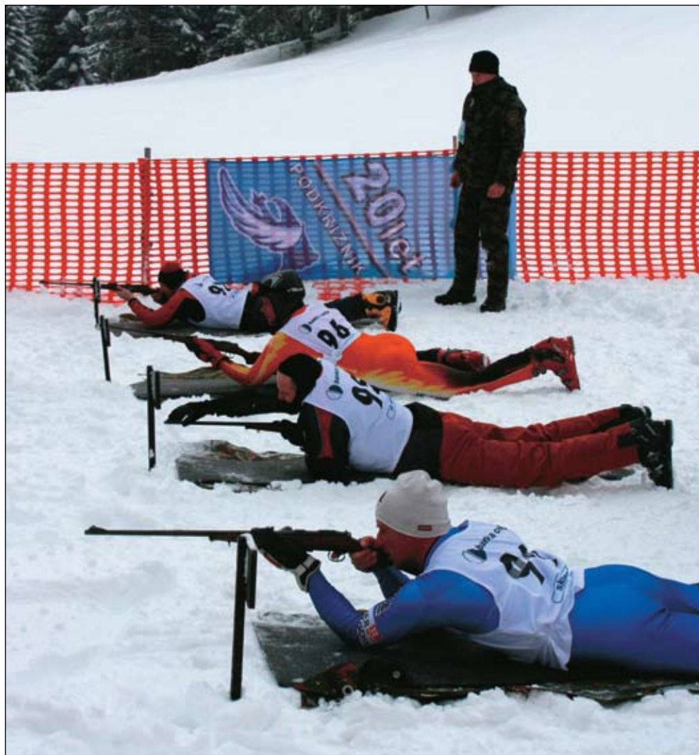
Na začasnem strelišču Morava so se tekmovalci pomerili v streljanju z MK-puško

SV Celje 2. Poveljstvo sil SV Vrhnika Razvrstitev v kategoriji