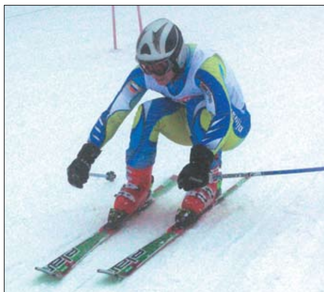
V nizki preži proti cilju