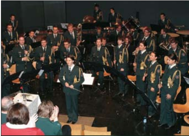
Nastop orkestra Slovenske vojske