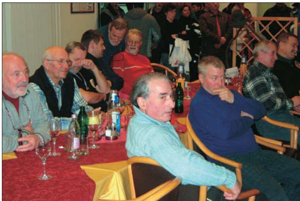
Guestje iz tujine - pripadniki mednarodne federacije vojakov gornikov