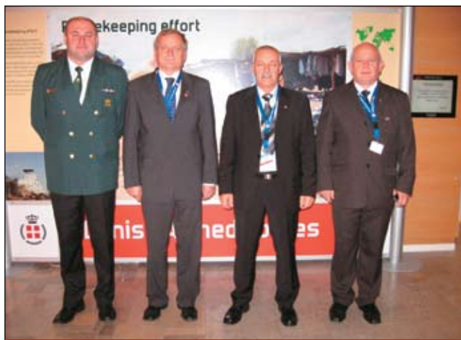
Slovenska delegacija na 26. svetovnem veteranskem kongresu

Na zasedanju je bilo sprejetih 28 resolucij, s katerimi države, ki so jih predlagale, želijo doseči, da se posamezne zadeve bolj celovito uredijo (npr. socialni status veteranov). ZVVS bo vse resolucije posredovala ministrstvu za delo, ki je v Sloveniji zadolženo za to področje, nekaj