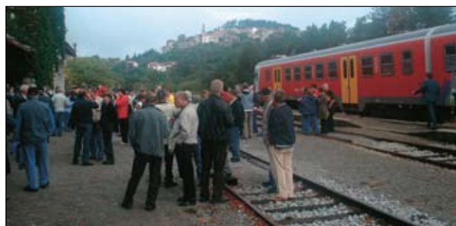
Postanek v Štanjelu

Po letnem načrtu dela OZVVS Bela krajina vsako leto v oktobru organizira izlet za svoje članstvo. Letos smo se odloči-