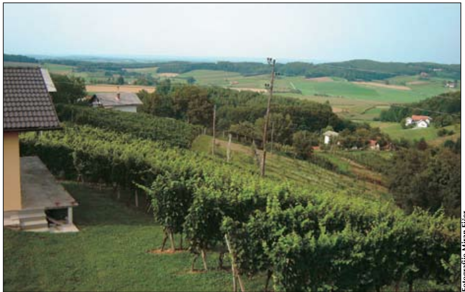
KS Tomaž je bila po svoji geografski legi naravno zaledje v nekdanji občini Ormož.