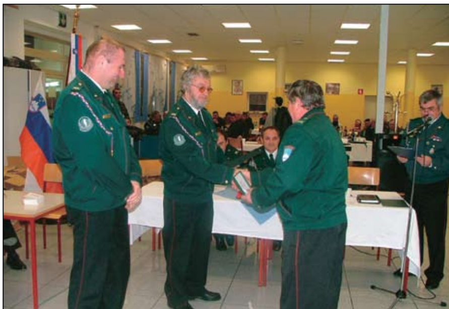
Podelitev priznanj ZVVS in OZVVS Brežice najbolj zaslužnim in aktivnim članom organizacije