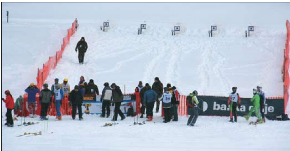
Na začasnem strelišču Morava so se tekmovalci pomerili v streljanju z MK-puško.

V slabih vremenskih razmerah se je tekmovanje končalo brez nezgod in ob veliki tekmovalni vnemi. Na smučarski progi Beli zajec (dolžine 1300 m in z višinsko razliko 205 m) so tekmovalci opravili hitrostno preizkušnjo v smuku, na cilju v dolini Morava pa še streljanje z MK-puško v tarče na razdalji 50 m. Ob sodelovanju tekmovalcev Slovenske vojske (SV), 20. motorizirane bataljona SV Celje (tudi