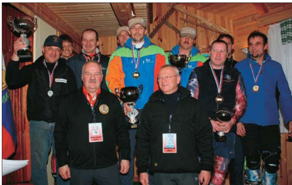
Zmagovalne ekipe 7. državnega prvenstva ZVVS v smučanju in streljanju Golte 2010

Na strelišču v Moravi je vseh 150 tekmovalcev pokazalo svoje strelske sposobnosti. ■