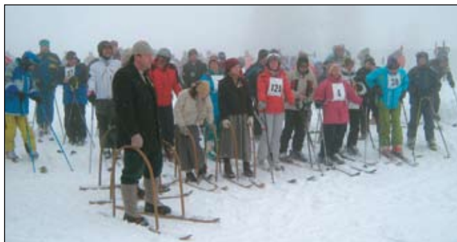
Udeleženci med otvoritveno slovesnostjo

Smučarski center Cerkno je ponovno gostil slovenske veterane različnih generacij, ki so se zbrali na tradicionalni spominski prireditvi Partizanske smučine Cerkno 45, ki poteka v spomin na prve organizirane partizanske smučarske tekme, organizirane na osvobojenem ozemlju Cerkljanskega sredi tedaj okupirane Evrope. V sklopu te prireditve je sodilo že 6. prvenstvo veteranov vojne za Slovenijo v veleslalomu.