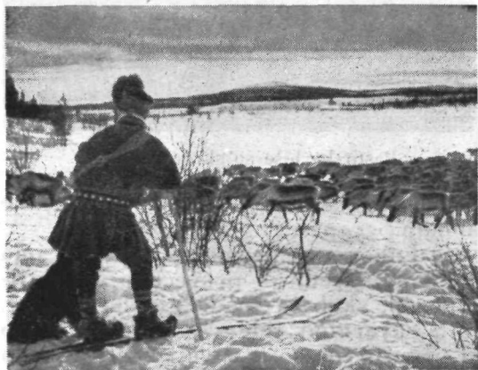
Paša na sneženi poljani

Laponci torej prežive vse dolge dneve na snegu pri čredi, le včasih gredo na lov nad škodljive lisice, volkove itd. Noči prežde ti