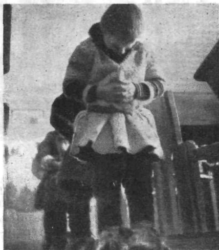
Molitev pred poukom

Stalnih potov ni, ne mostov. Manjše vode prebredejo. Če jim njihovo pot zapre jezero, se popeljejo čezenj s čolnom (»eka«). Tega je treba poiskati. Kje ob obali je, skrit pod vejevjem grmičevja ali kupom vej. Last vsakogar je in nikogar. Namenjen je za uporabo vsem Laponcem, ki ga rabijo na svojih potih čez jezero. Na obrežjih je po več takih čolnov.