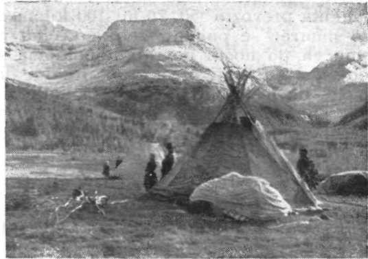
Pastirske hiše so skromni šotori

V početku so bili naseljeni ob bregovih rek in jezer, kjer jim je obilno ribje bogastvo obetalo dosti kruha. Toda tamkajšnji narodi so jih izrinili na sever. Sčasoma so udomačili velikanske črede severnih jelenov, ki so tod doma. In velika večina laponskih rodov je, ki so že stoletja pastirji. Malo Laponcev ima stalna bivališča. Ti so večinoma lovci in obalni ribiči ter poljedelci. Domovi teh so skromne, v dolinah postavljene kolibe. Ob njih so majhne, skrbno obdelane zaplate zemlje. Zemlja je tu zelo skopa, le malo vrne Laponcem za njihov znoj in žulje. V glavnem pa so Laponci pastirji udomačenih severnih jelenov. S čredami vred so pravi brezdomci, večni romarji. Potujejo s pašnika na pašnik, skozi brezove hoste, čez močvirja in nepregledne planjave jih vodijo ta selitvena pota.