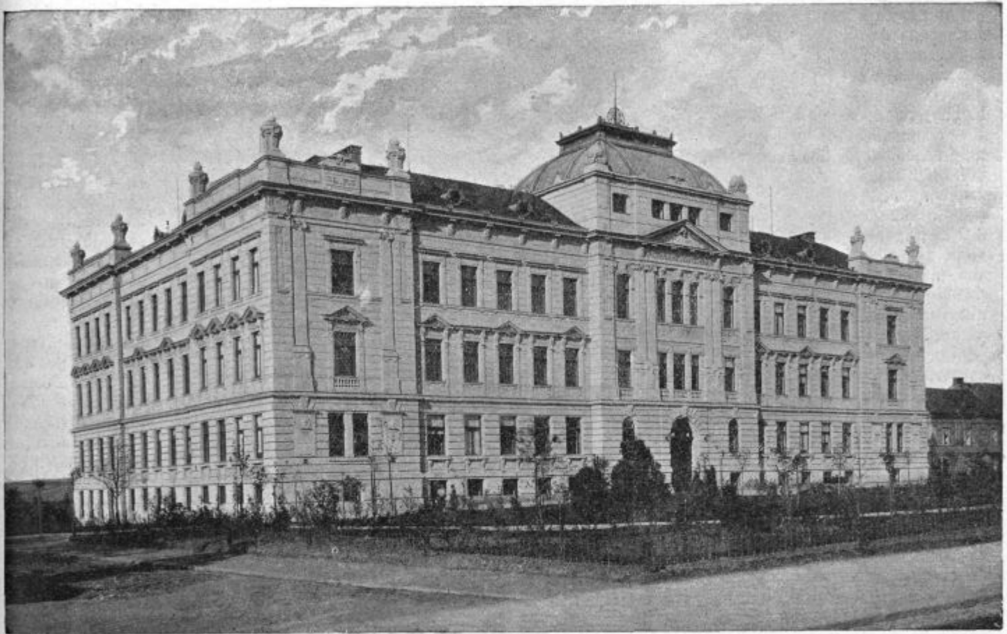
Podoba 14. Gospodarska akademija v Táboru.

Voluharjeva najhujša sovražnica je podlasica, mala in velika. Obe gresta po voluharja v njegove rove. Zato pa tam ni voluharjev ali le malo, kjer so podlasice. Le škoda, da je podlasic malo in prebivajo naredkoma. Ne preganjajte torej podlasic!