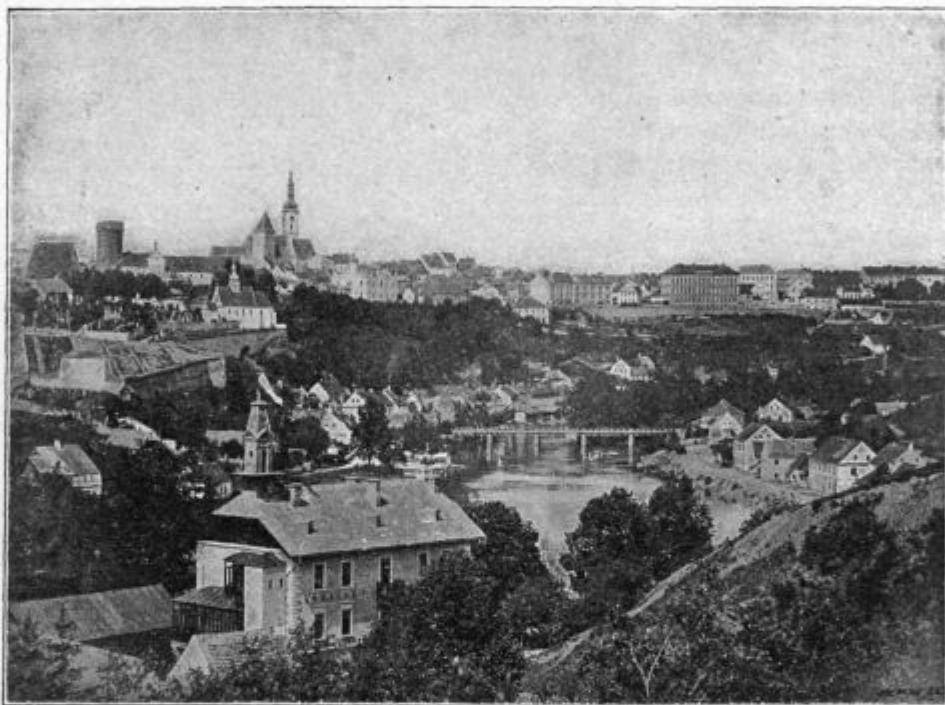
Podoba 15. Pogled na Tábor.

in porabo sadja (6), lanarska društva (12), društva za pridelovanje kislega zelja (2), društvo za prodajo in porabo zelenjadi (1), živinorejske zadruge (15), društvo za izdelovanje in prodajo škorba (1), tkalsko društvo (1), strojniške zadruge (65), in razne druge (4). Hvalvredno je, da so na Češkem vse češke zadruge združene v eno samo zvezo, ne glede na politično naziranje udov, dasi imajo Čehi 11 polit. strank.