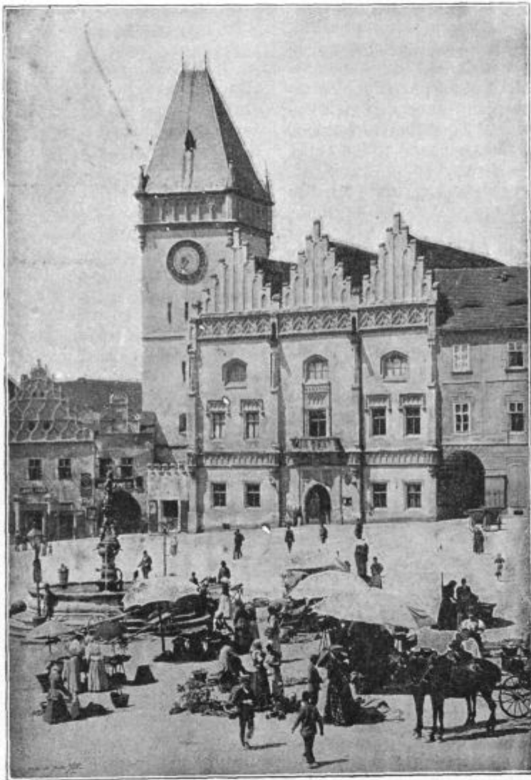
Podoba 16. Mestna hiša (rotovž) v Táboru.