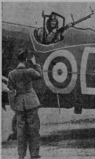
Francoski letalski častnik daje pred dvigom v zrak zadnja navodila strelcu pri strojnici v angleškem bombniku