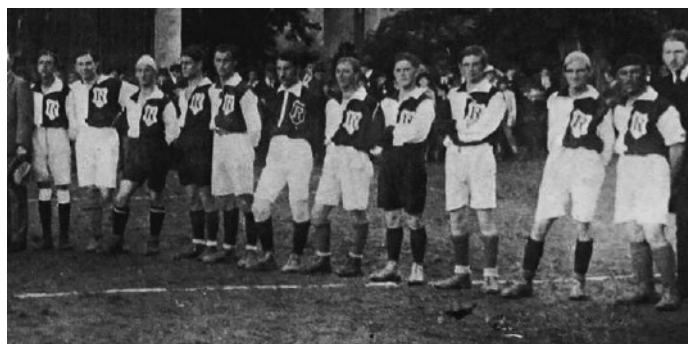
Slika 7: Moštvo SK Rote Elf pred tekmo proti SK Slovanu leta 1920. Rdečih 11 nastopajo v značilnih rdeče-belih majicah z veliko črko R na prsih.