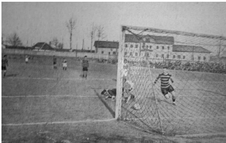
Slika 3: Utrinek s tekme med SV Rapidom in SK Ilirijo 29. marca 1921. Rapidlerji nastopajo v značilnih črno-modrih črtastih majicah.