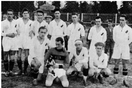
Slika 5: Moštvo SV Rapida ob koncu dvajsetih let.