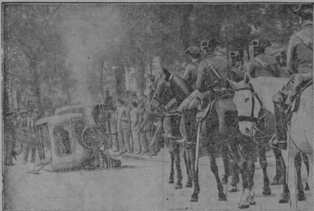
Nemiri v Madridu na Španskem. — Španska revolucija je rodila vsakdanje krvave nemire ter izgrede. Na sliki vidimo avto urednika monarhističnega lista, katerega so republikanci prevrnili in zažgali, a celo grozodejstvo vojaštvo na konjih mirno gleda.

V drugem slučaju so zopet našli zlati prah brez primesi zemeljskega prahu, kar se v naravi ne dogaja. Šlo je za potvorbo, a kako je bila izvršena, to je dognala šele dolgotrajna preiskava. Zlati lopov je imel v škornjih pripravo, ki je vsebovala zmes zlatega prahu z