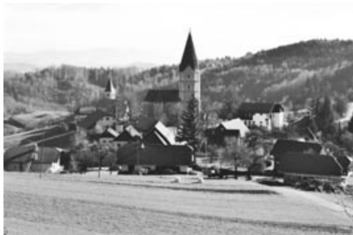
SVETINA – panorama ene najlepših vasi v Sloveniji z edinstvenim kulturno-sakralnim objektom

Nad Štorami na nadmorski višini 683 m, stoji Svetina, vas o lepotah katere je pisala že svetovna popotnica in pisateljica Alma Karlin. Tudi dandanes njena pristnost ni spregledana in Svetina pobira najvišja mesta na tekmovanjih za najlepši hribovski kraj v Sloveniji.