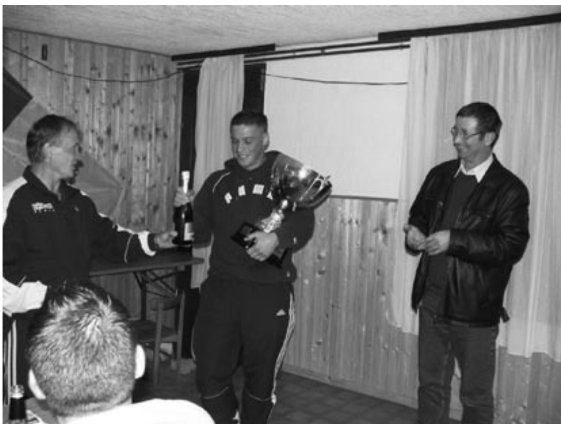
Prejem prehodnega pokala za 1.mesto v 1.ligi