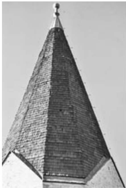
STREHA ZVONIKA – vidno je odpadanje skodel, zaradi česar so, kljub dvojnemu kritju, na posameznih mestih že zevajo luknje

Vasici daje poseben pečat Cerkev Svete Marije (Snežne). Zgrajena je bila pred letom 1487, kajti zgodovinski viri pričajo, da so jo tega leta požgali Turki. Med drugim, je namreč takrat služila tudi kot obrambna utrdba. Skozi vsa stoletja je praktično ostala v prvotni podobi, z izjemo nekaj zadnjih desetletij, ko ni več na razpolago izvornega materiala in mojstrov. Ena izmed njenih posebnosti je fasada, ki ni bila nikoli narejena.