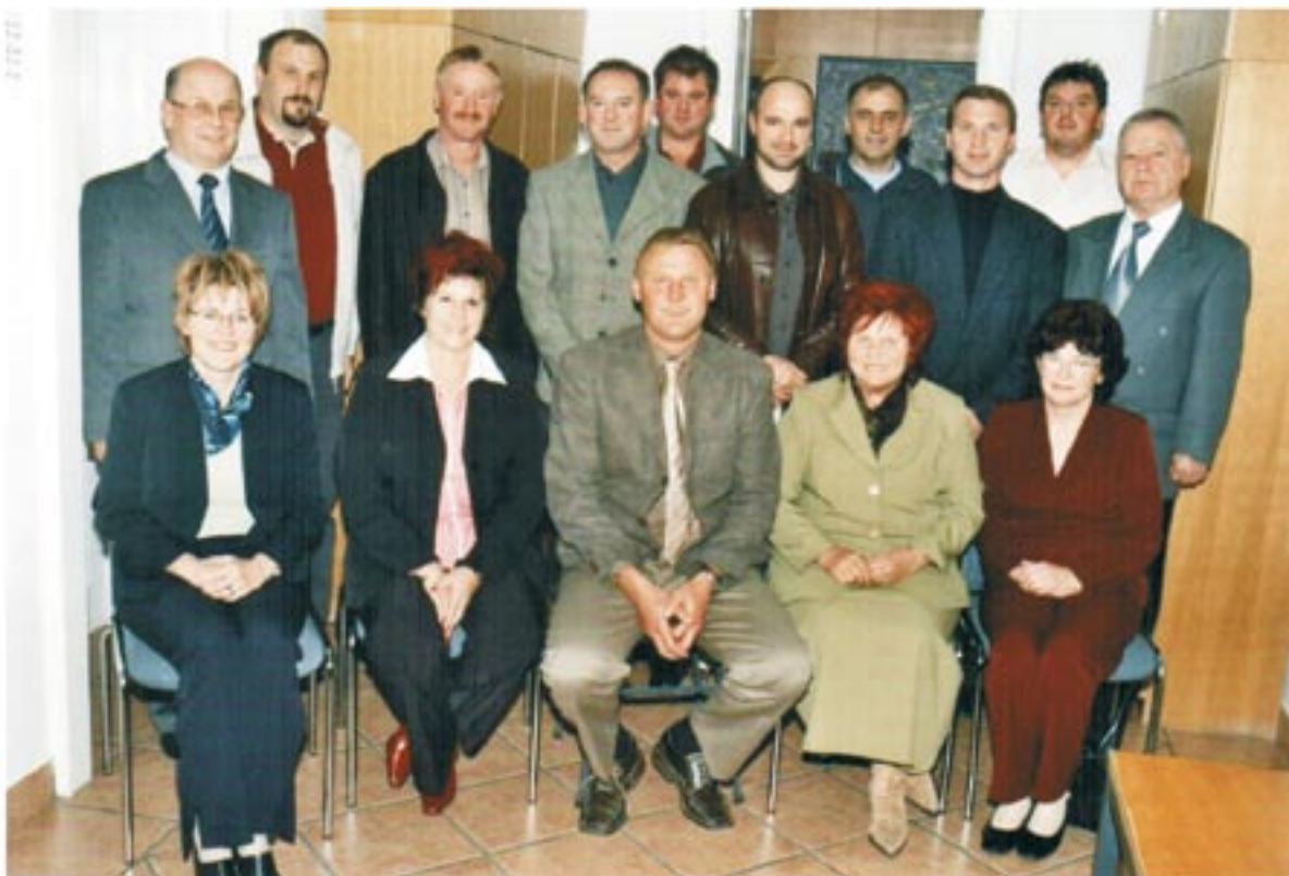
Župan ter novo izvoljeni člani Občinskega sveta Občine Štore

Želim vam, da bi v letu 2007 skupaj naredili še več trajno dobrega za vse in imeli dovolj moči, da bi v dobro preobrnilo tudi vse preizkušnje, ki nam jih prinaša življenje. Vsem želim vesele božične praznike in vse dobro v letu 2007.