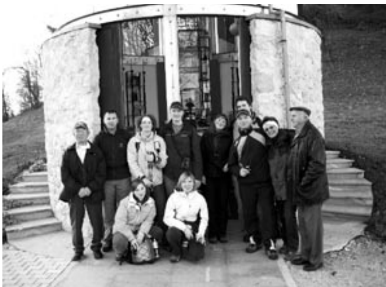
Pri kapeli Svete barbore v Trobnem dolu

Leto je zopet naokoli, spet je tu »veseli« december, v katerega smo člani društva in številni pohodniki, letos že šestič, vstopili s tradicionalnim pohodom s Pečovja v Trobni dol. Večini občanom naše občine je ta pohod že dobro poznan. Prirejamo ga člani ŠKD Rudar Pečovje vsako prvo decembrsko soboto v čast sv. Barbare, zavetnici rudarjev, ki goduje 4. decembra. Zjutraj nas je razveselilo s soncem obsijano štartno mesto, kjer se je zbralo rekordno število preko 300-tih pohodnikov, ki so s