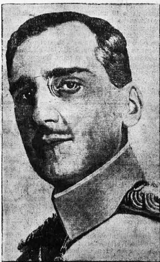
gov praded Crni Jurij, vse težke borbe od prvega ustanka pa do zmagovalja srbskih praporcev na bojiščih osvobodene Srbije.

Ljubeči mož svoje vzorne žene, naše kraljice Marije, ljubeči oče svojih lepih otrok, naših krepkih jugoslovenskih Dečkov ni porabil zadnjih svojih moči in zadnjih svojih dihov, da pošlje pozdrave svoji osirotili družini. Še v tem strahotnem trenutku se mu je pred Njegovim duhom razvila historija jugoslovenskega naroda tam od slavni srbskih kraljev preko Kosova in stoletne sužnosti pod polumesecem, prikazali so se mu vsi oni heroji, ki so drug za drugim polagali svoja življenja na žrtvenik svobode in ujedinjenja, prikazali so se mu vsi veliki preroki jugoslovenske misli, nje-