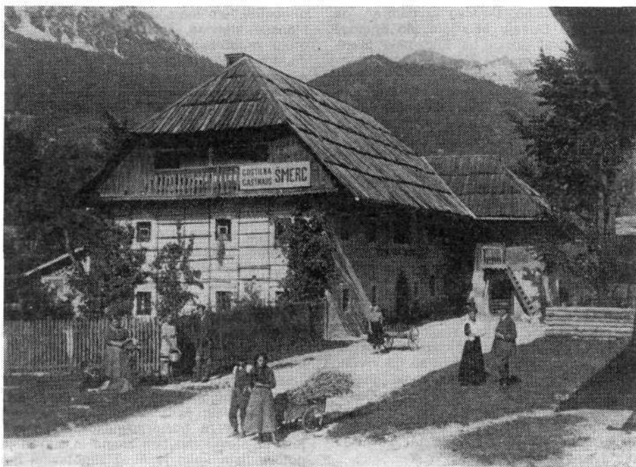
Pri Smercu v Mojstrani se je njega dni razrešila marsikatera zadeva