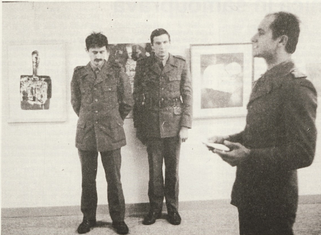
V likovnem salonu v Kočevju so člani likovne sekcije Doma JLA iz Ribnice organizirali razstavo v počastitev 22. decembra,