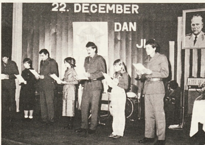
Posnetek je z ene izmed mnogih prireditev kulturne skupine ribniškega garnizona, ki često nastopa v sodelovanju z mladimi iz ribniške organizacije ZSMS.