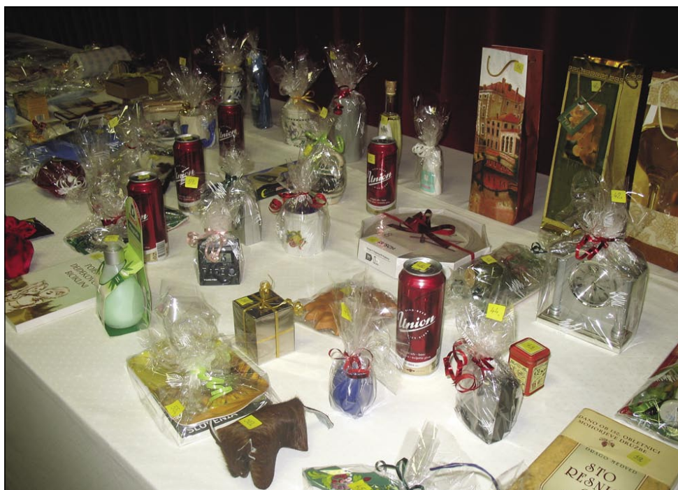
Na tomboli je dosta slovenski darov bilau

bimo svojo materno rejĉ. Sploj pa po varašaj, gde go leko bole na rejtki nŕcamo. Zvŕn toga bi radi vsikšo leto na slovenskom bali nutpokazali našim padašom Madŕarom in Hrvatom lejpe slovenske pesmi s slovenskimi reĉami. « Predsednica sombotelske slovenske samouprave je vŕpostavila dŕh padaštva pa eške ĉŕjdala: »Geslo gnešnjoga bala najbau: 'Pesem in glasba ohranjata jezik in kulturo ter posredujeta med kulturami!'«