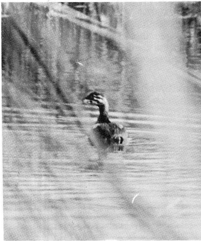
Slika 4: Dorasli mladostni sivogrli ponirek, Levišče, 2. 8. 1990

Sivogrli ponirek je v Sloveniji doslej veljal za redkega preletnika in zimskega gosta, o gnezdenju pa ni bilo podatkov. Zelo skopi so tudi podatki o opazovanju v gnezdilni sezoni in blizu nje. Takšni so štirje in vsi so iz Acrocephalus . V letu 1990 pa je v Leviščih na Cerkniskem jezeru zagotovo gnezdil en par sivogrlih ponirkov, ki je vzredil dva mladiča. To je torej prvi podatek o gnezdenju te vrste na ozemlju republike Slovenije. Zelo verjetno pa je, da je gnezdilo še več parov, saj obstajajo podatki o opazovanju še 1 oziroma 2 družin z doraslimi mladiči. Sploh pa če upoštevamo, da po skopih znanih podatkih družina ostane dolgo časa skupaj in da mladi poletijo precej pozno. Dva mladiča sta bila najdena še v Zadnjem kraju.