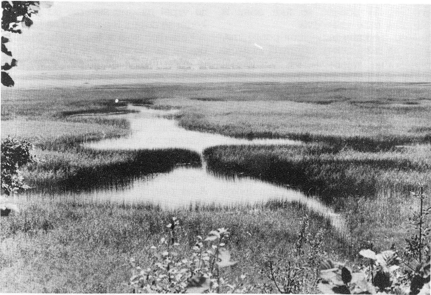
Slika 3: Pogled na Levišča z griča severno od vasi Otok. (T. Jančar) Fig. 3: A view at Levišča from the hill north of Otok village (T. Jančar)

z namenom, da ponirke fotografiram. Vsi so bili še tam, kot prejšnjič, le eden staršev doraslega mladiča je manjkal. Kot da bi se v tednu, ki je minil, mali osamosvojil. Pač pa sem severno od griča, s katerega je razgled na Levišča, odkril še eno družino sivogrlih ponirkov. Ta je štela dva dorasla mladiča in enega od staršev. Tudi ta dva sta, kot oni pred tednom, sitnarila pri staremu. Obstaja možnost, da je ta družina prav tista spred prejšnjega tedna. Čisto verjetno pa je, da gre v resnici za tretjo družino. Še posebej zato, ker se je en dorasli mladič tudi tokrat zadrževal prav tam, koder sem prvič videl drugo družinico.