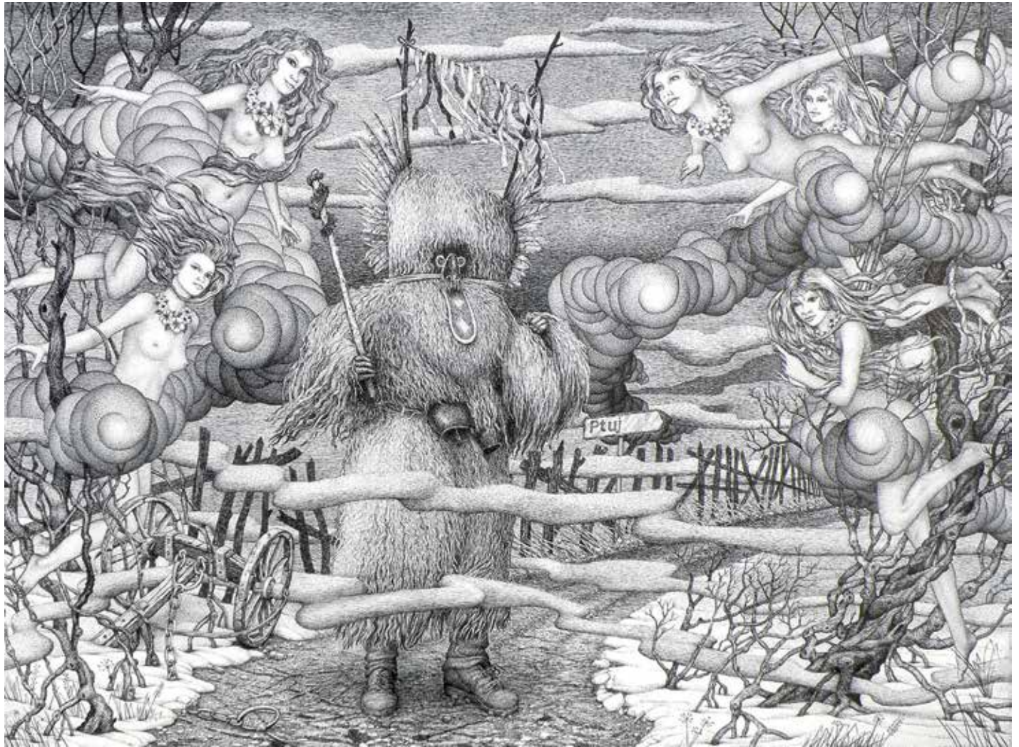
23. Pomladni nemir, 2020, ilustracija, perorisba, papir, 65 × 88 cm

plakatov in fotografijo. Je član ZDSLU in DLUM. Predstavil se je na več samostojnih in skupinskih razstavah po Sloveniji, Avstriji in Italiji. Leta 2017 je prejel nagrado DLUM. Živi in ustvarja v Pernici pri Mariboru.