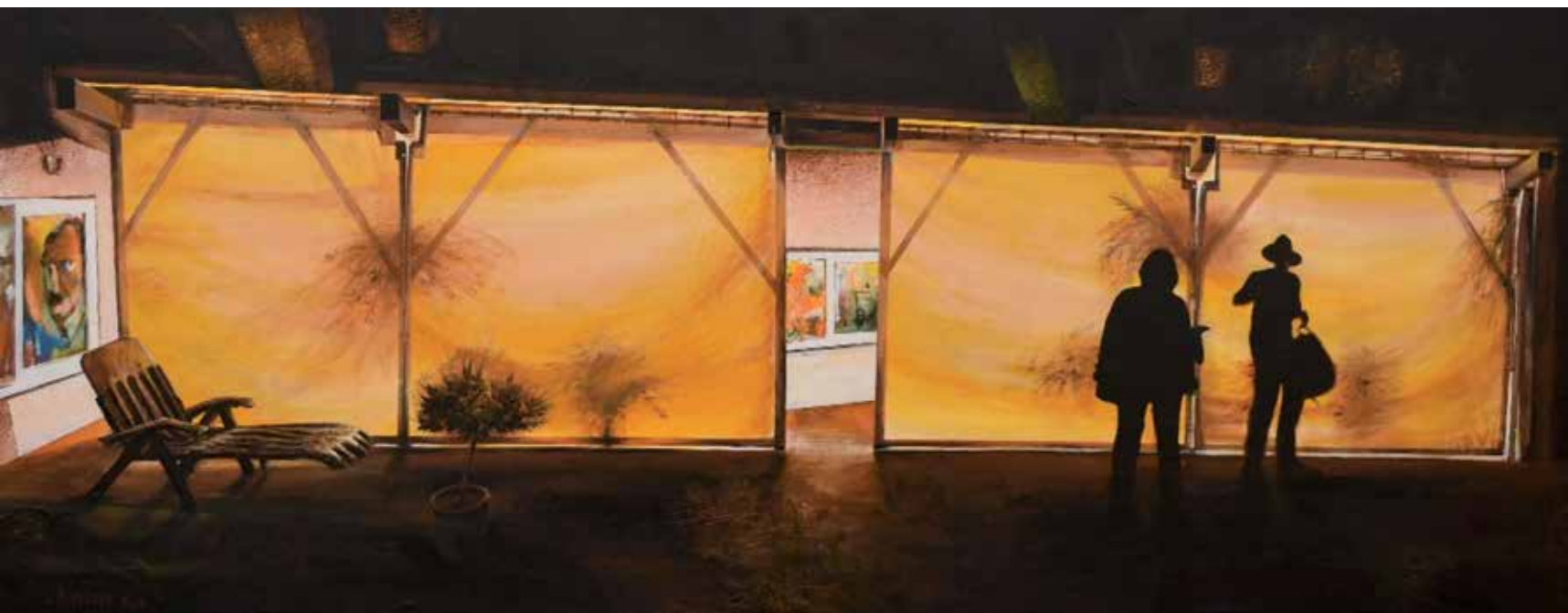
8. Prepričevanje, 2013, akril, platno, 70 × 181 cm

Rodil se je leta 1949 v Mariboru. Leta 1974 je na Akademiji likovnih umetnosti v Zagrebu diplomiral iz slikarstva pri prof. M. Stančiću. Podiplomski študij je nadaljeval na grafični specialki pri prof. A. Kinertu in ga leta 1976 zaključil kot magister grafičnega oblikovanja. Med študijem je poučeval na Pedagoški gimnaziji v Zagrebu, po študiju pa kot likovni pedagog na III. gimnaziji v Mariboru. Od leta 1974 je član DLUM, ZDSLU in likovnih ustvarjalcev INSEA. V skoraj 50-letni dobi članstva v DLUM-u je opravljal vse vrste funkcij, med 1982-86 je bil predsednik in član Sveta UGM. Predstavlja se na samostojnih in skupinskih razstavah doma in v tujini. Znan je kot slikar, grafik, risar, avtor knjižnih ilustracij in oprem, grafičnih in kaligrafskih podob, karikatur, stenskih poslikav itd. Leta 2010 je prejel nagrado DLUM. Živi in ustvarja v Mariboru.