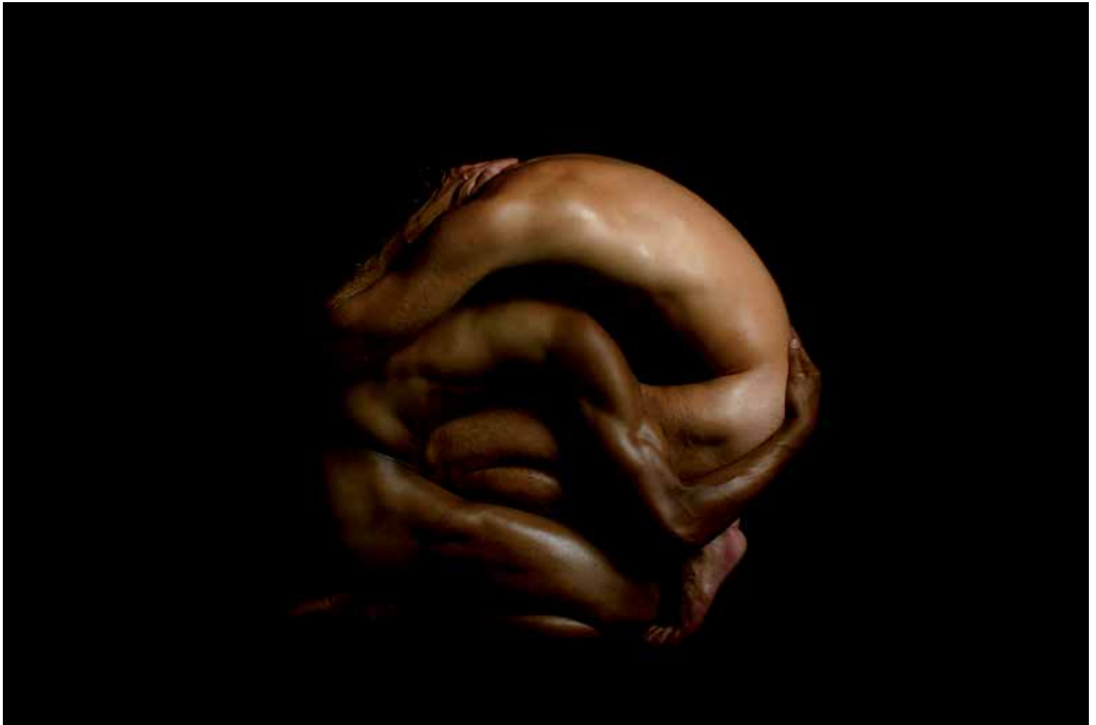
25. Jin–Yang, iz serije Dvojice, 2004, fotografija, 40 × 60 cm

Maribor, katerega članica je postala leta 2000. Od leta 2013 do 2017 je bila članica IO Fotografske zveze Slovenije in IO Zveze kulturnih društev Maribor. Imela je več kot 50 samostojnih razstav, tako doma kot v tujini, za ustvarjalnost na področju fotografije pa je prejela številna priznanja in nagrade. Od leta 2011 je samozaposlena v kulturi. Živi in ustvarja v Mariboru.