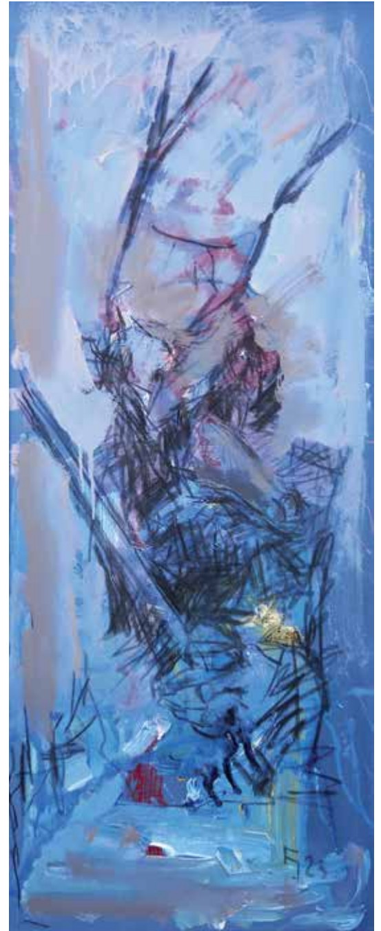
5. Korant, 2023, akril, oglje, platno, 140 × 55 cm