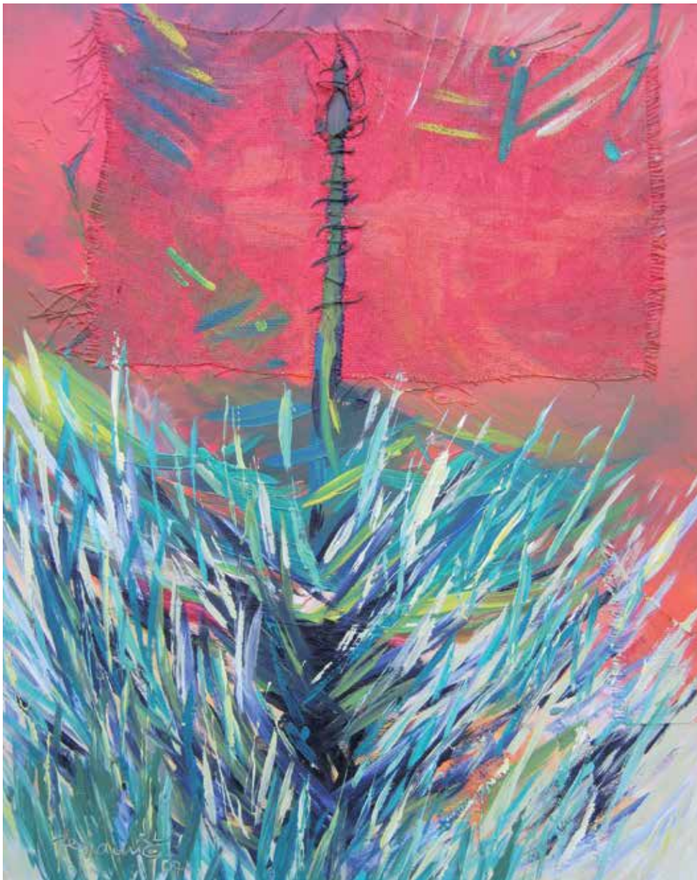
4. Skozi travo, 2007, mešana tehnika, lesomal MDF, 98 × 78 cm

Rodila se je leta 1955 v Celju. Diplomirala je iz likovne umetnosti na Pedagoški fakulteti. V Rogaški Slatini je aktivna organizatorica kulturniških prireditev in predana likovna pedagoginja. Ukvarja se s slikarstvom in z grafiko, občasno pa se je podala tudi v raziskovanje oblikovanja gline in lesa. Razstavljala je samostojno in na številnih skupinskih razstavah. Je članica več umetniških društev, med drugim ZDSLU in DLUM. Živi in ustvarja v Rogaški Slatini.