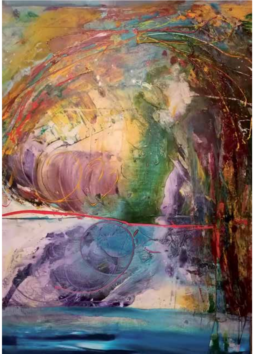
17. Med nebom in nebom, 2018, akril, platno, 170 × 120 cm