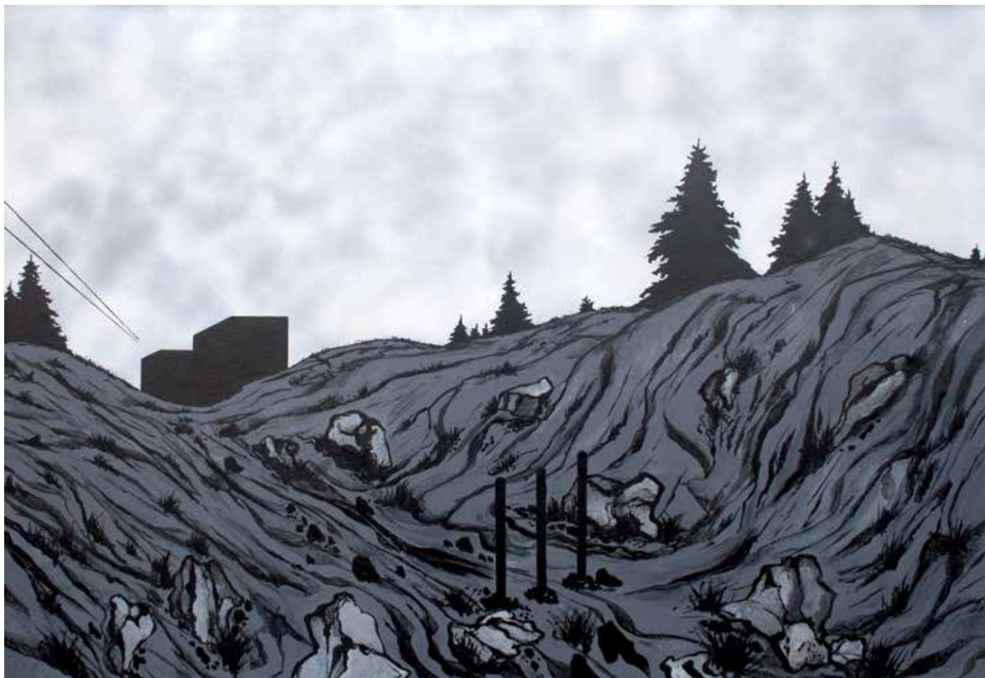
9. ***, 1972, akril, platno, 90 × 130 cm

na gimnaziji pedagoške smeri v Mariboru. Leta 1996 je postal profesor na ALU v Ljubljani. Ukvarjal se je s slikarstvom, risbo, grafiko, knjižno opremo, scenografijo, fotografijo... Bil je član DLUM, DLUL, Saveza likovnih umetnika Jugoslavije in Fotokluba Maribor. Je prejemnik številnih priznanj in nagrad. Leta 2009 je prejel Prešernovo nagrado za življenjsko delo. Umrli je leta 2015 na Ptuju.