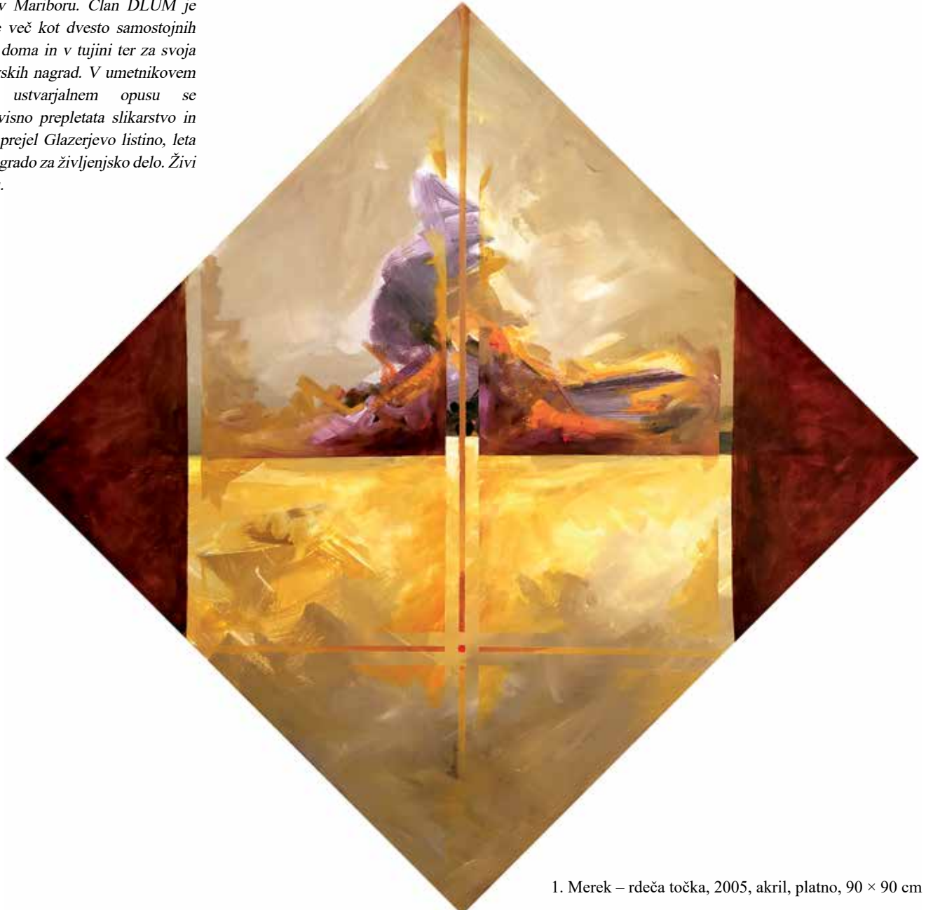
1. Merek – rdeča točka, 2005, akril, platno, 90 × 90 cm

Rodil se je leta 1942 v Zrenjaninu. Diplomiral je iz slikarstva na ALU v Ljubljani leta 1967 (prof. M. Sedej). Zaposlen je bil kot vodja reklame in aranžerske delavnice v blagovnici KVIK, nato kot učitelj likovnih predmetov na Srednji šoli za trgovinsko dejavnost ter kot izredni profesor slikanja in likovne teorije na Oddelku za slikarstvo Pedagoške fakultete v Mariboru. Član DLUM je od leta 1975. Imel je več kot dvesto samostojnih in skupinskih razstav doma in v tujini ter za svoja dela prejel več stanovskih nagrad. V umetnikovem celovitem likovno ustvarjalnem opusu se enakovredno in soodvisno prepletata slikarstvo in grafika. Leta 2002 je prejel Glazerjevo listino, leta 2019 pa Glazerjevo nagrado za življenjsko delo. Živi in ustvarja v Mariboru.