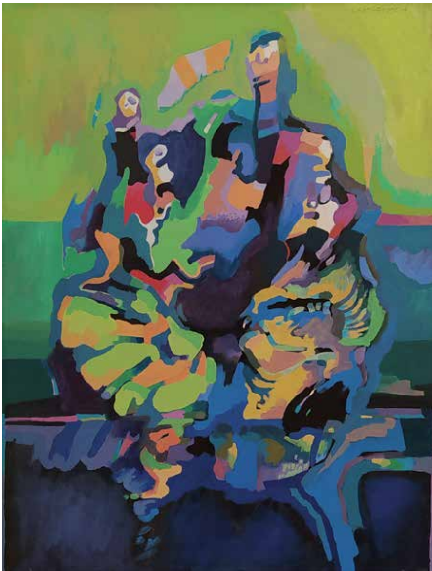
13. Na obali, 1994, akril, platno, 84 × 64 cm

Rodil se je leta 1937 v Mariboru. Diplomiral je na Akademiji za likovno umetnost v Ljubljani, študij pa dopolnil z grafično specialko pri prof. Apolloniju Zvestu na isti ustanovi. Zaposlen je bil na likovnem oddelku Pedagoške fakultete v Mariboru kot izr. profesor didaktike likovne vzgoje. Kot dolgoletni član Izvršnega odbora DLUM-a je štiri leta opravljal funkcijo predsednika društva. Ustvarja v grafičnih tehnikah sitotiska in digitalne grafike, poleg tega tudi v olju in akrilu na platno ter akvarelu in temperi. Njegovi najpogostejši likovni motivi so klasične krajine, vedute in portreti ter asociativne abstrakcije. Razstavlja doma in v tujini (IT, AT, DE, ZDA, HR, HU,...). Prejel je več nagrad, med njimi Nagrado DLUM za računalniško grafiko. Živi in ustvarja v Mariboru.