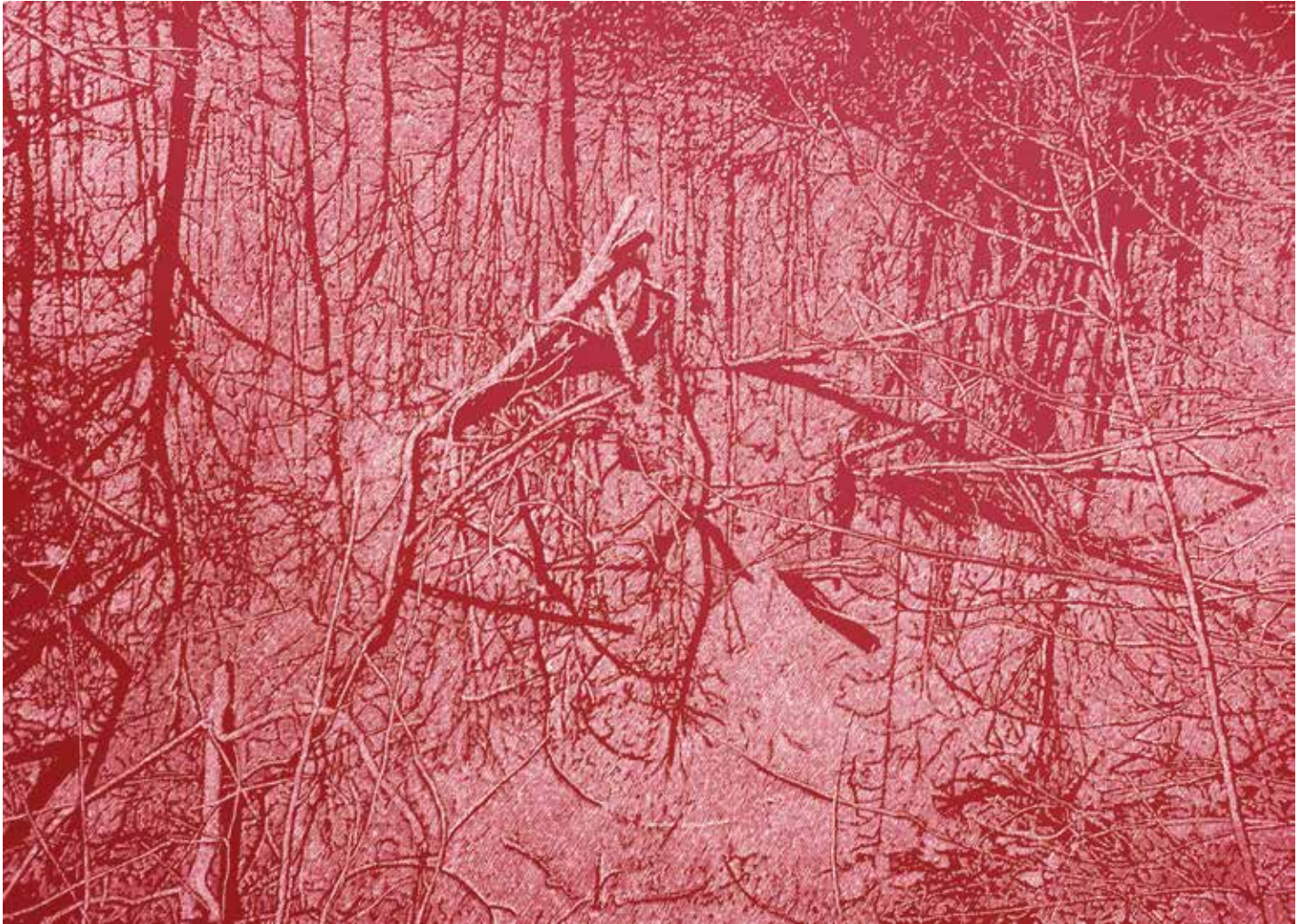
24. Komplementarna kontemplacija 7, 2021, tuš, papir, 50 × 70 cm

slovenskih likovnih umetnikov. Rezidenčno je bivala v Gradcu (Cultural City Network Graz, AT, 2008), Parizu (Cité Internationale des Arts, FR, 2011 in 2015) in Freisingu (Schafhof – Europäisches Künstlerhaus Oberbayern, DE, 2014). Svoja dela je predstavila na številnih razstavah doma in v tujini ter prejela več nagrad. Kot samozaposlena v kulturi živi in ustvarja v Mariboru.