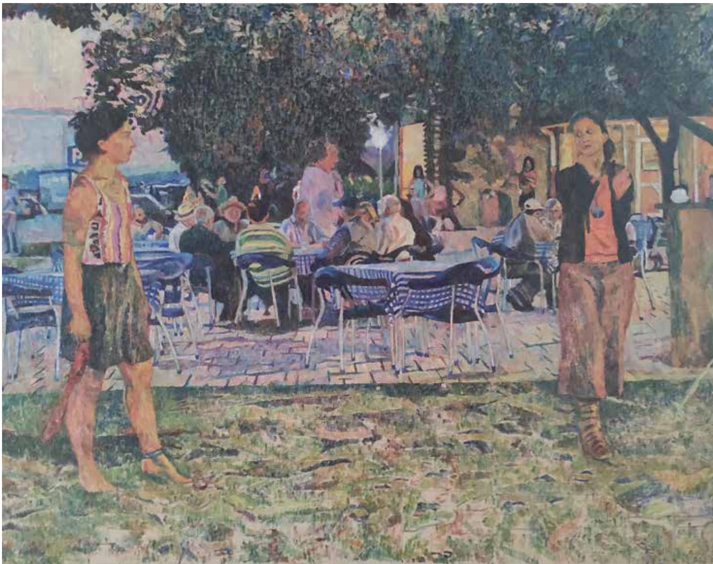
20. Žonglerki, 2006, olje, platno, 134 × 171 cm

Deluje kot samostojna kulturna delavka, status je prekinila le med bivanjem v Salzburgu. Razstavlja na skupinskih in samostojnih razstavah doma ter v tujini. Za svoje delo prejela več nagrad: Nagrado DLUM 2004, 2008, in 2023 ter Nagrado na 8. Likovnem extemporu Eko Drava 2019. Je članica DLUM in ZDSLU. Živi in ustvarja v Zlatoličju pri Mariboru.