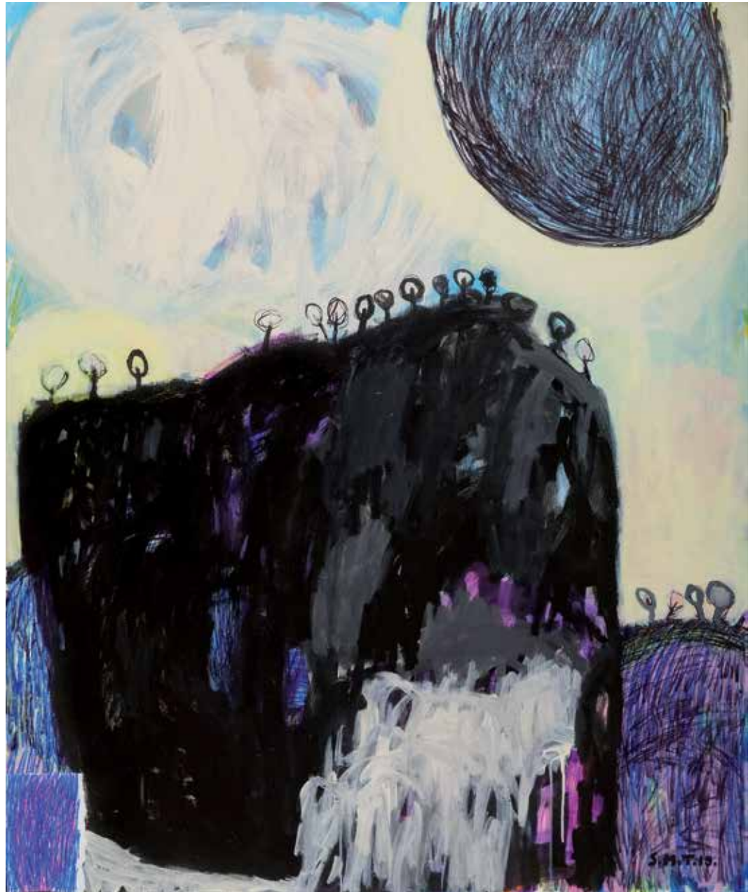
15. Neobiskani snegovi (Bosna), 2019, mešana tehnika, platno, 120 × 100 cm