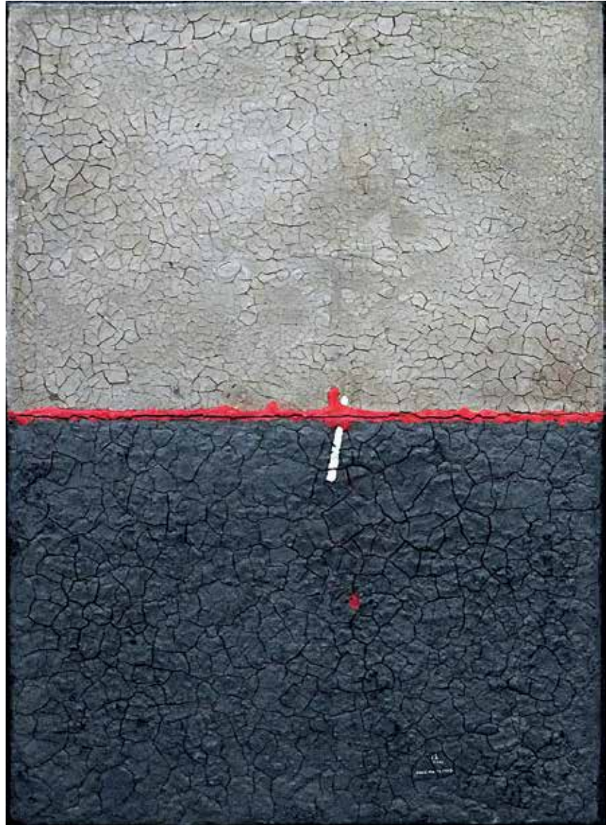
11. Telurski znak, 1989, mešana tehnika, juta, 76 × 56 cm

Rodil se je leta 1959 v Gornjem Crnjelovem, občina Bijeljina v Bosni in Hercegovini. Srednjo izobrazbo je pridobil na Šoli usmerjenega izobraževanja kovinske stroke, smer kovinostrugar, v Bijeljini, nato se je vpisal na mariborsko Pedagoško akademijo, smer likovna vzgoja, kjer je diplomiral leta 1982 in kasneje na Pedagoško fakulteto, kjer diplomira leta 1993. Član DLUM-a je že od leta 1986. Umetniško se izraža na več področjih; v slikarstvu, skulpturi, fotografiji in poeziji. Razstavlja skupinsko in samostojno. Leta 2000 in 2012 je prejel Nagrado DLUM. Živi in ustvarja v Mariboru.