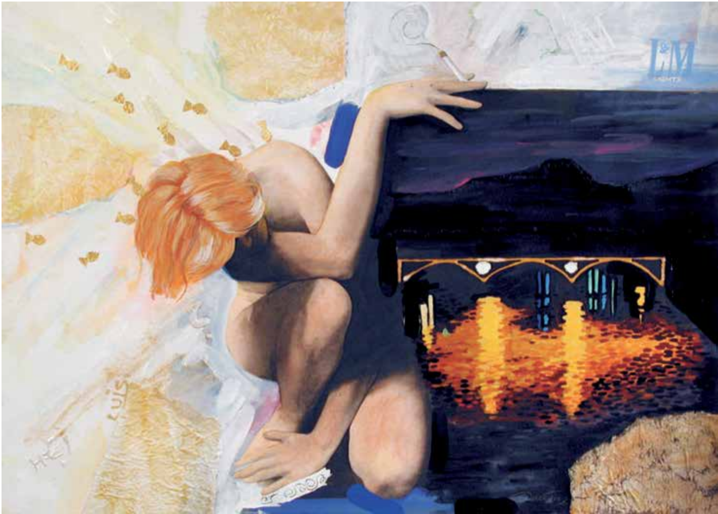
2. L & M light, 2002, mešana tehnika, papir, 50 × 70 cm

Rodila se je leta 1963 v Mariboru. Leta 1985 je absolvirala na Akademiji za likovno umetnost v Ljubljani. Od takrat je članica DLUM, kateremu je predsedovala med letoma 2002–2003 kot prva ženska. Ukvarja se z grafičnim oblikovanjem in s slikarstvom. Živi in ustvarja v Mariboru.