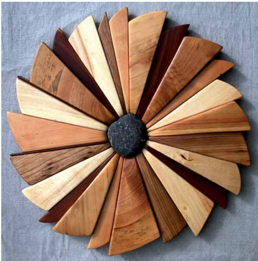
12. Vetrnica, Sedem lesov in prodnik, 2018, les, kamen, 67 × 65 cm