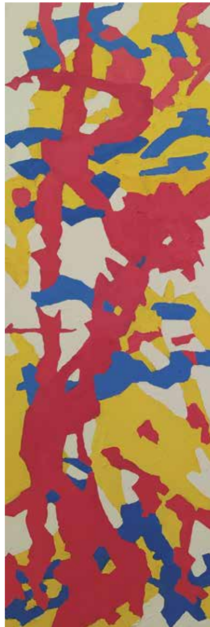
7. Kompozicija I. / Kompozicija II., 2020, olje, platno, 120 × 40 cm