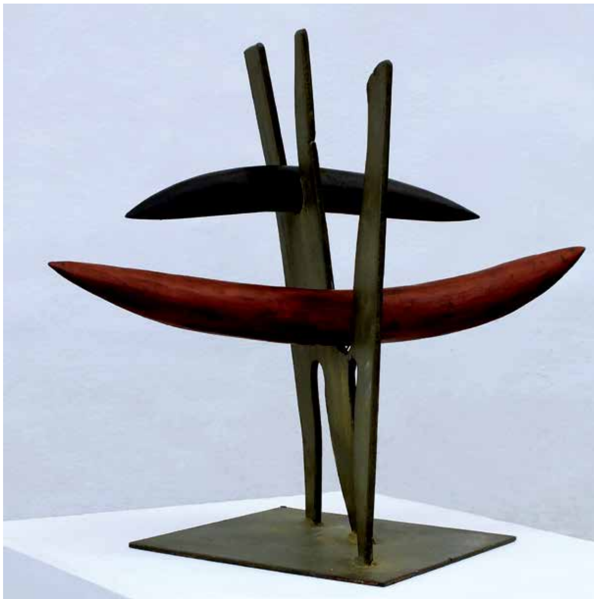
26. Odin saga - Rogovje z rdečim, 1995, železo, les, 40 × 46 × 31 cm

Rodil se je leta 1946 v Mali Nedelji. Diplomiral je na Akademiji za likovno umetnost v Ljubljani, smer kiparstvo, leta 1972. Deloval je kot profesor na srednjih šolah, industrijski in grafični oblikovalec, kipar in scenograf. Od leta 1976 je bil član ZDSLU in DLUM. Sodeloval je na več kot 200 razstavah doma in v tujini. Ustvaril je več javnih spomenikov (Maribor, Ruše, Ribnica na Pohorju, Radlje ob Dravi, Videm ob Ščavnici, Ljubljana, Štanjel) in scenskih del za gledališke predstave SNG Maribor (Faust, Nabucco, Hamlet, Kneginja čardaša, Carmen, Figarova svadba). Umrli je leta 2018 v Mariboru.