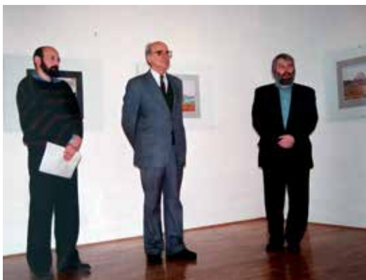
F12. Vabljeni mladi 2016