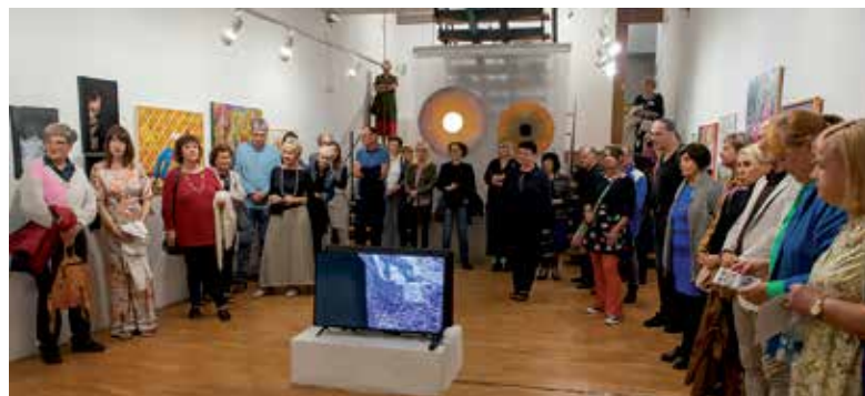
F13. Odprtje razstave petih slovenskih društev pod naslovom Dobimo se v Mariboru, 2023