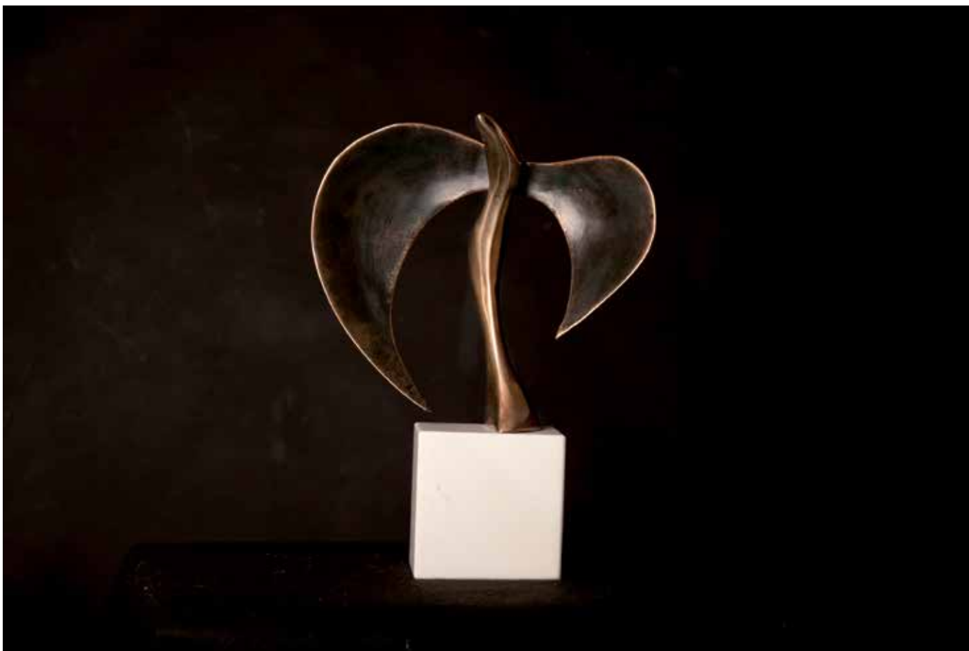
14. Zmajkulja, 2023, bron, kamen, 29 × 22 × 11 cm

Rodila se je leta 1977 v Mariboru. Leta 2002 je diplomirala je na Akademiji za likovno umetnost v Ljubljani, smer kiparstvo. Od leta 2003 se kot samostojna ustvarjalka na področju kulture ukvarja z instalacijo. V zadnjih letih svojo ustvarjalnost predvsem usmerja v javno plastiko (ustvarila je več spomenikov in skulptur, mdr. spominsko ploščo žrtvam letalske nesreče na gori Sv. Petra, Korzika, (2008), spomenik Ivanu Minattiju, Slovenske Konjice (2015), spomenik Franu Korunu Koželjskemu, Velenje, (2018), spomenik Jožefu Krajncu, Velenje (2021), spomenik Francetu Bevku, Cerknjo (2022), spomenik Juriju Kraigherju – Žoru, Hrašče pri Postojni (2023) idr.) in darilno keramiko. Imela je več samostojnih ter sodelovala na številnih skupinskih razstavah doma in v tujini. Živi in ustvarja v Mariboru.