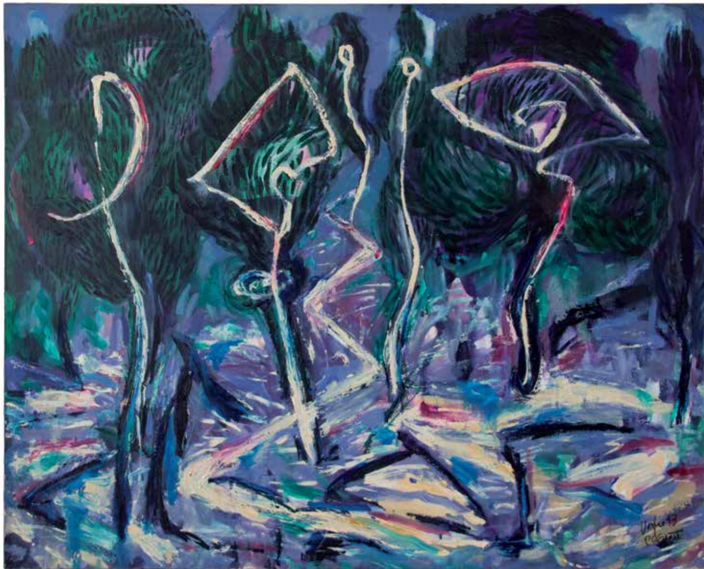
21. Ezoterični znaki duha časa II., 1993, akril, platno, 80,5 × 100,5 cm

na Fakulteti za strojništvo Univerze v Mariboru in bil tudi nosilec predmetov na študijskih programih Arhitektura na FGPA UM ter Oblikovanje tekstilnih materialov (OTM FS UM). Leta 2016 je prejel častni doktorat Univerze v Mariboru za prispevek k ustanovitvi in razvoju študijskega programa Inženirsko oblikovanje izdelkov na FS UM v Mariboru. Od 2010 do 2017 je bil predsednik Slovenskega združenja za barve, nadalje je njen podpredsednik, od 2019 je predsednik Društva likovnih umetnikov Maribora (DLUM) in med leti 2019 in 2021 podpredsednik Zveze društev slovenskih likovnih umetnikov (ZDSLUM). Živi in ustvarja v Mariboru.