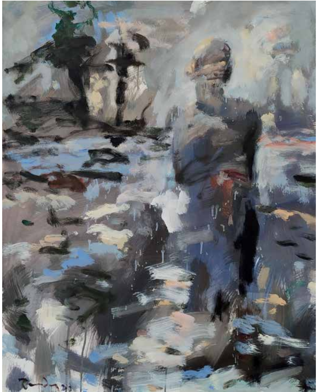
19. Anfortas – Kralj ribič, 2019, olje, platno, 100 × 80 cm