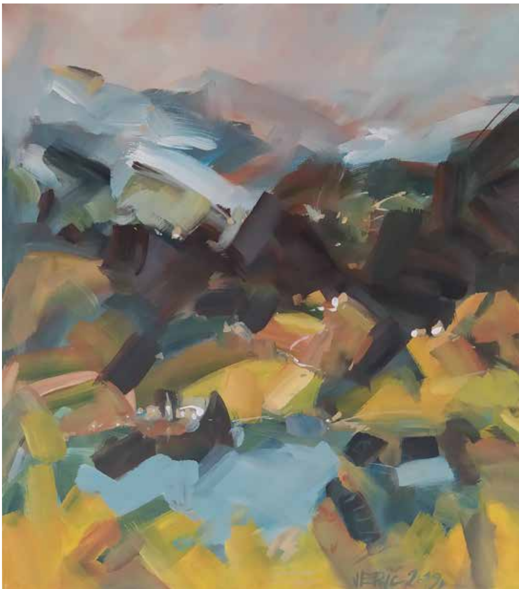
10. Sorajski razgled, 2019, akril, platno, 80 × 90 cm

Rodil se je leta 1948 v Mariboru. Diplomiral je iz slikarstva na Akademiji za likovno umetnost (prof. K. Meško). Je avtor scenskih postavitev in poslikav javnih prostorov. Za svoja dela je prejel več priznanj in nagrad. Njegova dela so razkrojljena po vsem svetu. Od leta 1983 je aktiven član DLUM, več let je bil tudi uspešen predsednik. Samostojno in skupinsko je razstavljal na mnogih razstavah doma in v tujini. Že desetletje organizira na umetniški domačiji Soraj slikarske taborne, kresovanja in razstave. Živi in ustvarja v Pernici pri Mariboru.