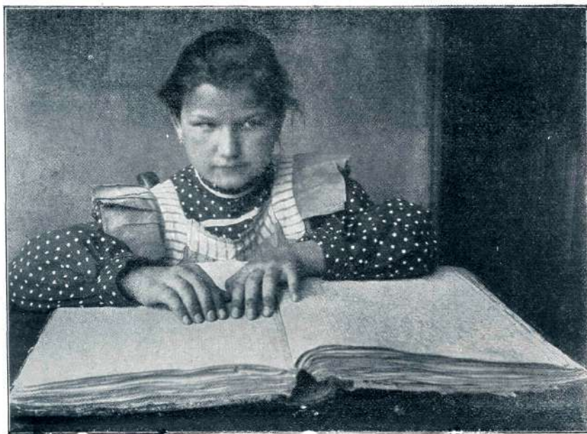
KAKO SLEPCI ČITAJO.