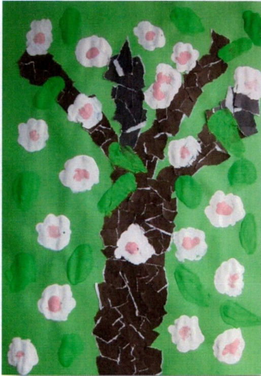
Slika 18 Lara Šterbal, 3. a