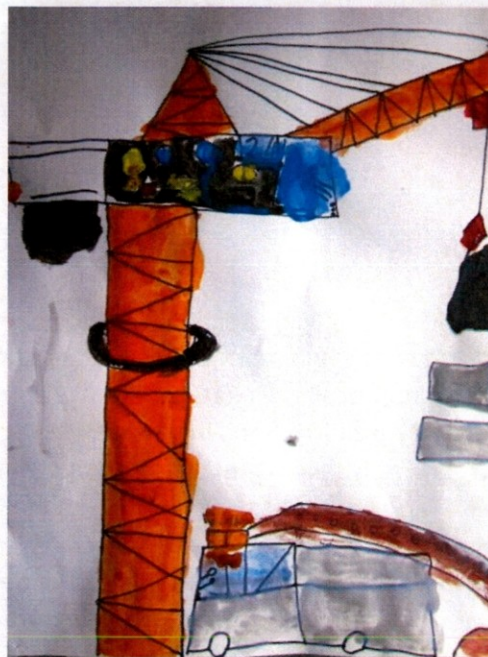
Slika 20 Alson Krasniq, 2.b

Spomnim se prvega razreda, ko smo se spoznali. Takrat smo šli na izlet na Tri kralje za en dan. Učila nas je učiteljica Olga. Veliko smo se igrali in pretepali.