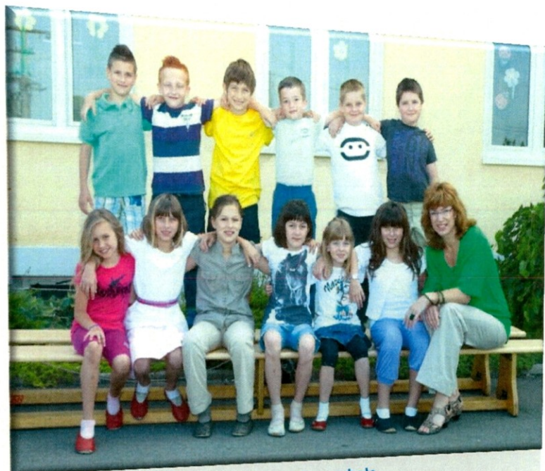
Slika 9