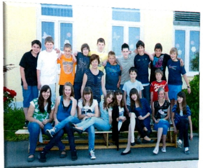
Slika 15