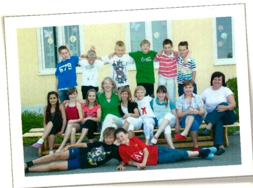
Slika 11

Naša razredničarka je Nataša Štumberger, ki je prijazna in nas veliko nauči. Najbolj veselimo, kadar pri telovadbi reče , da bomo igrali med dvema ognjema, saj imamo to igro najrajši.