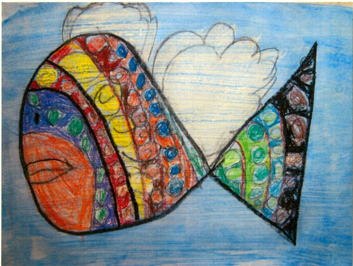
Slika 16 Filip Sitar, 2. b