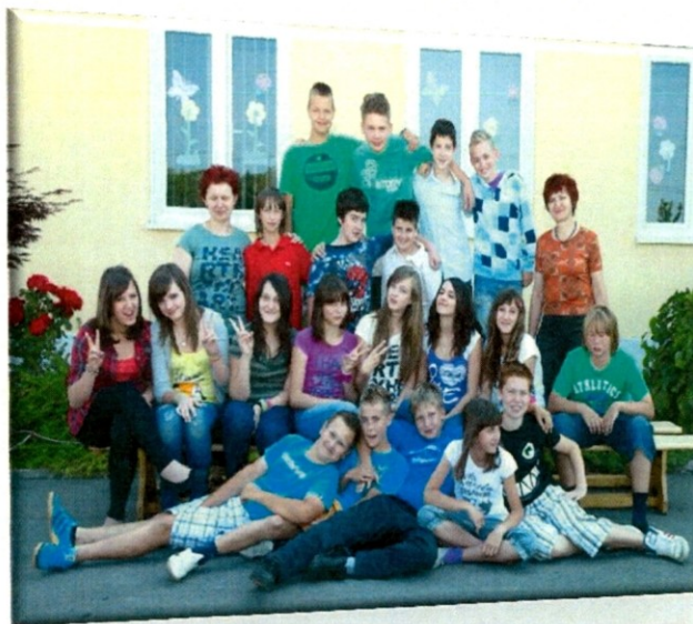
Slika 14

ves šolski red spremenimo. Cela šola nas pozna, naj bo slovenščina ali matematika, nam se delati ne da. Nekateri pišemo pesmice, zgodbice, nekateri pri folklori se vrte. Nekaterim gre šport, nekateri se učimo matematike. Nekateri pojejo, na inštrumente 'špilajo'. Tud' tekmujemo, čprav vedno ne zmagujemo. Nagajivi smo, a za ocene vsi se trudimo. Čprav učit'le jezimo, vseeno jih spoštujemo. Naj vsak še tak'drugачen bo,