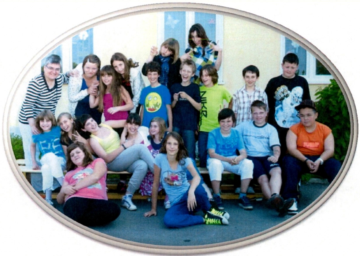
Slika 13