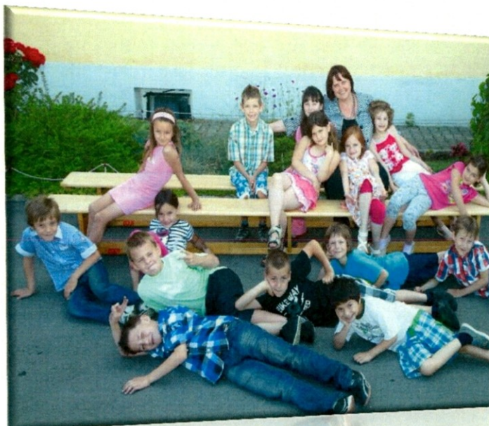
Slika 5

Ime mi je Lea. Pišem se Koderman. V družini smo štirje: ati, mami, Mitja in jaz. V hiši imamo tri stanovanja. Imamo igrišče, da lahko igramo nogomet, peskovnik in gugalnice. Rada se igram, igram računalniške igrice in jem pizzo. Imam zajčka Bonija in dve papigi po imenu Viki in Žutka. Rada imam sebe