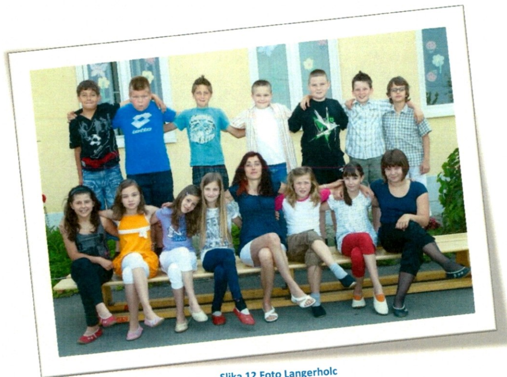
Slika 12