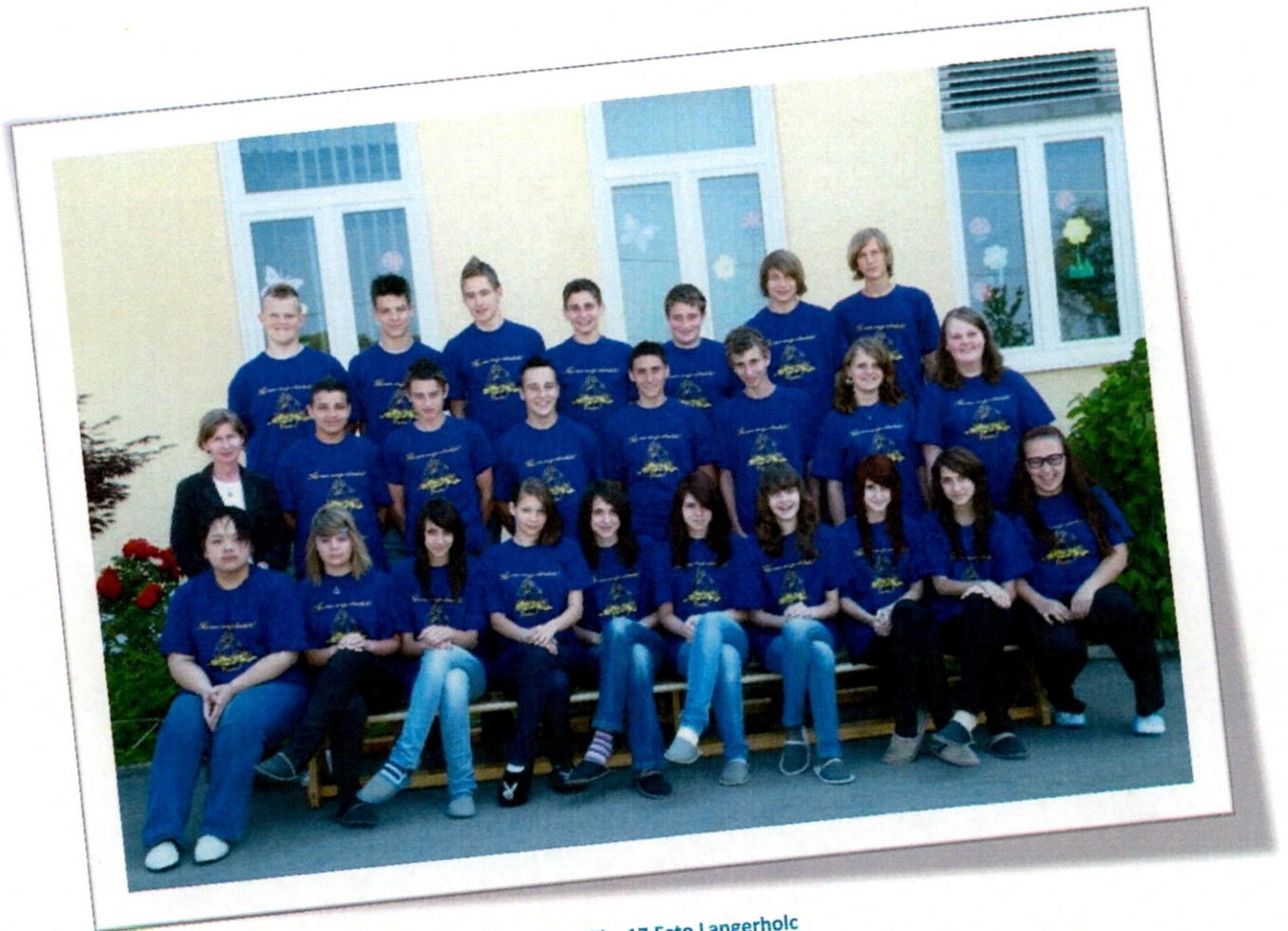
Slika 17