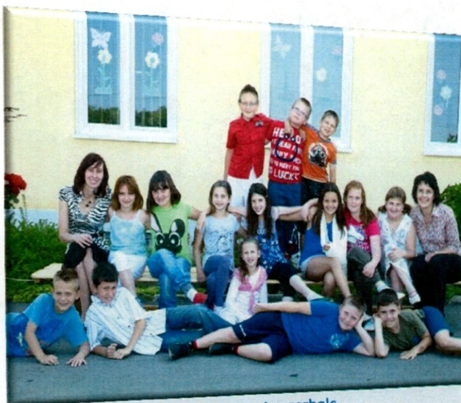
Slika 10

To smo učenci 3. b razreda. Če vas pa še karkoli zanima o nas, pa nas poiščite in vprašajte.