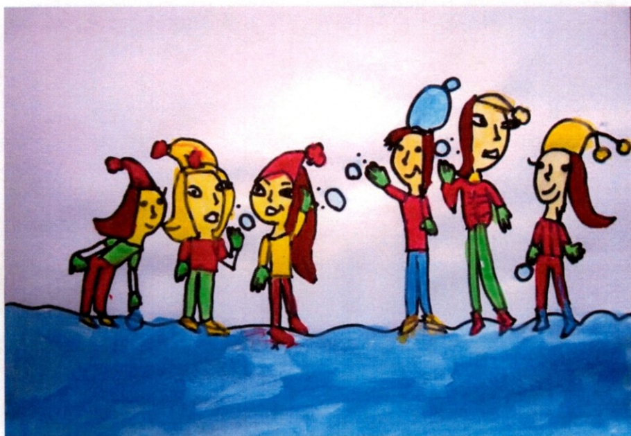
Slika 2 Lana Varžič, 1. A

Gabrijela Štumberger, 7. a z učiteljicami