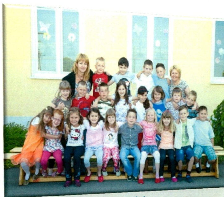
Slika 3