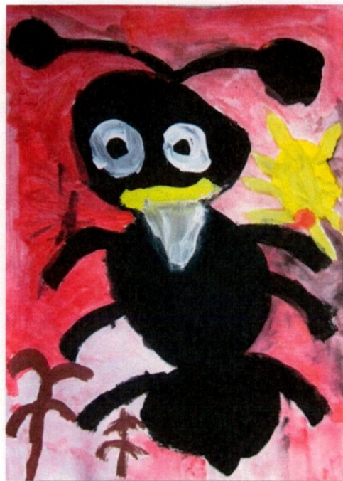
Slika 7 Nikola Tomanič, 2. b

Poznamo tudi veliko izgovorov, tukaj je eden izmed njih: »Učiteljica, jaz ne bom šel v telovadnico, ker sem imel žilo pretegnjeno.«