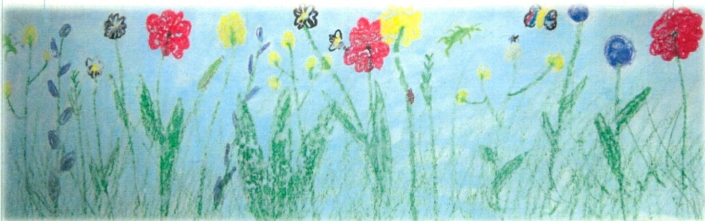
Slika 1 Jure Glodež, 3. a