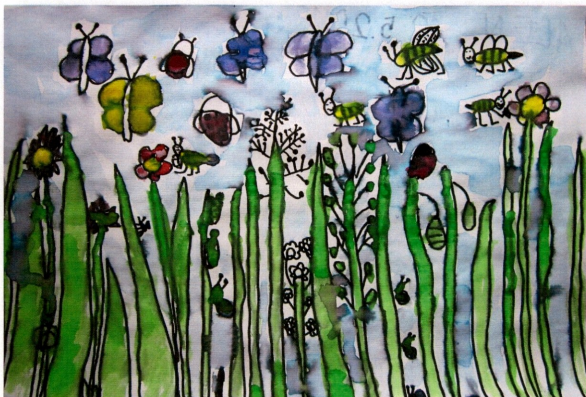
Slika 4 Alen Lončarič, 1. a

risanja, računalniške učilnice in mojih učiteljic.